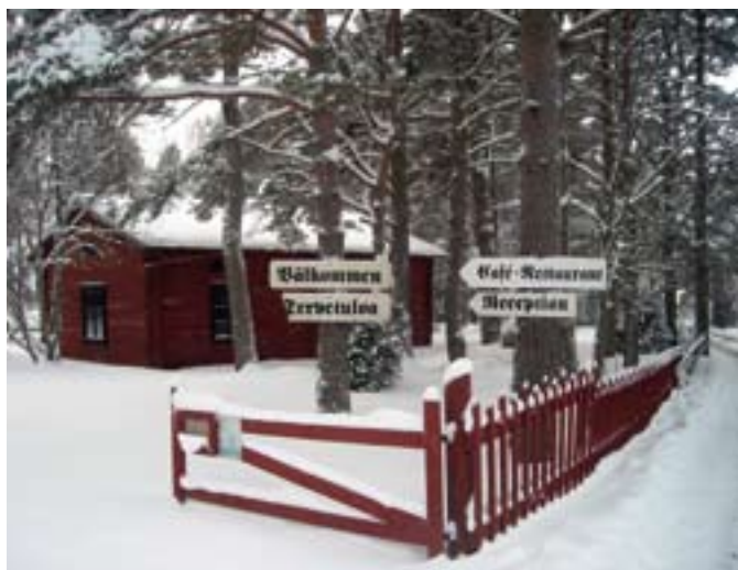
▲ El ecomuseo de Kilen en invierno.