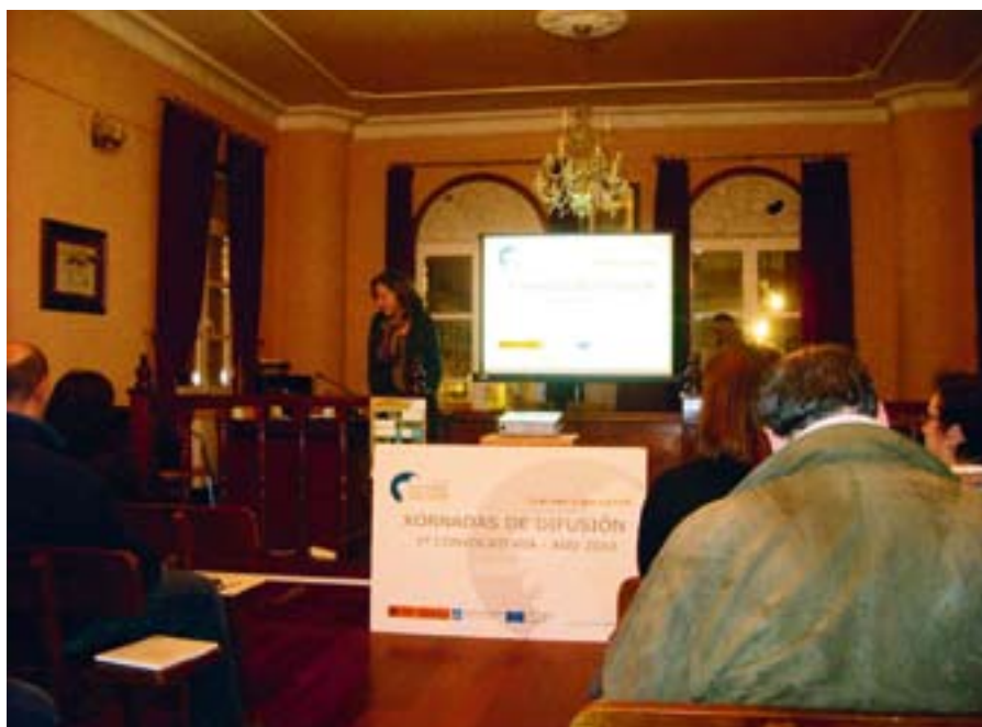
▲ Sesión informativa sobre el Eje 4 organizada por el FLAG de la Ría de Pontevedra (España).

ejemplo, la conversión de un puesto de socorro en un museo; un proyecto de energía renovable que utiliza bombas de calor y la creación de un parque temático submarino. Asimismo, la diversificación orientada a otras actividades económicas también constituye una prioridad para las estrategias de los FLAG portugueses.