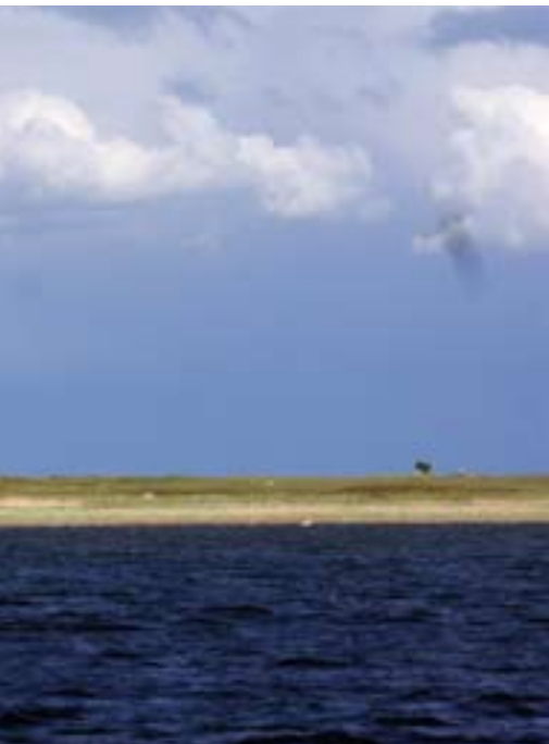
▲ Vista de la isla de Kihnu (Estonia).