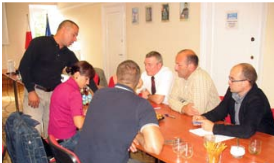
▲ Taller de formación organizado por la Agrolinia Association.

Además de impartir la formación, también era tarea de los docentes proporcionar apoyo complementario y asesoramiento (por teléfono o correo electrónico) a los grupos a los que formaban. Gracias a ello, los dirigentes de las asociaciones locales tuvieron la oportunidad de hacer preguntas o solicitar asesoramiento sobre cuestiones específicas que surgieron durante el proceso de preparación de sus estrategias.