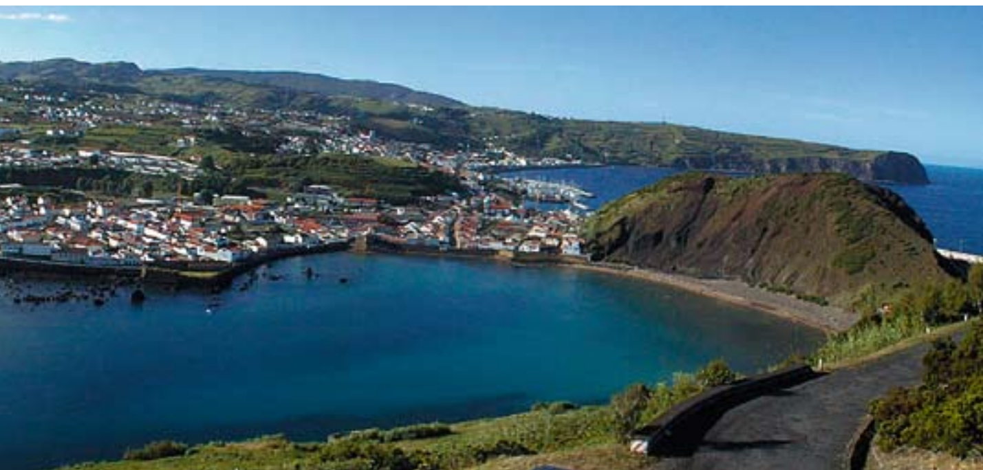
▲ Las Islas Azores (Portugal).