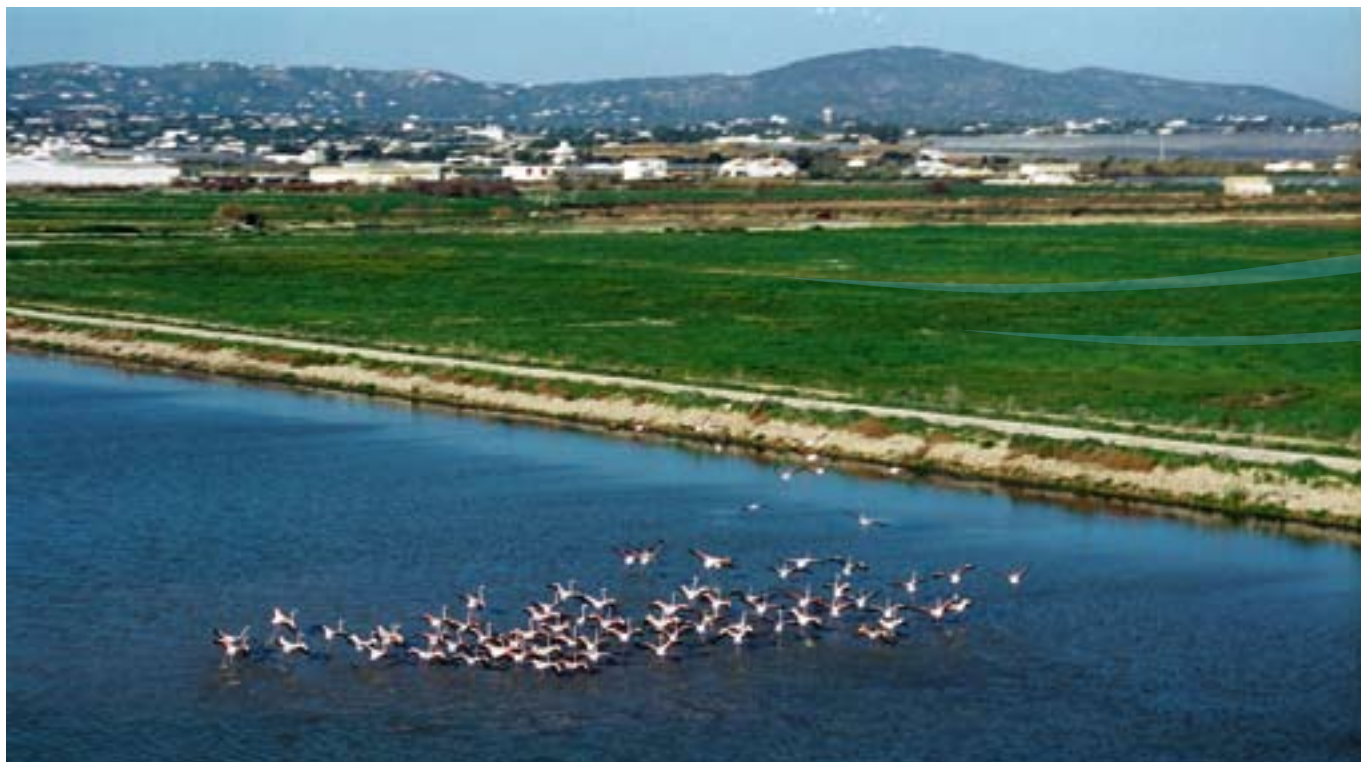
▲ Vista del parque natural de Ria Formosa en el Algarve (Portugal).

Por esta razón, la estrategia destaca la necesidad de establecer «nuevas formas de gobernanza que actualmente no están presentes en el territorio» y que deberían hacer posible: