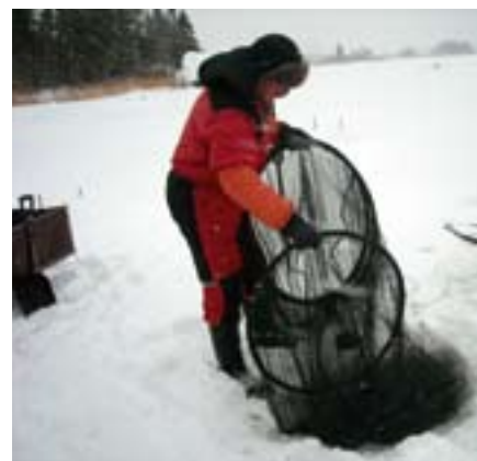
▲ Pescando en el hielo.