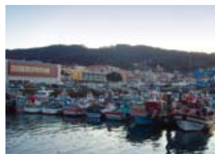
▲ El puerto de Bueu.