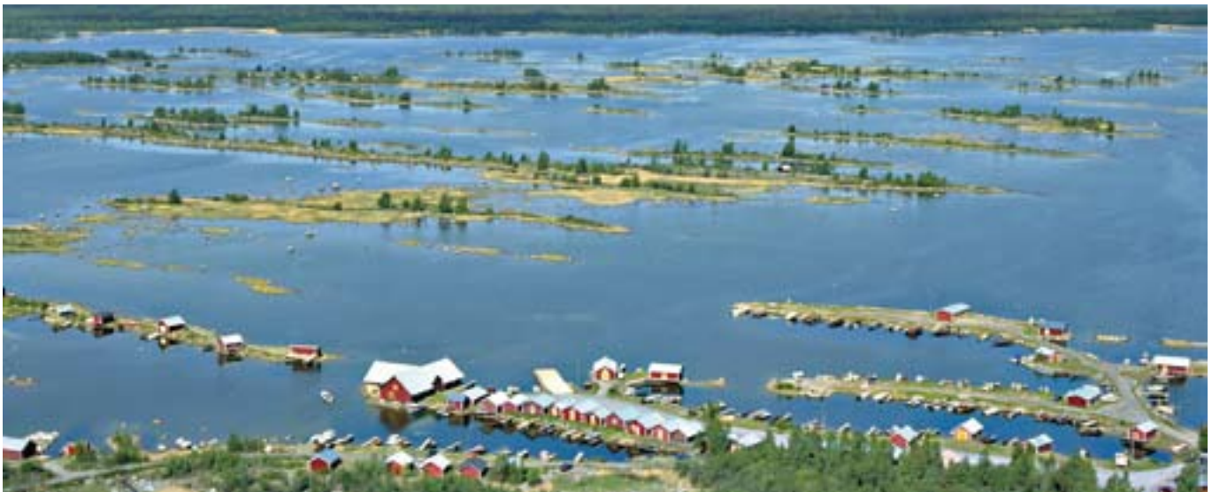
▲ El excepcional ecosistema del Archipiélago de Kvarken tiene un enorme valor para la región pesquera de Österbotten.

Según el Grupo de Acción Local de Ostrobothnia, la pesca todavía tiene futuro. Si se consiguen reforzar los lazos con la región y modernizar y ampliar la gama de productos y las oportunidades de mercado, la pesca puede contribuir a que los jóvenes permanezcan en la región y los pueblos costeros sigan teniendo vida.