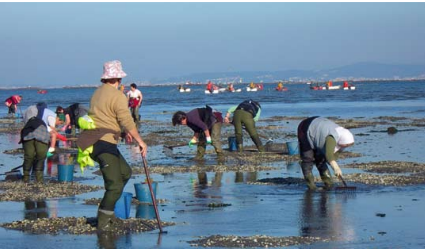
▲ En Cambados hay 200 mariscadoras profesionales.

se adoptan anualmente. Esta organización y estructuración en cadenas de suministro de especialistas protege su actividad de la pesca incontrolada y les permite gestionar sus capturas e incrementar los ingresos. Una mariscadora que, antes de establecerse la agrupación, declaraba unos ingresos medios de 600 euros anuales, ahora declara 700 al mes! 2 El meollo de la estrategia de Galicia para el Eje 4 lo constituye fomentar las organizaciones locales en la pesca y en sus actividades relacionadas.