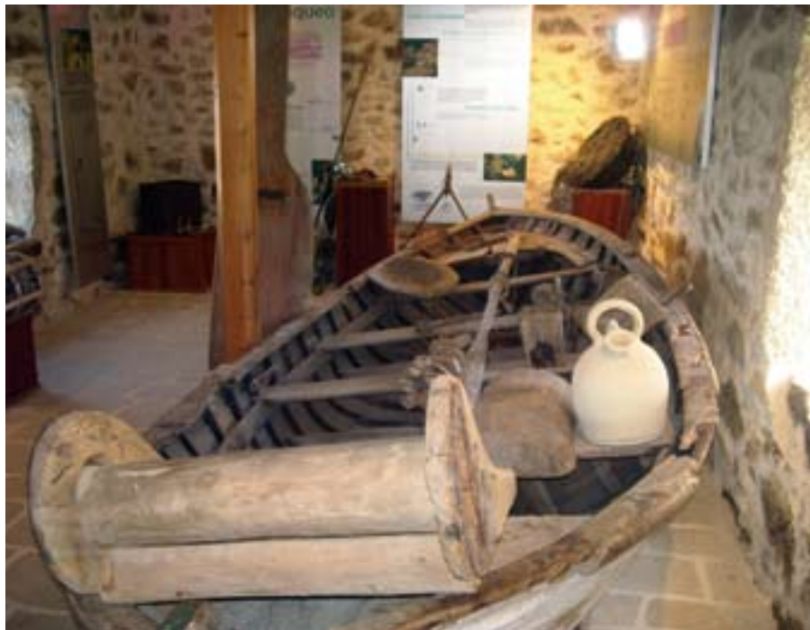
▲ El centro de visitantes de Lira es el punto de partida de seis rutas temáticas.

«Nos gustaría ofrecer viajes en barco por el mar, deteniéndonos en algunos lugares importantes tanto desde el punto de vista cultural como de la economía local. El proyecto pretende reforzar los lazos existentes entre la pesca y el resto de sectores de la sociedad. Presentamos la solicitud conforme al Eje 3, pero algunos de los aspectos inmateriales – como la información o la promoción, etc. – podrían financiarse con el Eje 4», afirma el patrón mayor de la cofradía y comenta: «Hablando en general, el Eje 4 podría ayudarnos a completar el proceso que hemos empezado de incremento del valor añadido de nuestra pesca y de una mayor profesionalización de las personas que trabajan en este sector, además de fomentar una mayor integración y cooperación con el resto de agentes y sectores productivos de la zona. Eso es lo que sacamos en limpio de la jornada de información que se mantuvo el otro día con el GAC».