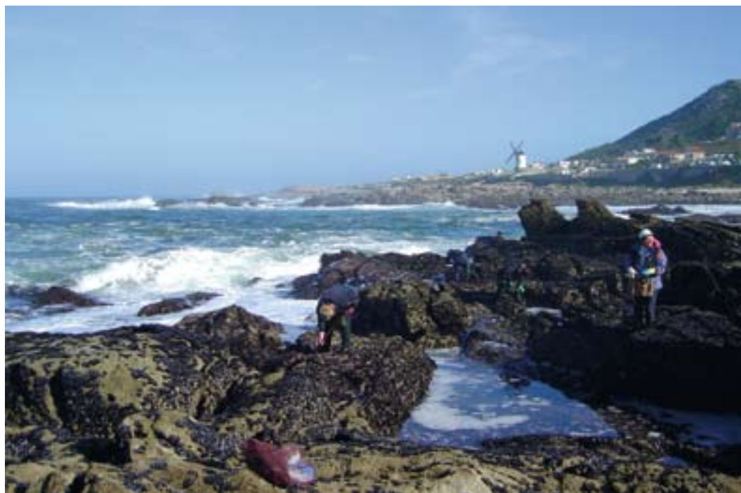
▲ Recogiendo percebes cerca de Baiona.