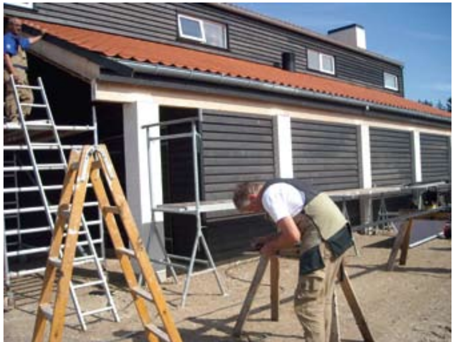
▲ Construcción de un restaurante especializado en pescado en Hune (Dinamarca).