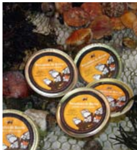
▲ Percebes en lata camino del mercado.