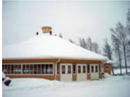
▲ Sala multiusos en el pueblo costero de Molpe reformada gracias al apoyo del programa Leader.