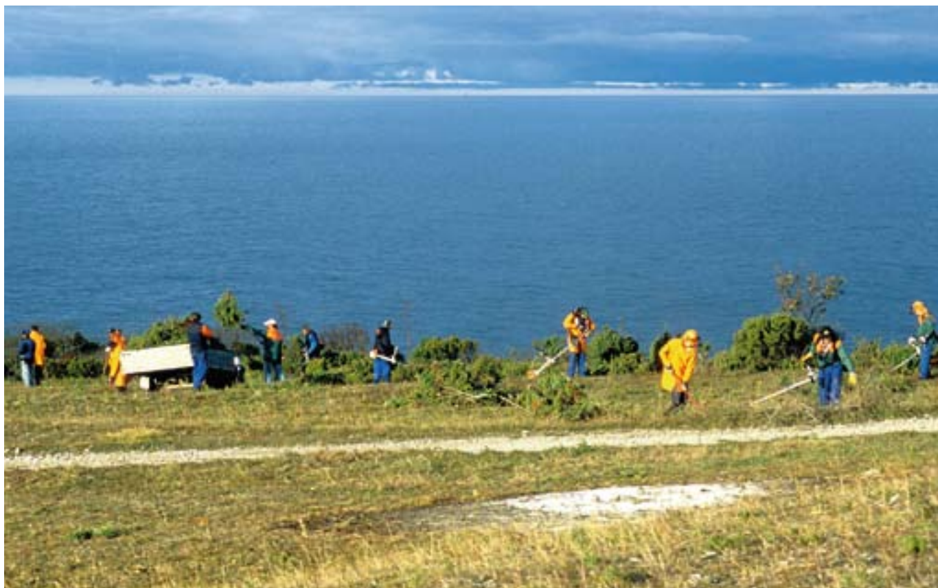
▲ Recuperación de los hábitats alvar en la isla de Stora Karlsö (Suecia).