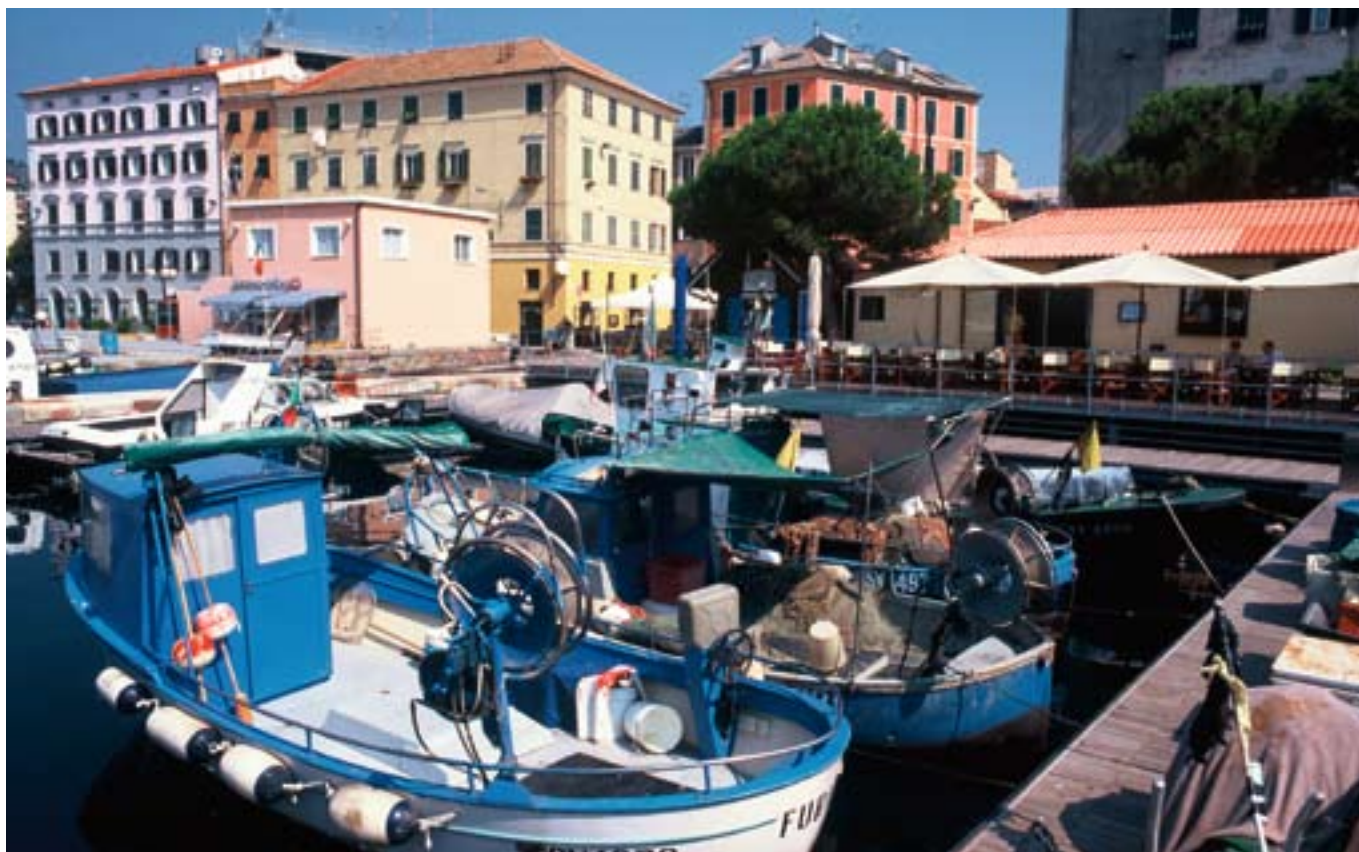
▲ La pesca y el turismo van de la mano en Savona (Italia).