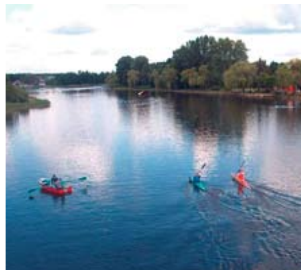
▲ Navegando en kayak en Augustów, «la ciudad de los tres lagos» en Podlaskie.

Se espera que la inmensa mayoría de los grupos que participaron en el programa de capacitación presenten sus solicitudes. En Polonia, la convocatoria de propuestas se puso en marcha en noviembre del 2009 (véase el recuadro) y se pidió a los grupos que presentaran sus estrategias antes de finales de marzo del 2010. ■