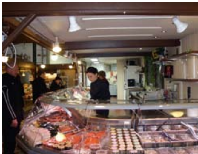
▲ El mercado de pescado de Vaasa constituye una buena salida para las capturas locales.

Cuando vemos la sencillez de su puerto deportivo y los pocos barcos pequeños que atracan allí hoy en día, nada nos indica que hasta finales del siglo XIX en este puerto había astilleros importantes en los que se construyeron alrededor de 70 grandes veleros. Aunque eso fue antes de la llegada de la siderurgia. Fue el acero, junto con la elevación terrestre, quien llevó al puerto a su actual situación.