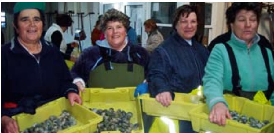
▲ Mariscadoras mostrando la recolección del día.

En la región pesquera más importante de Europa, se han constituido siete «grupos de acción costera» financiados por el Eje 4 del FEP que definirán los proyectos que deberían reforzar la estrategia local de desarrollo y complementar las medidas adoptadas en el ámbito local que ya estén en marcha.