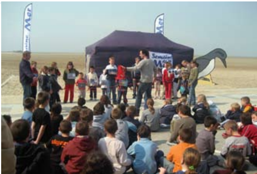
▲ Tomando conciencia de la vida en el mar en Nord-Pas-de-Calais (Francia).