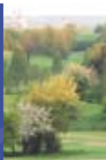
Polonia: una gran entrada