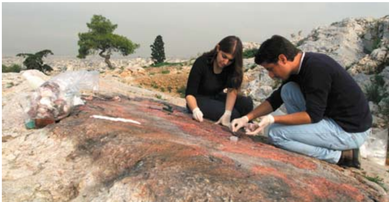
La limpieza de los sitios arqueológicos requiere un trabajo minucioso.