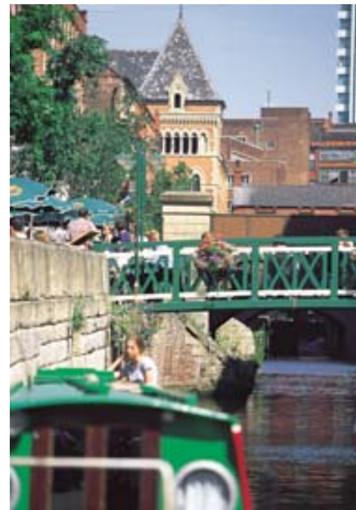
En el centro renovado de Manchester.

El futuro de la política de cohesión de la Unión Europea debe comprender la dimensión urbana de la política de cohesión en todos sus aspectos. Esta implica el papel de los Fondos Estructurales, las ayudas de Estado, la política de transporte y todos los aspectos que afectan a las