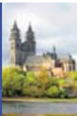
Sajonia-Anhalt: conjugar ciencia y economía