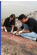
La unificación de las zonas arqueológicas de Atenas (Grecia)