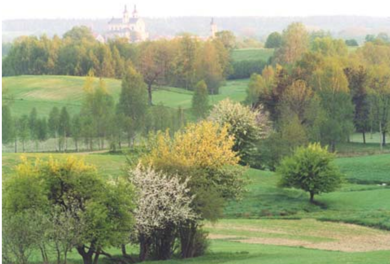
Entorno de Suwalski, en el «País de los 1.000 lagos», en la extremidad del noreste de Polonia.

16 regiones. En 2002, el país designó las estructuras de gestión que se encargarán de aplicar los Fondos Estructurales y los Fondos de Cohesión. Presentó a la Comisión su primer plan de desarrollo nacional para el período 2004-2006, que servirá de base para establecer el marco comunitario de ayuda.