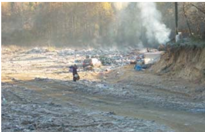
Vertedero en la región de Vilnius.