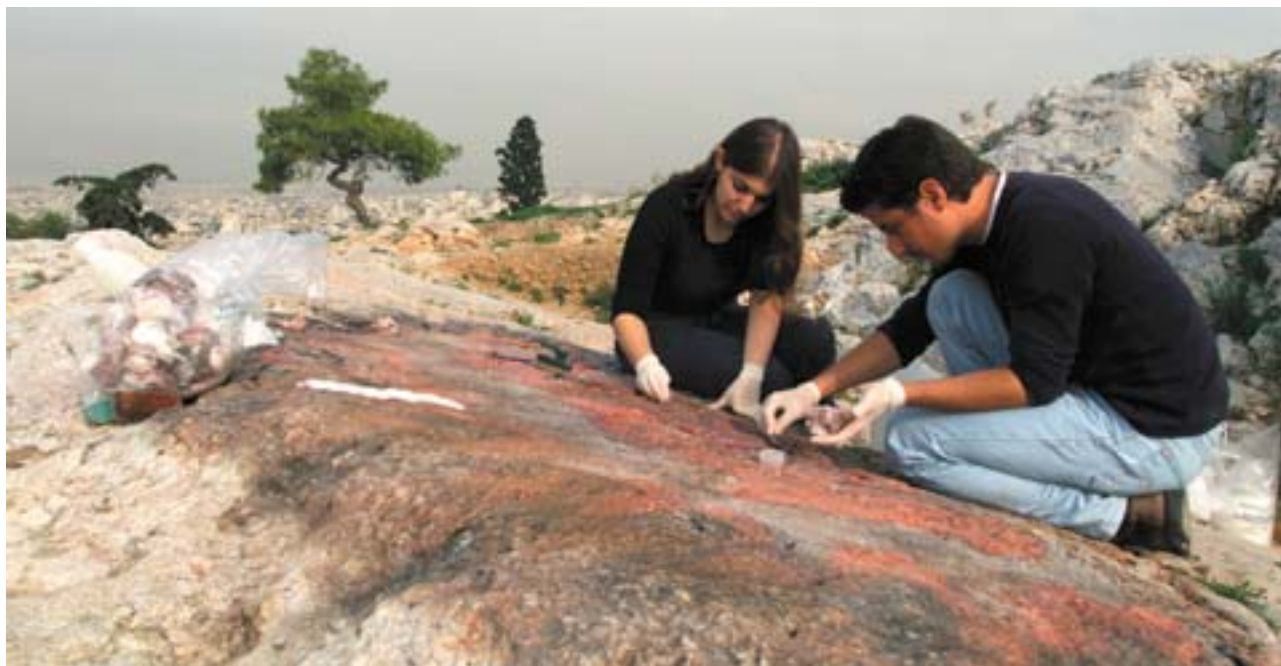
Nähtävyyksien puhdistaminen on tarkkaa työtä.