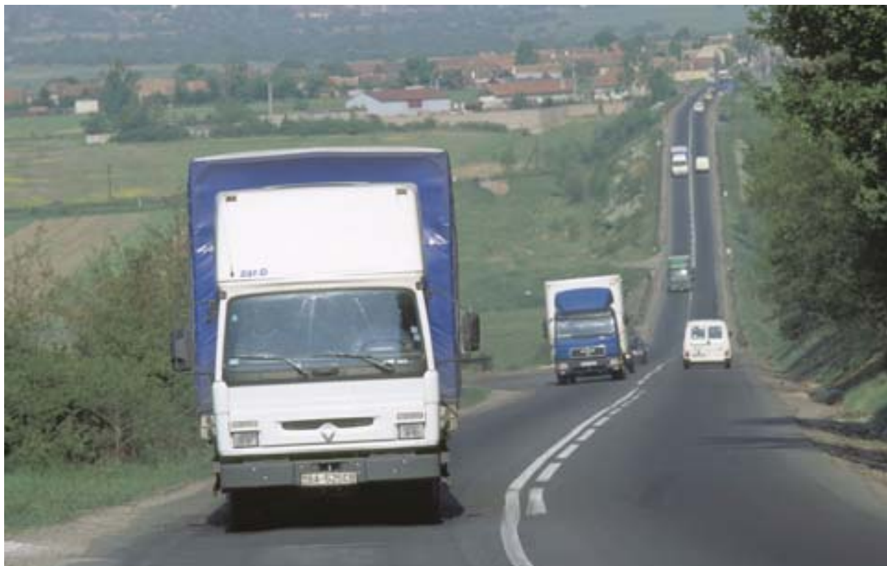
Tämä tie Romaniassa on kunnostettu yhteisön varoin.

Asian tärkeys on edellisistä laajentumisista poiketen saanut unionin laatimaan erityisen liittymistä edeltävän strategian, jonka mukaisesti kymmenelle Keski- ja Itä-Euroopan hakijamaalle myönnetään rakennetukia jo ennen niiden liittymistä. Kokonaismäärältään liittymistä edeltävät tuet