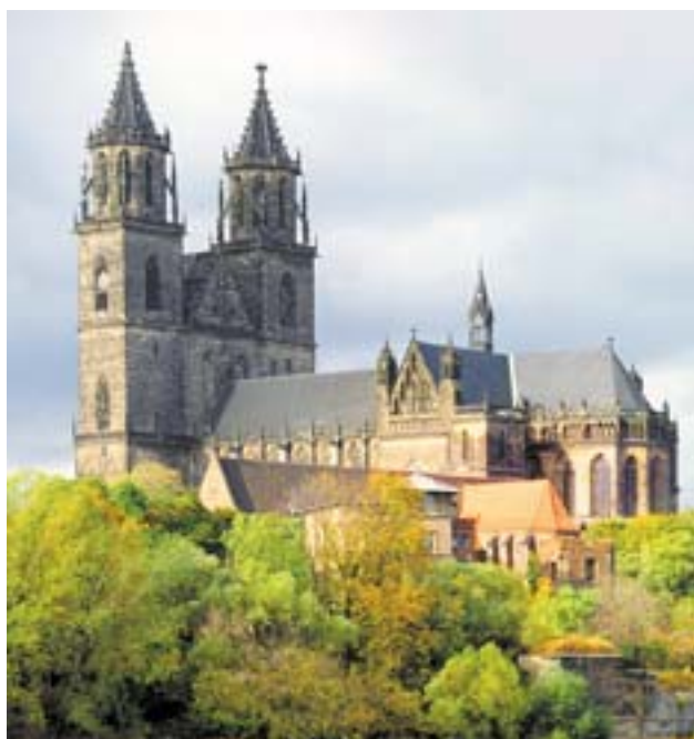
De kathedraal van Maagdenburg.

Verbindungsbüro des Landes Sachsen-Anhalt Boulevard Saint-Michel 78 B-1040 Brussel Tel. (32-2) 741 09 31 Fax (32-2) 741 09 39 E-mail: wobben@vb-bruessel.stk.lsa-net.de