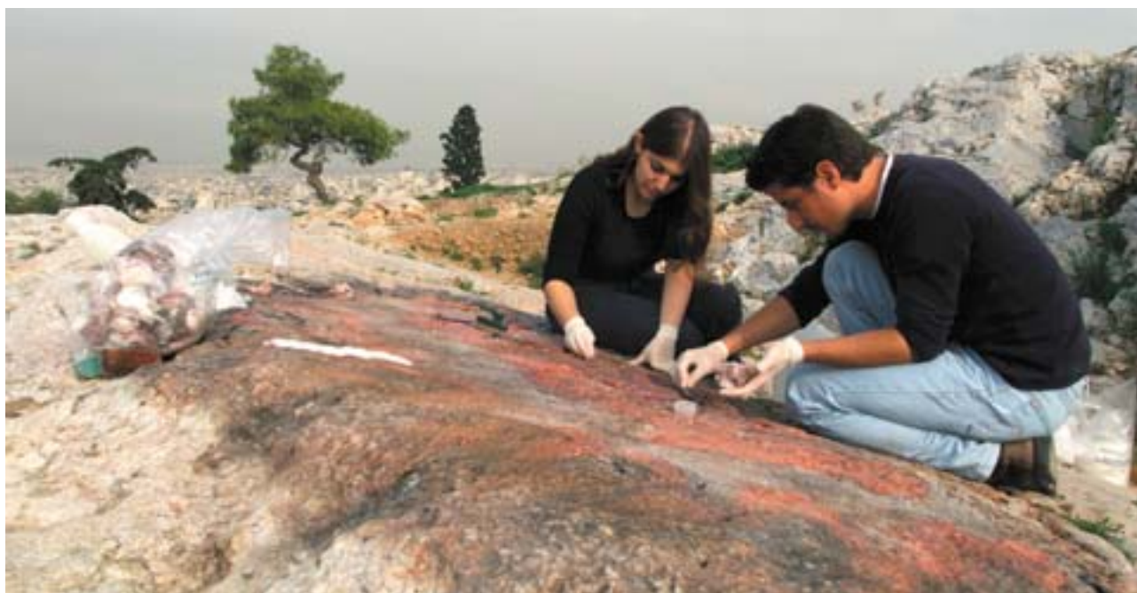
Het schoonmaken van de vindplaatsen is precisiewerk.

(EAXA SA) zetten zich sinds 1994 in voor de aanleg van een archeologisch park dat een oppervlakte van 700 ha beslaat. Beter gezegd gaat het, zoals architect Dora Galani uitlegt, om „de aanleg van een voetgangerszone die zes archeologische vindplaatsen onderling met elkaar verbindt, de aanleg van groenstroken en overdekte plekken en om de restauratie en de bescherming van monumenten”. De toename van het aantal groenstroken en de beperking van het autoverkeer rondom de stad, zorgt voor een afname van de vervuiling en draagt bij aan de verbetering van de verkeersomstandigheden en het stedelijk milieu van Athene. De verbinding van de archeologische vindplaatsen heeft echter niet alleen