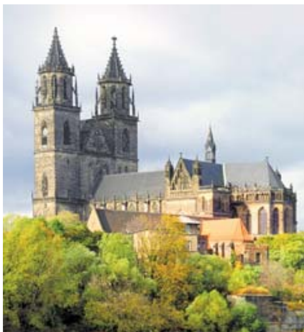
Katedralen i Magdeburg.

Verbindungsbüro des Landes Sachsen-Anhalt Boulevard Saint-Michel 78 B-1040 Bryssel Tfn (32-2) 741 09 31 Fax (32-2) 741 09 39 E-post: wobben@vb-bruessel.stk.lsa-net.de