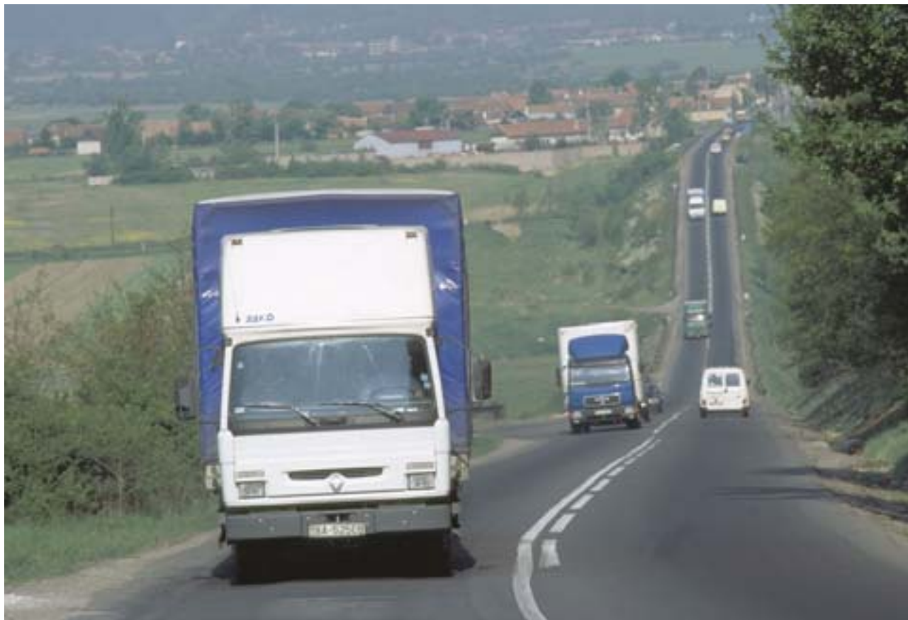
Den här rumänska vägen har kunnat förbättras med hjälp av finansiering från gemenskapen.

Utmaningens omfattning har, i motsats till tidigare utvidgningar, föranlett unionen att utarbeta en ”strategi för föranslutning” och att anslå strukturstöd till de tio CÖE-länderna inför anslutningen. Förhandsstöden uppgår till ett totalbe-