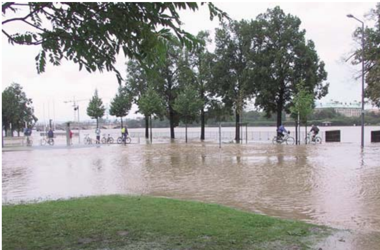
Αύγουστος 2002: η αύξηση της στάθμης των υδάτων του ποταμού Έλβα στη Δρέσδη (Γερμανία).

μεγαλύτερη από 350 000 εκτάρια, εκ των οποίων σχεδόν 300 000 εκτάρια αποτελούνταν από δάση (6 % του συνόλου των πορτογαλικών δασών), και 25 000 γεωργικών εκτάσεων, στοίχισαν τη ζωή σε 18 άτομα και στέρησαν 45 000 άλλα άτομα από την περιουσία τους ή τους πόρους εισοδήματός τους. Χωρίς να υπολογίσουμε —στην Πορτογαλία όπως και τις άλλες περιφέρειες του Νότου— τις