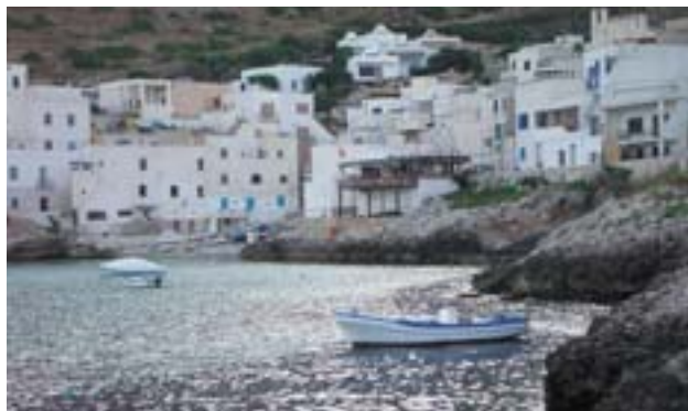
Μερική άποψη του λιμανιού της πόλης Trapani.

Η ανάπτυξη του μεγαλύτερου νησιού της Μεσογείου δεν είναι ομοιόμορφη: από τη μια οι πυκνοκατοικημένες ακτές της αποτελούν πολύ σημαντικούς οικονομικούς πόλους έλξης· από την άλλη, οι αραιοκατοικημένες περιοχές στο εσωτερικό της πλήττονται από έντονη απομόνωση.