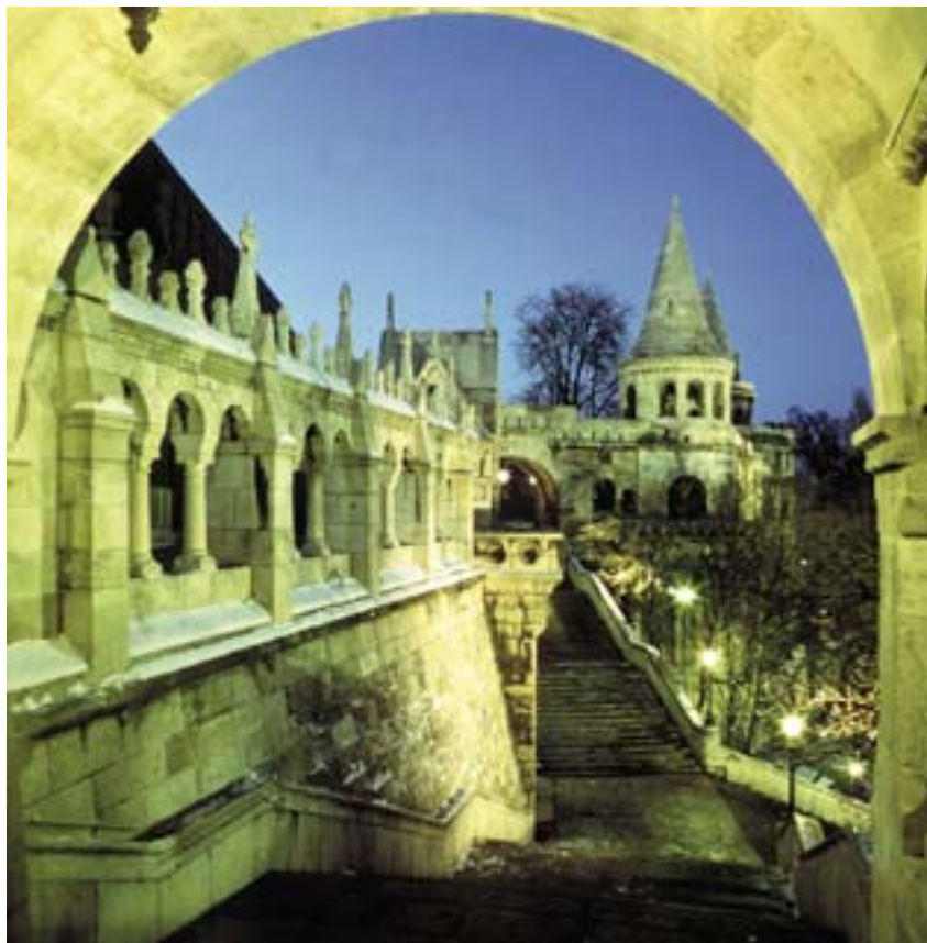
Η «Επαλξη των ψαράδων» στη Βουδαπέστη.

περιλαμβανομένου και του τομέα των γεωργικών προϊόντων διατροφής.