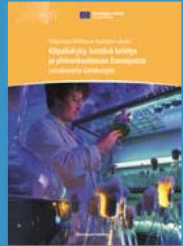
Saatavana EU:n 11 virallisella kielellä.

Aluepolitiikan vaikutukset Lissabonin ja Göteborgin Eurooppa-neuvostojen määrittelemien tavoitteiden toteutumiseen 26 esimerkkihankkeen avulla esitettynä.