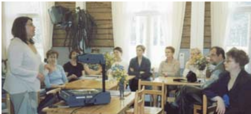
Seminaarit ja konferenssit rikastuttavat ohjelmaa.

Eri puolille maata tehtävillä yritysvierailuilla osallistajat pystyvät vaihtamaan kokemuksiaan muiden maakuntien vastaavien naisyrittäjien kanssa. Lähtöruutu antaa lisäksi mahdollisuuden osallistua messuille ja myyntitapahtumiin.