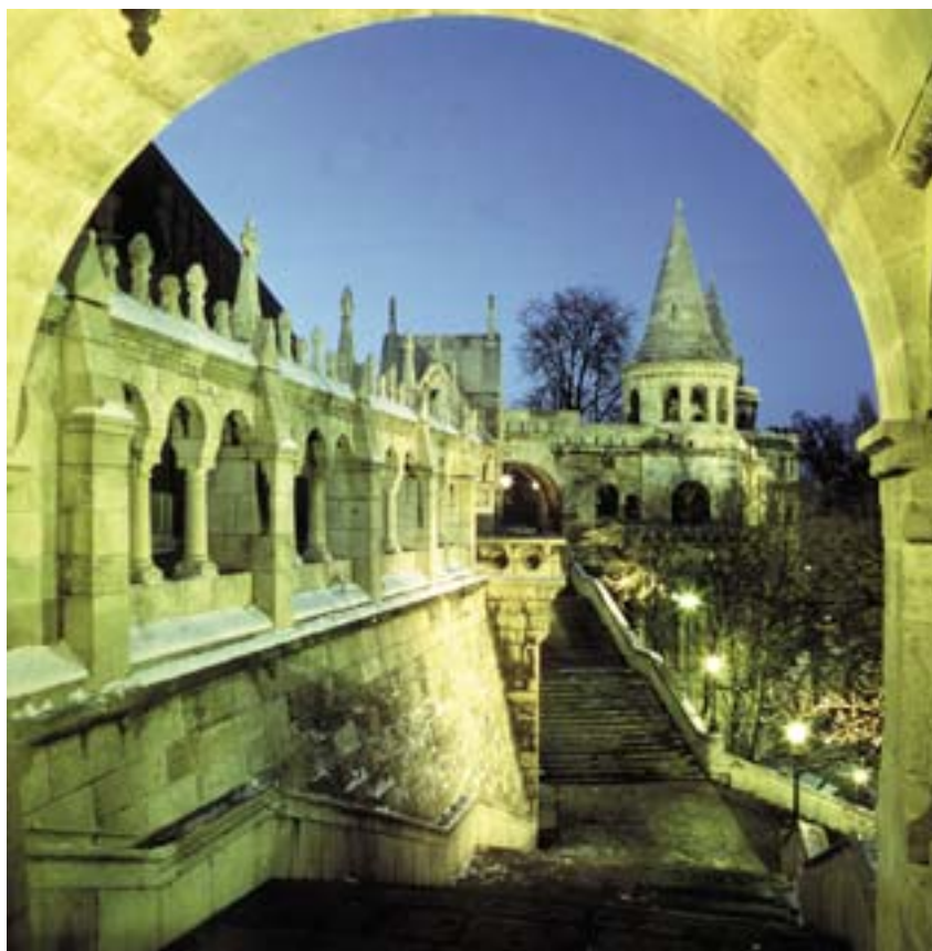
"Kalastajien linnake" Budapestissä.

Erityisesti vientipainotteiset alat, maatalous ja elintarviketeollisuus mukaan luettuina, ovat toimineet talouden nousun vetureina.