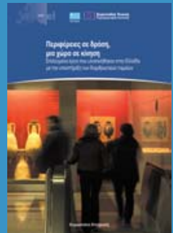
Saatavana englanniksi, kreikaksi ja ranskaksi.

26 esimerkkiä Kreikassa onnistuneista hankkeista.