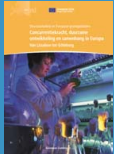
Beschikbaar in de elf talen van de Unie.

De bijdrage van het regionaal beleid tot het realiseren van de doelstellingen van de Europese Raad van Lissabon en van Göteborg, aan de hand van 26 projecten met voorbeeldfunctie.