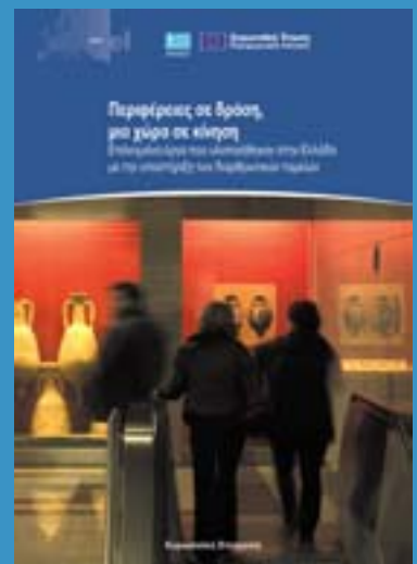
Beschikbaar in het Engels, Frans en Grieks.

26 voorbeelden van geslaagde projecten in Griekenland.