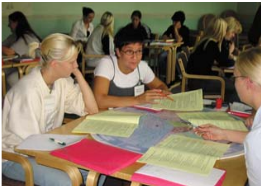
Studenten zijn geïniteerd in marketing door middel van de stage „De droomonderneming“ in augustus 2003.

Het „Naisyrittäjän Lähtöruutu“-project („Uitgangspunt voor ondernemende vrouwen“), dat op wedijver en op persoonlijke begeleiding gebaseerd is, is erop gericht om een zo groot mogelijk aantal vrouwen ertoe aan te zetten hun eigen onderneming op te richten, te leiden en — dat is nog het belangrijkste — duurzaam te maken.