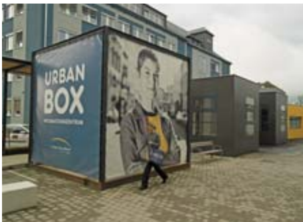
Nový technický institut FH Joanneum v Grazu (Rakousko), který se nachází v bývalé průmyslové oblasti a který byl díky podpoře URBAN přetvořen na high-tech komplex.