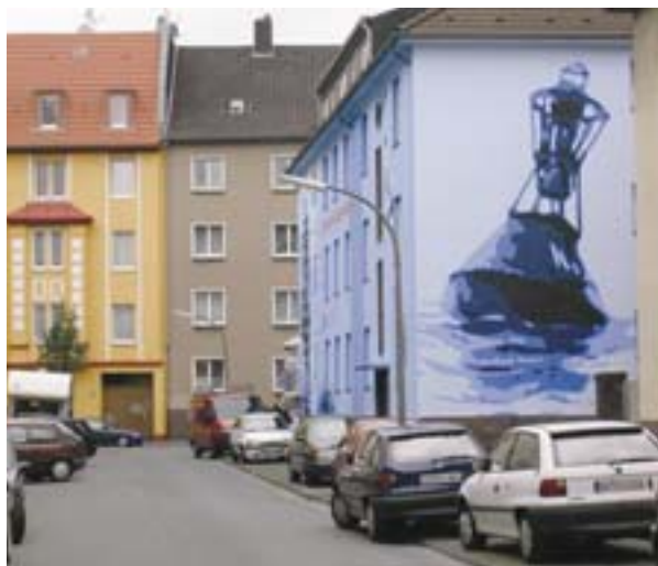
Pohled na natřené fasády, což bylo provedeno v rámci akce URBAN pro obnovu městských částí v Dortmundu.

podpořilo jeho údržbu a zajištění bezpečnosti tím, že byl zaveden systém „městských stevardů“ nebo „strážníků prostoru“. Takto jich je 18 najato v rámci spolkového programu pro navrácení do pracovního procesu a určeno pro dohled nad čistotou, bezpečností či dokonce nad útluností ulic a náměstí v Nordmarktu. „Jedná se o jednoduché úkoly, které jsou však velice symbolické, jako např. požádat obyvatele, aby vyhazovali své odpadky do popelnic, nebo pomoci školákům přejít ulici; tyto úkoly napomáhají získat sebeúctu dříve vyloučeným osobám a přispívají k obnovení společenských vztahů,” vysvětluje Bernd Axmann, vedoucí projektu v rámci podniku pro sociální integraci Grünbau GmbH, která systém zajišťuje.