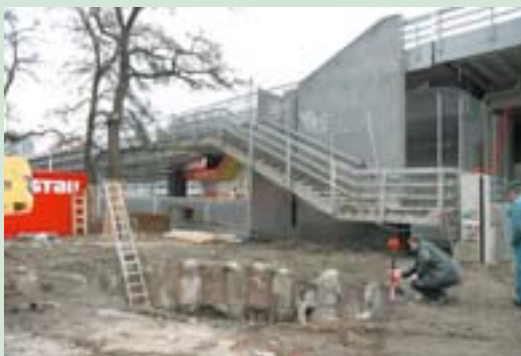
Nahoře a dole: práce na úpravě stanice metra Florenc-B v Praze.

Velkým cílem programu Cíle 2 pro Prahu je vytvořit z hlavního města České republiky dynamickou evropskou metropoli, která bude hrdá na to, kam patří.