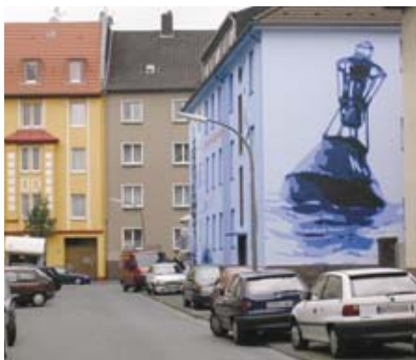
Et glimt fra et projekt, som går ud på at male facader, og som afholdes under Urban-aktionen om renovering af bykvarterer i Dortmund