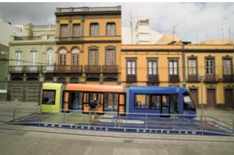
I Santa Cruz (Kanarieøerne, Spanien) fungerer dette køretøj som kampagnevogn for det nye kollektive transportsystem.