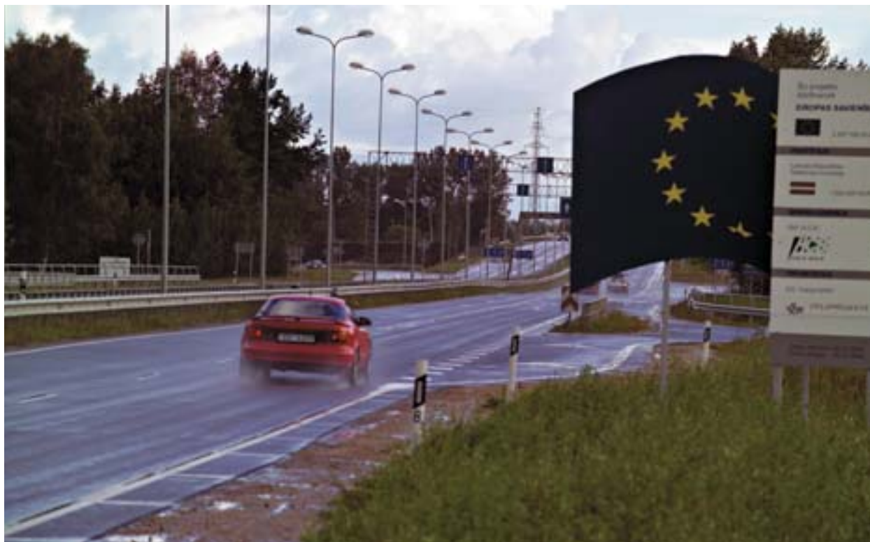
■ Dette Phare-projekt har givet byudviklingen luft under vingerne ved at forbedre adgangen til lufthavnen i Riga (Letland).