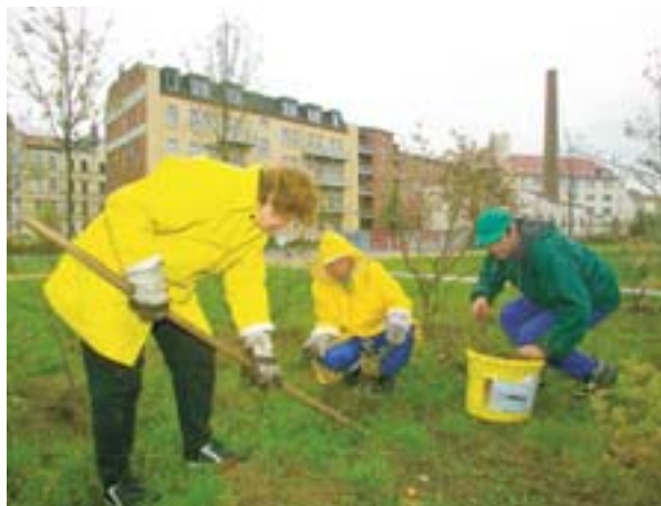
Una brigada verde en acción en el Henriettepark, en el centro de la zona URBAN de Leipzig.