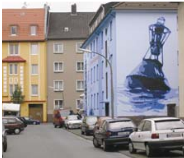
Un aspecto de la operación de pintura de fachadas llevada a cabo en el marco de la acción URBAN de renovación de barrios, en Dortmund.