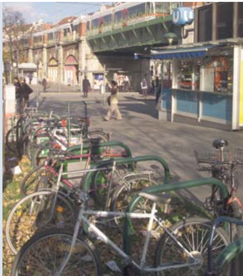
■ Sitio para las bicicletas en el centro de la ciudad de Viena (Austria), renovado con la ayuda de URBAN.

En 2005, se organizaron más de 100 seminarios de trabajo en el marco de URBACT, agrupando cada uno de 20 a 30