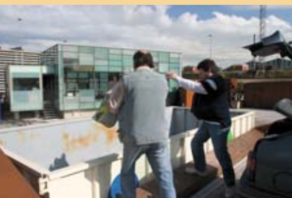
El “punto de limpieza” en Gijón.

Con el fin de transformar estas prioridades en acciones, se tuvieron en cuenta algunos grandes principios que producen un efecto palanca y valor añadido, en particular, el enfoque integrado y la búsqueda de sinergias con otras acciones públicas y privadas. Dos ejemplos pueden ilustrar estas observaciones.