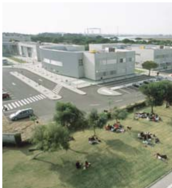
Universidad de Cádiz (España), Departamento de Ciencias marinas: un campus abierto a la investigación.

Las ciudades europeas no carecen de ejemplos de buenas prácticas. En vez de malgastar recursos valiosos en reinventar la rueda, las ciudades deben sacar el mejor partido de la experiencia acumulada por el programa URBACT y otras redes europeas y nacionales. A este respecto, la Comisión prevé ampliar el intercambio de experiencias, hasta ahora limitado a las ciudades participantes en la iniciativa URBAN, a todas las ciudades de Europa.