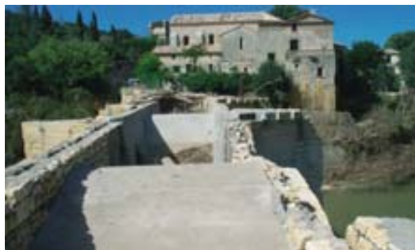
Most Svatého Mikuláše zničený řekou Gardon (nahore) a jeho přesná rekonstrukce