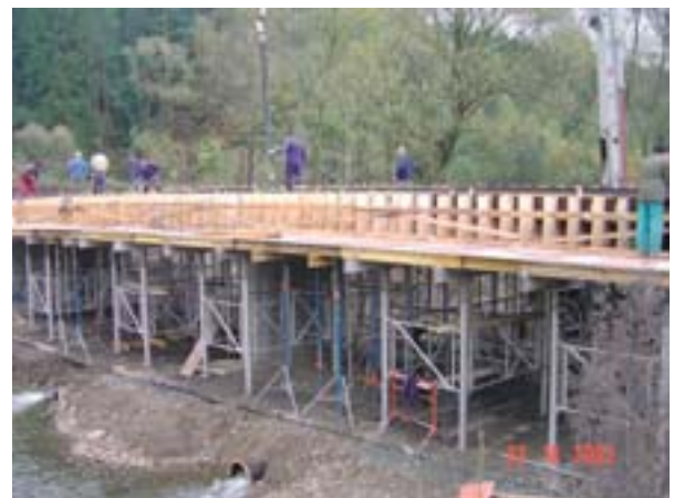
Ανακατασκευή μιας γέφυρας στην περιφέρεια Pilsen (Τσεχική Δημοκρατία).

Όλοι αυτοί οι όροι πρέπει να πληρούνται για να είναι δυνατόν να χαρακτηριστεί η καταστροφή ως «ασυνήθης» εφόσον υπερβαίνει από τη φύση της, από το μέγεθος των προκαλούμενων ζημιών ή από την επίπτωσή της στην εξεταζόμενη περιφέρεια αυτό που θα ήταν λογικά αναμενόμενο. Από τον Δεκέμβριο του 2002 μέχρι τον Σεπτέμβριο του 2004, η Επιτροπή έκρινε ότι μόνο έξι από τις αιτήσεις αυτού του τύπου πληρούσαν αυτά τα κριτήρια και πρότεινε, κατά συνέπεια, την ενεργοποίηση του ταμείου. Άλλες τέσσερις αιτήσεις απορρίφθηκαν.