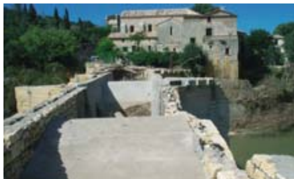
Η γέφυρα Saint-Nicolas που καταστράφηκε από τον Gardon (πάνω) και αποκαταστάθηκε στην αρχική της μορφή (κάτω).

Η πλήρης αποκατάσταση της γέφυρας Saint-Nicolas στην αρχική της μορφή, σε απόσταση δέκα χιλιομέτρων πριν από τη γέφυρα του Gard, είναι ένα αξιοσημείωτο παράδειγμα συνεργειών που, κατά κάποιον τρόπο, επιβλήθηκαν από την υλοποίηση της παρέμβασης του Ταμείου Αλληλεγγύης. Παρά τις καμάρες ύψους 19 μέτρων, αυτή η γέφυρα του 13ου αιώνα, που ενώνει τις δύο πλευρές του φαραγγιού του Gardon, βυθίστηκε κατά 2,70 μέτρα τον Σεπτέμβριο του 2002, όταν τα νερά του ποταμού έφθασαν στο σημείο αυτό τα 22 περίπου μέτρα ύψος! Όλο το άνω μέρος της γέφυρας καταστράφηκε. Επειδή πρόκειται για μια στρατηγικής σημασίας οδική γέφυρα και τόπο μεγάλης συμβολικής αξίας για τον πληθυσμό της περιοχής, αποφασίστηκε η επισκευή της γέφυρας με το σεβασμό αυτού του ανεκτίμητης αξίας στοιχείου της κληρονομιάς. «Έπρεπε τα πάντα να έχουν τερματιστεί πριν από τα τέλη Νοεμβρίου 2003, δηλαδή το πολύ σε οκτώ μήνες. Ήταν ένα δύσκολο στοίχημα, αλλά το κερδίσαμε.» Πράγματι, σε διάστημα πέντε μηνών όλοι οι χρηματοδότες, οι φορείς προστασίας και οι επιχειρηματίες διαβουλεύτηκαν, διαπραγματεύτηκαν για τη γέφυρα του Saint-Nicolas και συνήψαν τη σύμβαση. Ολοκλήρωσαν έτσι ένα έργο για το οποίο «εκατοντάδες πέτρες έπρεπε να λαβευθούν σε συγκεκριμένο μέγεθος, γιατί καμία δεν είχε τις ίδιες διαστάσεις με κάποια άλλη», επισημαίνει, επιδεικνύοντας και τα σχέδια για του λόγου το αληθές, ο μηχανικός Claude Car που ήταν υπεύθυνος για την επίβλεψη των έργων.