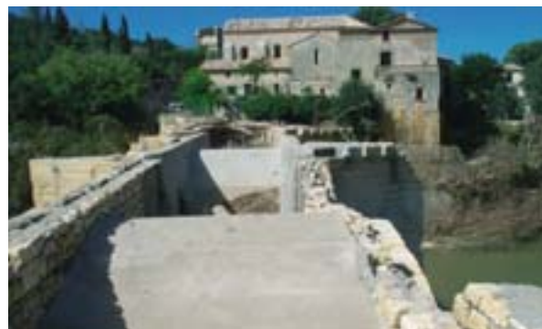
Gardoni üleujutustes hävinud Saint-Nicolas' sild (üleväl), mis taastati algsel kujul (all)