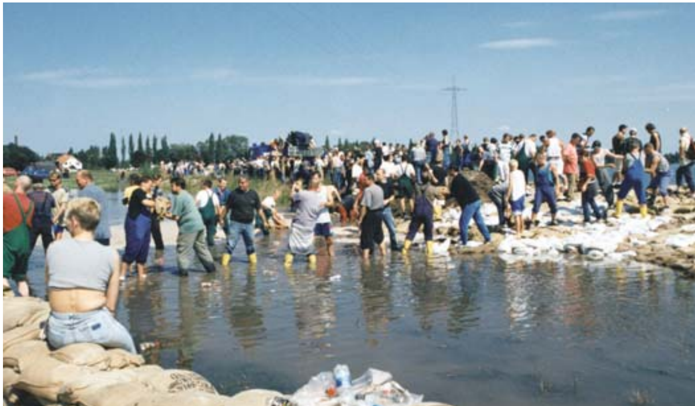
Szolidaritási lánc a 2002. évi németországi áradások idején

A Szolidaritási Alappal, amelyet a 2002. nyári drámai áradások miatt hoztak létre, az Európai Unió olyan pénzügyi eszközt kívánt maga számára elérhetővé tenni, amely utat nyit a kivételes katasztrófákat elszenvedő tagállamokkal és a tagjelölt országokkal való pénzügyi szolidaritás előtt.