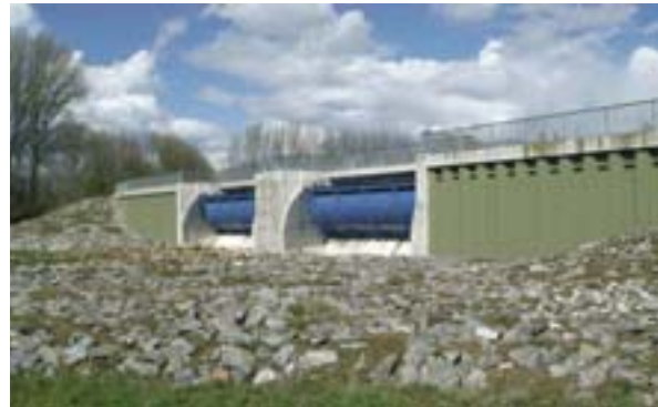
Az Interreg IIIB keretében az SDF projekt támogatja a Rajna áradásának megelőzését

7 millió érintett személy és 60 milliárd eurós veszteség: ez az Európai Környezetvédelmi Ügynökség (EEA) 31 tagállamában 1998 és 2002 között bekövetkezett természeti és technológiai katasztrófák mérlege. A jövőben a helyzet minden bizonnyal még rosszabbra fordul. A biztosítótársaságok azt jósolják, hogy pusztán a természeti katasztrófák költsége a következő évtizedben el fogja érni az évi 150 milliárd dollárt.