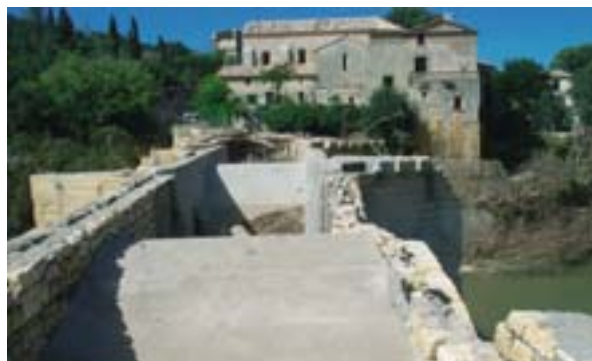
A Gardon által elpusztított Saint-Nicolas híd (lent) eredeti állapotában áll helyre (lent)