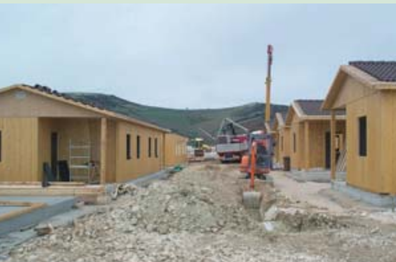
Ideiglenes szállások a katasztrófa sújtotta személyek számára

Elérhetőség: corrado.seller@protezionecivile.it