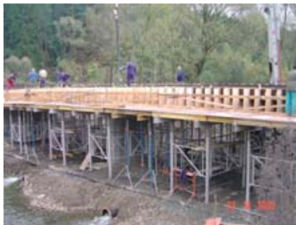
Híd helyreállítása a pilseni régióban (Cseh Köztársaság)

Minden feltételnek teljesülnie kell ahhoz, hogy a katasztrófát „rendkívülinek” lehessen minősíteni, mivel az mind jellegében, mind az okozott kár mértékében, mind az érintett régióra gyakorolt hatásában meghaladja az ésszerűen várható mértéket. 2002 decembere és 2004 szeptembere között a Bizottság csak hat kérelemről ítélte úgy, hogy teljesíti ezeket a feltételeket, és javasolta így az Alap mozgósítását. Négy másik esetben elutasító döntés született.