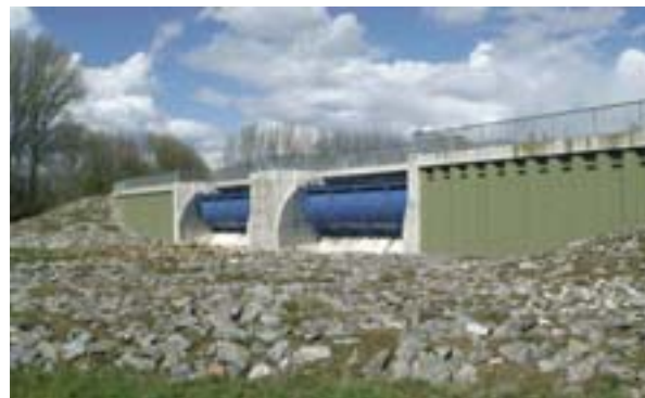
Forebyggelse af oversvømmelser ved Rhinen gennem SDF-projektet med støtte fra Interreg IIIB

7 millioner mennesker berørt og 60 mia. EUR i forsikrede tab: Det er status over naturskabte og teknologiske katastrofer i Europa mellem 1998 og 2002 i de 31 lande, der er medlemmer af Det Europæiske Miljøagentur. Denne situation forventes at forværres yderligere i de kommende år. Forsikringsselskaberne forudsiger, at omkostningerne alene forbundet med naturkatastrofer vil nå 150 mia. USD om året i det kommende årti.