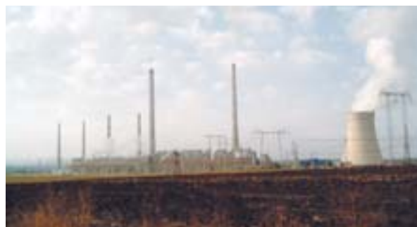
Luftkvalitet: Ispa-programmet støtter en indsats for at reducere udslippet fra Maritsa Est II-værket i Bulgarien

Hvad angår risikoforebyggelse, gør samhørighedspolitikken det muligt at udvise solidaritet på to måder. Samhørighedspolitikken bibringer ikke blot finansiell bistand til de mest ugunstigt stillede regioner i EU, men også til regioner, hvis konkurrenceevne må understøttes, så udviklingsarbejdet får en bæredygtig karakter. Da bestemte regioners handling eller mangel derpå desuden kan ødelægge andre regioners udviklingsarbejde, kan støtte til regionalt samarbejde bidrage til at styrke solidariteten regionerne imellem. Ved at koncentrere samhørighedspolitikken indsats omkring risikoforebyggelse kan den førte politik inden for andre områder såsom miljø, transport og udvikling af landdistrikter bedre komme til udtryk inden for det regionale samarbejde mellem regionerne i de 25 medlemsstater.