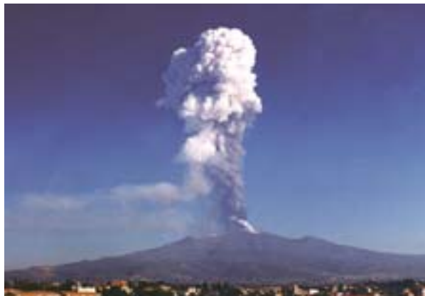
Italië: uitbarsting van de Etna in de herfst van 2002

Aan al deze voorwaarden moet men voldoen om de ramp als „buitengewoon“ te kunnen aanmerken. Deze is dan door zijn aard, vanwege de omvang van de veroorzaakte schade of door zijn effecten op de getroffen regio ernstiger dan men redelijkerwijs zou kunnen verwachten. Tussen december 2002 en september 2004 heeft de Commissie geoordeeld dat slechts zes van