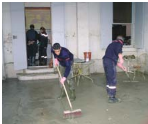
Frankrijk: schoonmaakoperatie na de overstroming van de Rhône in december 2003

Op deze manier kan het Fonds per jaar meerdere subsidies toekennen voor rampen van verschillende omvang die landen met verschillende economische ontwikkeling treffen. Bij grotere rampen wordt een ruimere steun toegekend dan bij kleine rampen. Het steunbedrag is dan gerelateerd aan de mogelijkheden