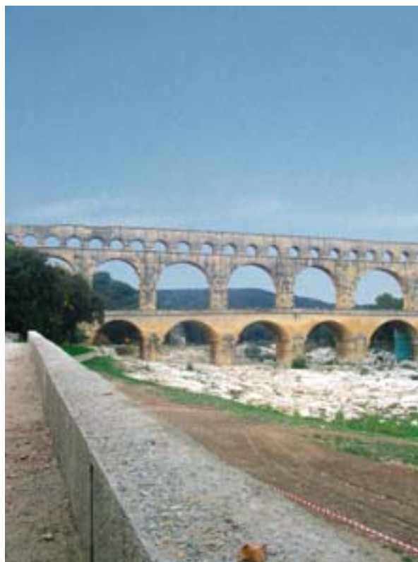
Pont du Gard (Frankrijk): op de voorgrond een beschermingsmuur die met steun van het SFEU is gebouwd