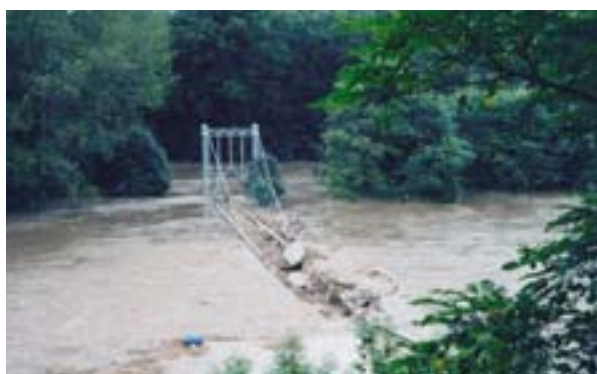
De hangbrug van Grimma vóór en na de interventie van het SFEU

Het snelle herstel van de situatie in Saksen, dat zwaar werd getroffen door de overstroming van augustus 2002, is een bijzonder goed voorbeeld van de doelstelling van het Solidariteitsfonds van de Europese Unie: bevorderen van een zo spoedig mogelijk herstel van technische en maatschappelijke infrastructuur na een ramp.