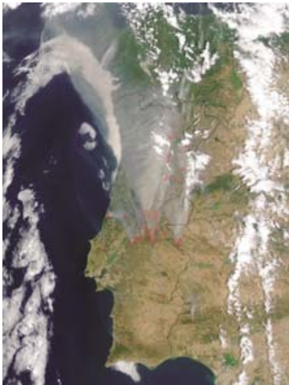
Satellietopname van de bosbranden van 2003 in Portugal en Spanje

Een belangrijk probleem dat naar voren kwam bij de oprichting van het Solidariteitsfonds was het vinden van een goede financieringsvorm. Omdat de begroting van de Gemeenschap in het kader van de financiële vooruitzichten 2000-2006 niet altijd voldoende speelruimte biedt, is besloten het SFEU buiten de normale begroting te houden en het te vullen met „nieuwe” extra middelen. Begrotingstechnisch was dat alleen mogelijk door de instelling van een nieuw „flexibiliteitsinstrument” en door een herziening van het interinstitutioneel akkoord over de begrotingsdiscipline tussen de Raad, het Parlement en de Commissie. Op deze basis kan het Fonds jaarlijks voor 1 miljard euro aan subsidies toekennen. Alleen de bedragen die per geval noodzakelijk worden geacht, worden daadwerkelijk gebruikt. Ongebruikte gelden kan men niet doorschuiven naar het volgende boekjaar.