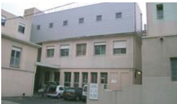
Op het dak van de Bonnefonkliniek is een modulaire unit neergezet waarin de operatiekamers zijn ondergebracht

Zo werd het departement Gard net als enige weken eerder Duitsland, de Tsjechische Republiek en Oostenrijk het slachtoffer van rampzalige overstromingen. De regio werd vervolgens ook een van de eerste begunstigten van het op 11 november 2002 ingestelde SFEU. Op de dag af één maand later, op 11 december 2002, besloot de Europese Commissie aan Frankrijk een bedrag van 21 miljoen euro uit het SFEU beschikbaar te stellen voor de financiering van de noodmaatregelen in de Gard. In totaal werden 115 projecten door het Fonds betaald. Daarbij ging het om bedragen die uiteenliepen van tweeduizend tot meer dan twee miljoen euro.