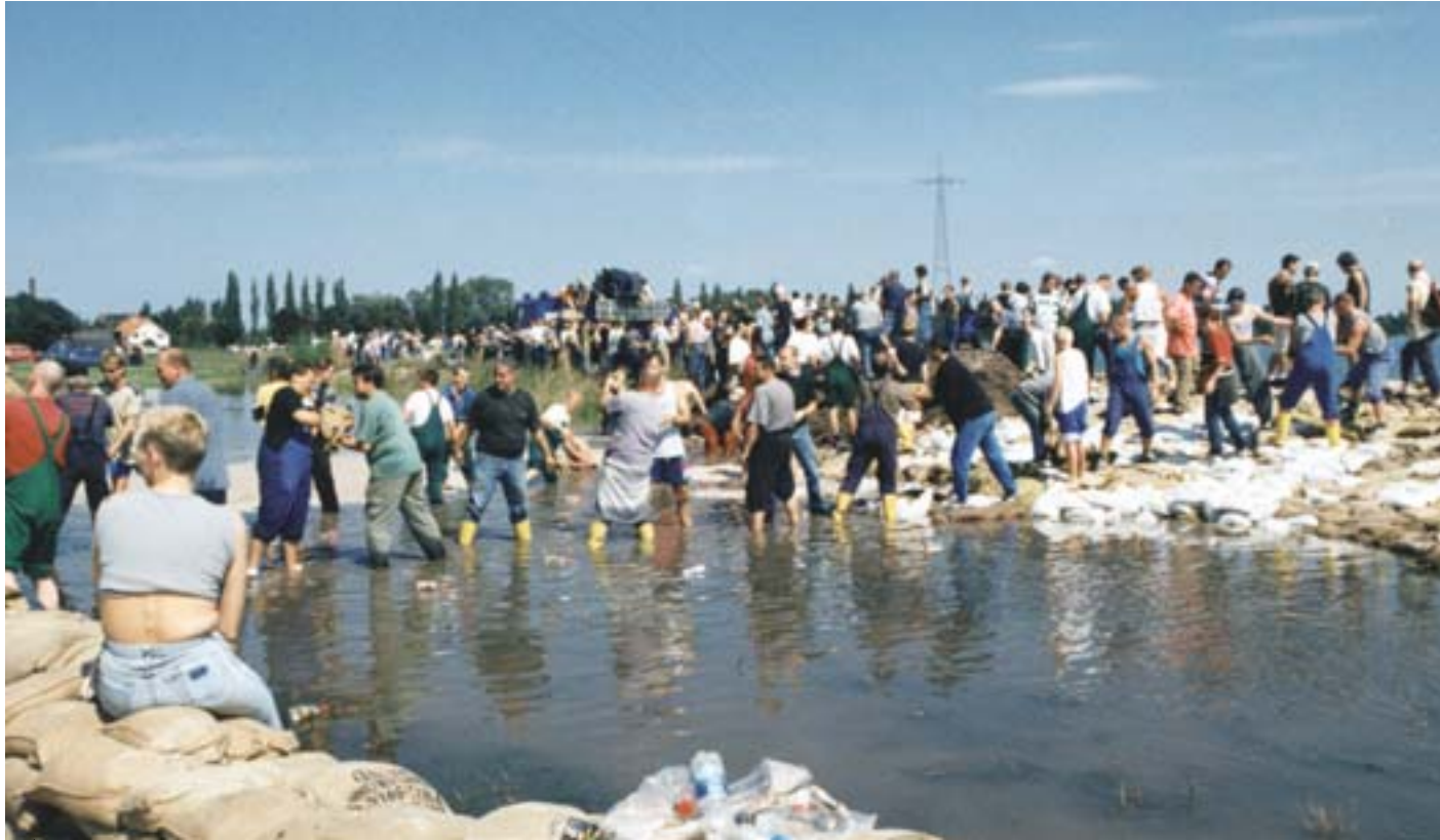
Solidaritetsinsats vid översvämningarna i Tyskland 2002.

Med solidaritetsfonden, som har sitt ursprung i de dramatiska översvämningarna sommaren 2002, ville Europeiska unionen skaffa sig ett instrument som skulle göra det möjligt att visa ekonomisk solidaritet med de medlemsstater och kandidatländer som råkade ut för exceptionella katastrofer.