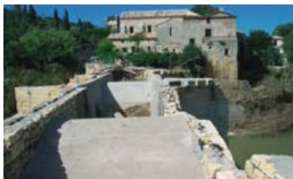
Bron Saint-Nicolas som förstördes av Gardon (ovan) och sedan byggdes upp till exakt samma bro (nedan).