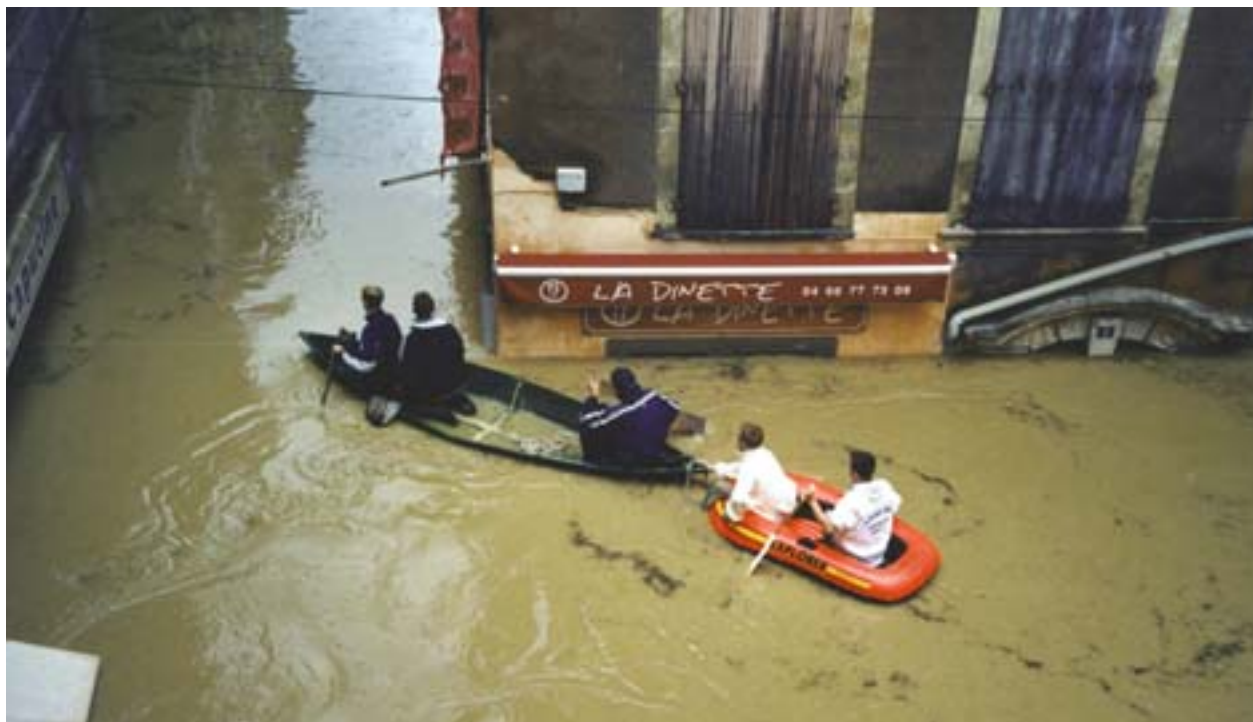
I Sommières nådde Vidourles högvatten ända upp till andra våningsplanet på fastigheterna.

Departementet Gard har två gånger drabbats av svåra översvämningar och fått bidrag från Europeiska unionens solidaritetsfond för att reparera de stora skadorna och återställa infrastrukturer samt sanitära och utbildningsrelaterade inrättningar, men också för att bättre skydda landskapet och förebygga risker. Totalt har 115 åtgärder genomförts vilka innebär ett kraftprov i fråga om administration för att kunna hålla de korta tidsfristerna. Besök hos föregångare för solidaritetsfonden.