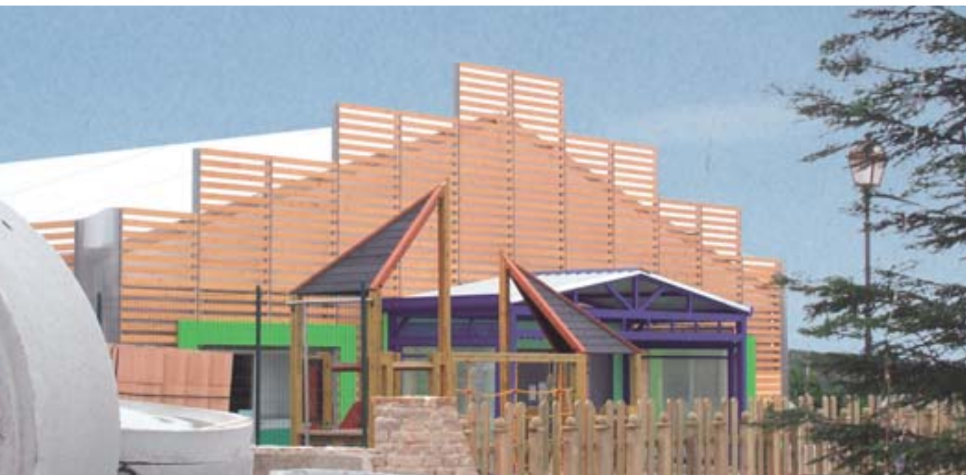
Provisorisk skolbyggnad som finansierats med bidrag från solidaritetsfonden för de olycksdrabbade i San Giuliano di Puglia (Italien).

Dessa tankar har lett till att kommissionen i sitt meddelande om budgetplanen 2007–2013 (6) har infogat ett förslag i syfte att gruppera befintliga åtgärder och instrument på europainivå, liksom ett visst antal nya eller kompletterande initiativ, inom ramen för ett instrument för solidaritet och snabb reaktion som skall möjliggöra gemensamma lösningar vid krissituationer och ge medborgarna möjlighet till en europeisk insats vid en större katastrof. Det kan också användas till att finansiera stöd till offer för terrorism, för att tillgodose behoven av civilförsvar och för att avhjälpa folkhälso-kriser och verkningar av andra naturkatastrofer. Detta är bara början.