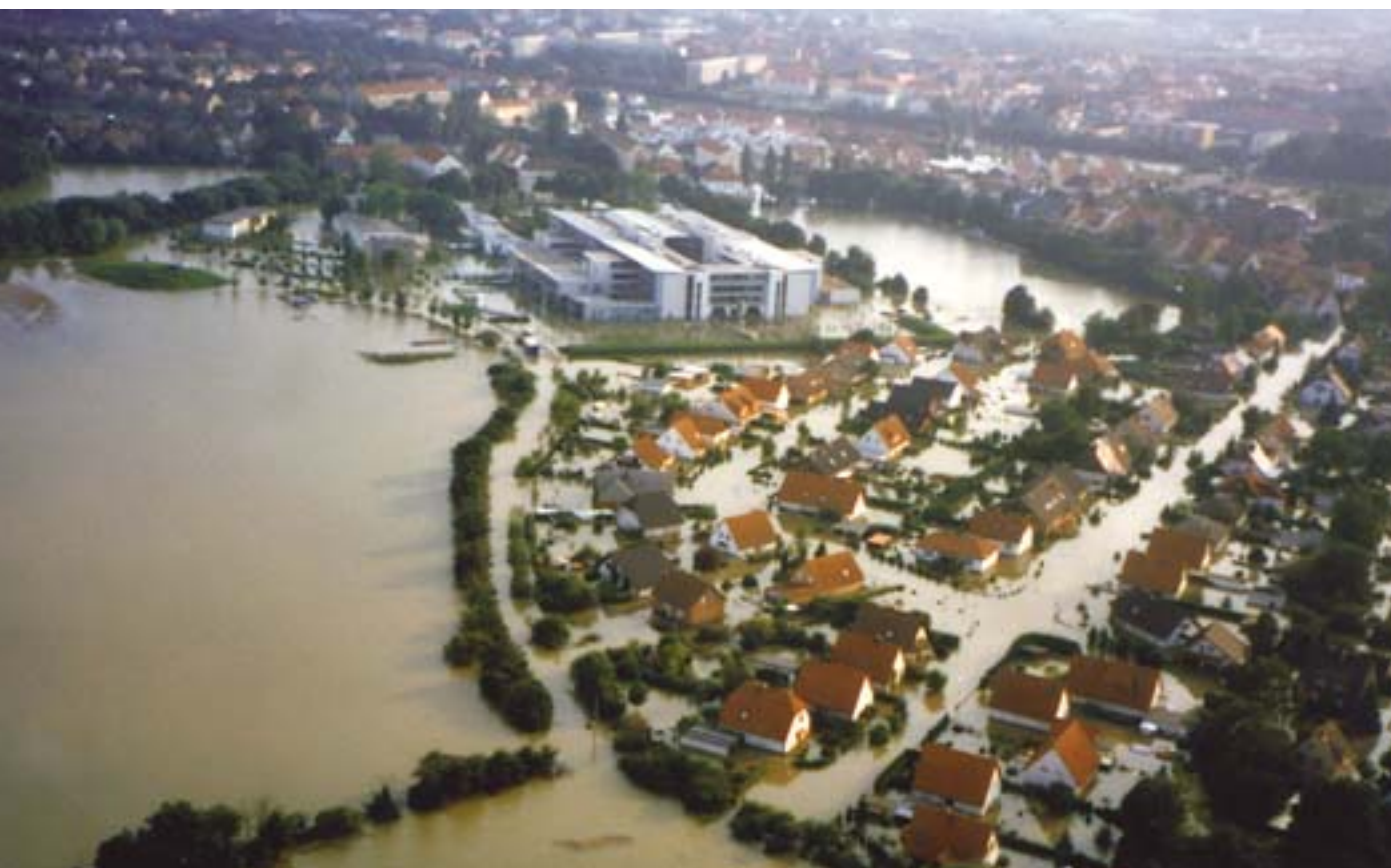
Tyskland, sommaren 2002: när Elbe steg över alla bräddar ...

Rådet påbörjade genast sin granskning av förslaget, vilket ledde till att två stora problem framträdde: viljan att snabbt anta och verkställa det nya instrumentet, men också, eftersom det endast skulle användas som en sista utväg, problemet att upprätta garantier för att undvika för frekvent användning. Därför skärptes kommissionens förslag avsevärt på ett visst antal punkter.