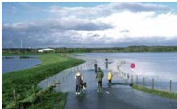
Interreg IIIB ietvaros SDF projekts atbalsta Reinas plūdu novēršanu

Visaptveroša un risku ietveroša pieeja Eiropas Savienības līmenī