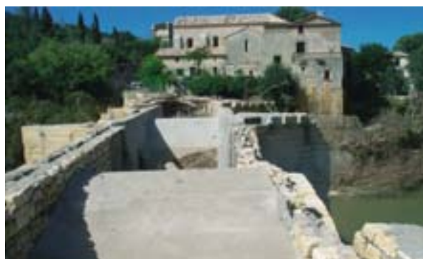
Gardonas izpostīts (augšā) un atjaunots (apakšā) Sen-Nikolā tilts