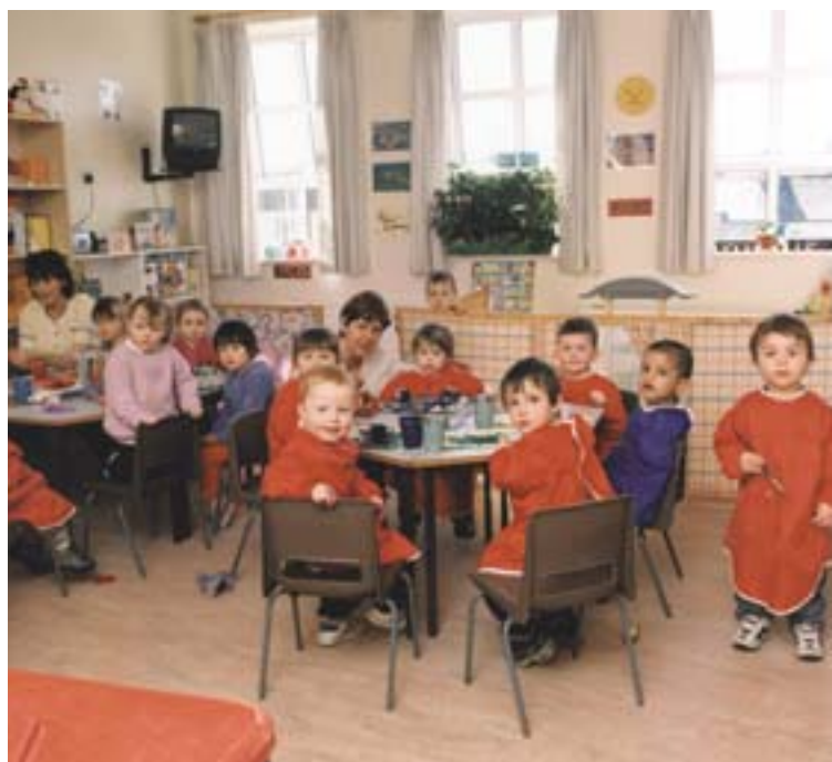
Mullingari lastesõime lapsed

de valmistamise (1985-87), sekretäri-, raamatupidamis- ja arvutikursuste (alates 1997) ning naisimmigrantidele mõeldud inglise keele kursustega (alates 2002).