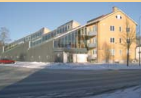
„Vormimaja“ ehitamisel on kasutatud ainult ökoloogilisi materjale