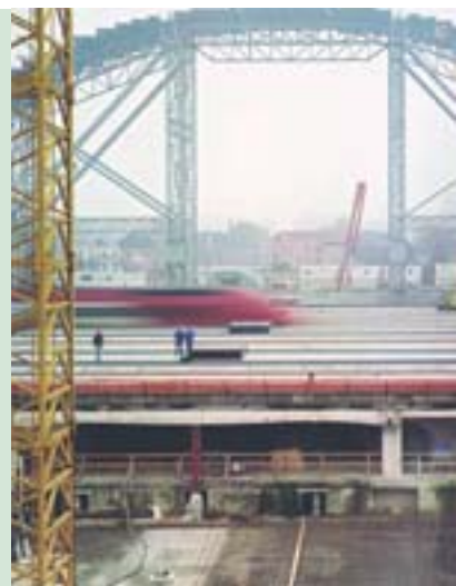
Liège'i (Belgia) uues kiirrongijaamas on EL kaasrahastanud mitmeid majanduse elavdamise meetmeid

Hiljuti avaldas Euroopa Komisjon Internetis uue ingliskeelse sotsiaalmajandusliku arengu hindamise juhendi. Juhendit võib tasuta lugeda ja kasutada. See põhineb programmi MEANS kogemusel ning keskendub hindamismetoodikale. Juhendi koostajad kavatsevad seda regulaarselt täiendada ning uurivad ka võimalusi muuta osa veebilehest interaktiivseks, et soodustada hindajate ja hindamise tellijate vahelist kogemuste- ja mõttevahetust. http://www.evaled.info