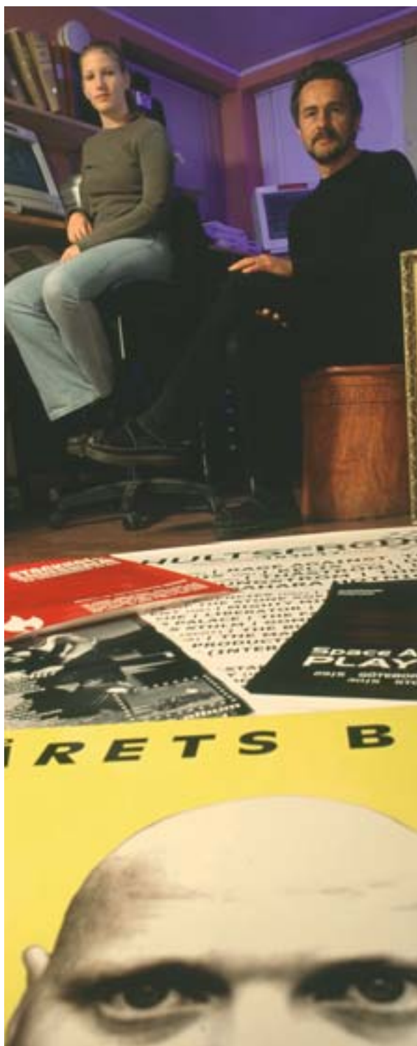
FEDERi toetusesaaja agentuur PUZZLE Hultsfredist (Rootsi) rakendab oma anded rokkmuusika teenistusse, millest on saanud linnakese tõmbenumber

Selles valdkonnas on palju õpitud. Partnerlus on midagi enam kui lihtsalt järelevalvekomiteede esindatuse tagamine. Iga partneri osalus on tähtis ning omavahel tuleb osata sobitada strateegilisi ja rakendusfunktsioone, mida partnerid võivad programmi erinevates etappides täita. Kui tahetakse, et partnerite osalemisest oleks ka kasu, tuleb neile tagada ka väljaõpe ja tehniline abi.