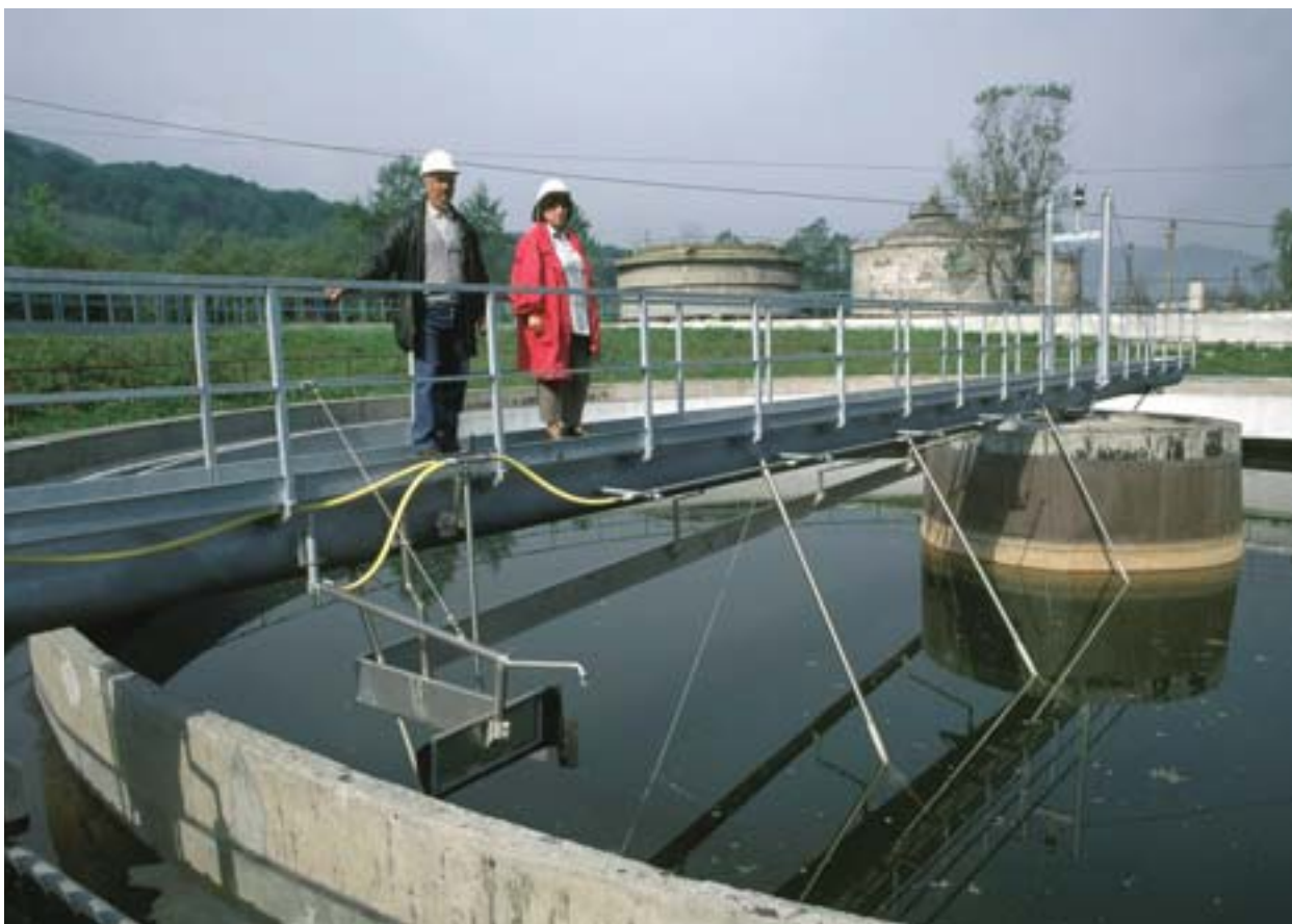
Danutoni veepuhastusjaam (Rumeenia) on saanud PHARE ja ISPA toetusi

Struktuurifondide monitooringut ehk järelvalvet on sageli peetud programmi elluviimise kõrval teisejärguliseks ja tunduvalt vähem oluliseks. Viimastel aastatel on seda hakatud siiski pidama tõhusa programmeerimise eeltingimuseks, mis aitab koguda strateegilist teavet iga programmi etapi – koostamise, elluviimise ja hindamise – kohta.