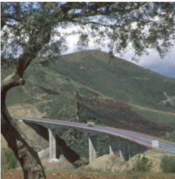
Bragançan (Norte, Portugal) ohitustie helpottaa Espanjan-liikennettä.

Erityisesti eriytyneissä hallintojärjestelmissä yleinen rakennerahastojen hallinnointitapa on ohjelmien hallinnon osittainen ulkoistaminen erilliselle sihteeristölle. Näin on tehty jo kauan eräissä Belgian osissa, Alankomaissa ja Yhdistyneessä kuningaskunnassa. Tähän ryhmään liittyi hiljattain myös Nordrhein-Westfalen, joka perusti "Ziel 2 Sekretariat" (tavoite 2 -sihteeristön) ja ulkoisti sen konsulttitoimistolle. Toimiston tehtävänä on parantaa ohjelmakomiteoiden koordinoitua, antaa teknistä apua useille ministeriöille ja muille ohjelmien hallintoon osallistuville tahoille sekä vastata julkistamis- ja tiedotustoimista.