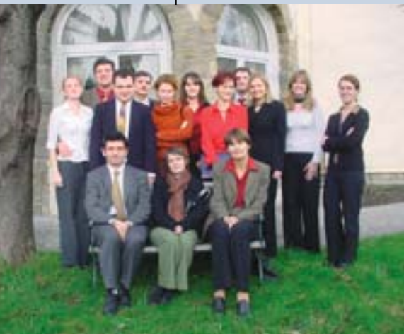
Valticeen kokouksen osanottajat