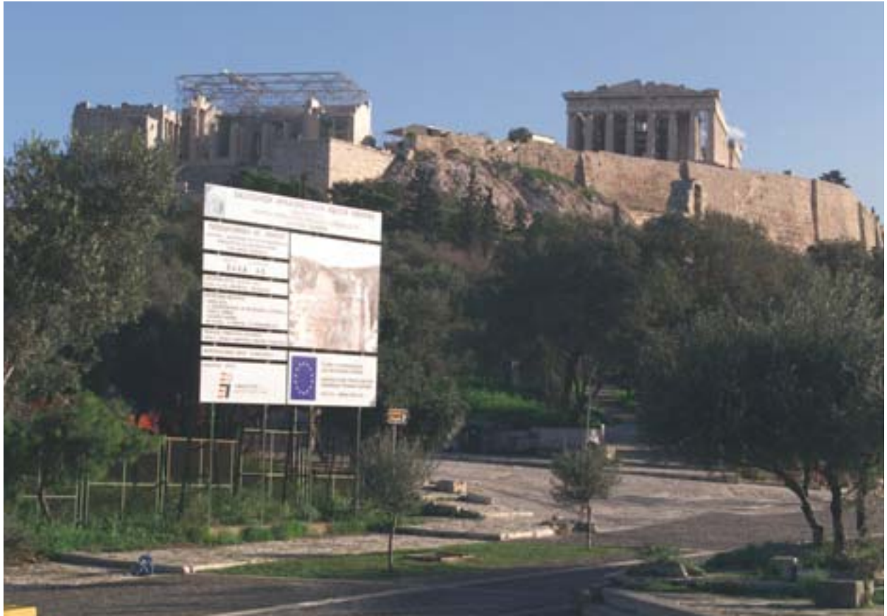
Ateenan arkeologisten nähtävyyksien kulkureittejä kunnostetaan vuoden 2004 kesäolympialaisia varten Kreikassa.

tällä alalla kuitenkin vaihtelevat ohjelman eri vaiheissa. Niitä ovat esimerkiksi seuraavat: