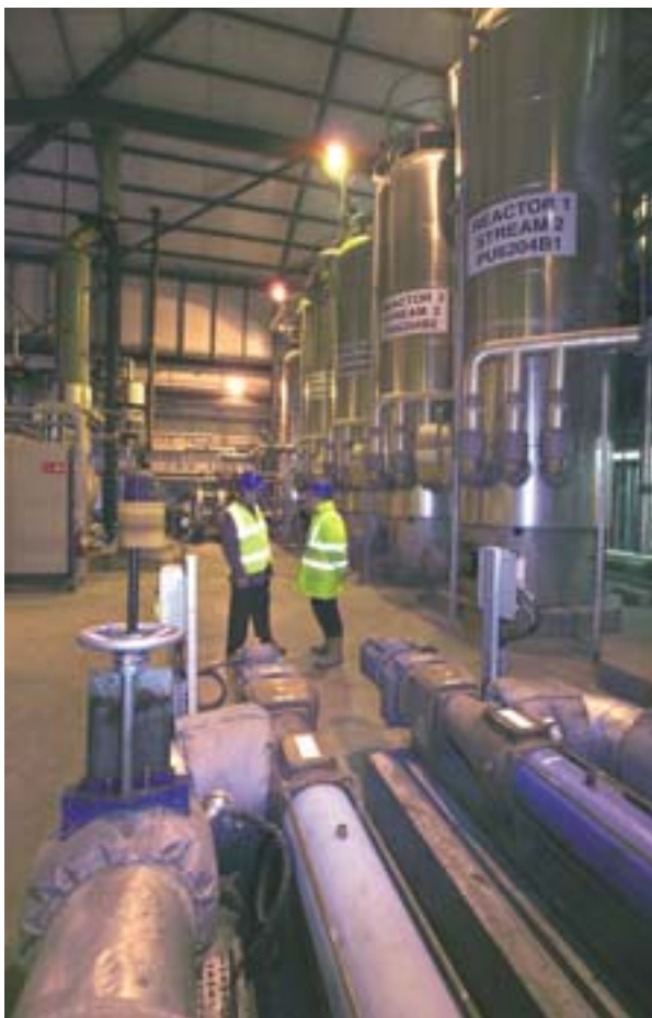
Sisä näkymä Ringsendin puhdistamosta