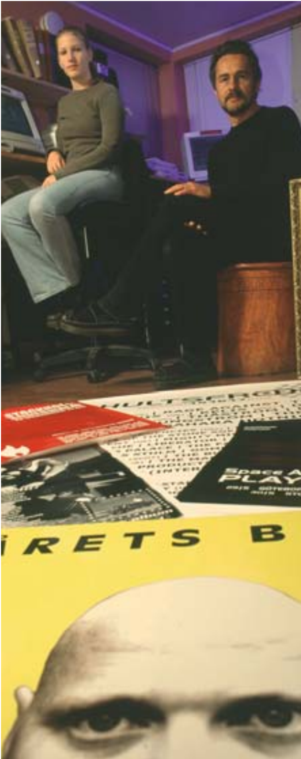
Hultsfredissä Ruotsissa toimiva EAKR:n tukea saava ohjelmatoimisto Puzzle panostaa rockmusiikkiin, josta on tullut kaupungin tunnusmerkki.

nointia ja hankkeiden valintaa, sillä se saa toimijat omistautumaan työlle sekä sitoutumaan ohjelmaan ja lisää innovaatiomahdollisuuksia.