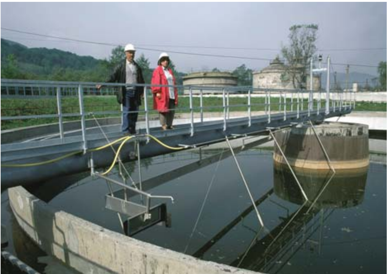
Danutonin puhdistamon (Romania) rakentamiseen saatiin Phare- ja Ispa-tukea.

Rakennerahasto-ohjelmien seuranta on usein pidetty toisarvoisena paljon tärkeämmäksi katsotun ohjelmien toteutuksen rinnalla. Seuranta on kuitenkin alettu viime vuosina pitää tehokkaan ohjelmasuunnittelun ennakoedellytyksenä ja keinona kerätä strategisia tietoja, joita tarvitaan kaikissa ohjelmasuunnittelun vaiheissa: kehityksessä, toteutuksessa ja arvioinnissa.