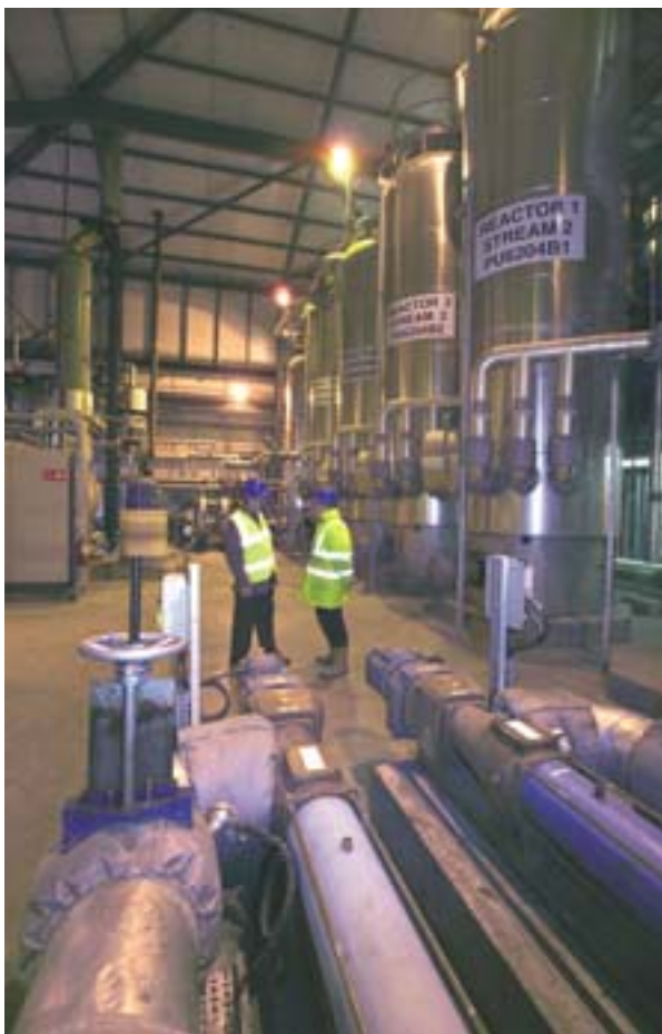
Ringsendo valymo įrenginio viduje