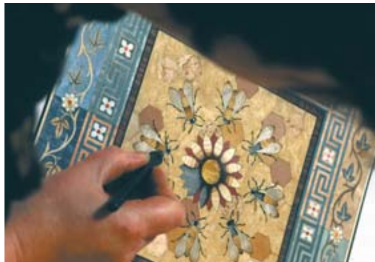
Inkrustacijos menas – veikla, kuri remiama pagal Vėlo regioninį technologinį planą (Jungtinė Karalystė) ir kurią kofinansuoja Europos regioninės plėtros fondas