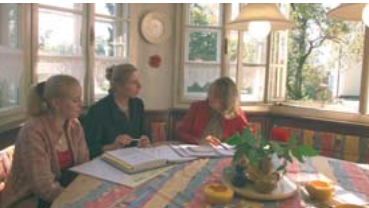
Zalcburgas (Austrija): asociacija „Frau und Arbeit“ (Moteris ir darbas) remia moteris, norinčias atidaryti savo įmonę