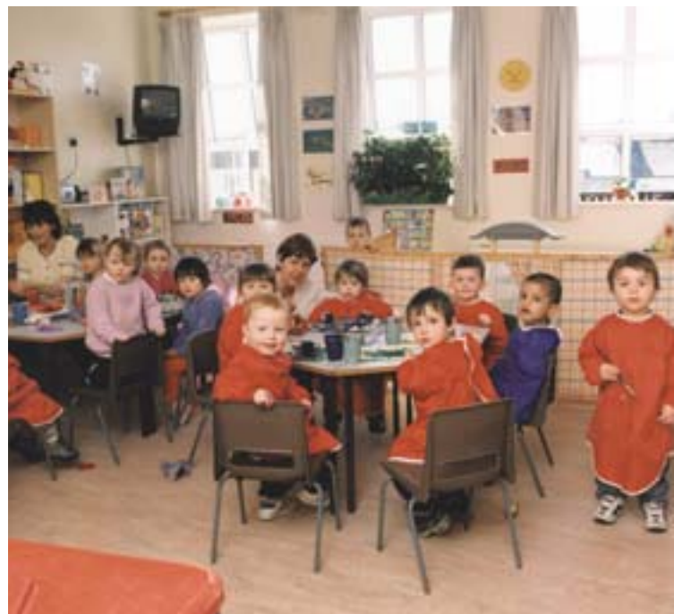
■ Keli mažieji lopšelio „Mullingar“ mokiniai