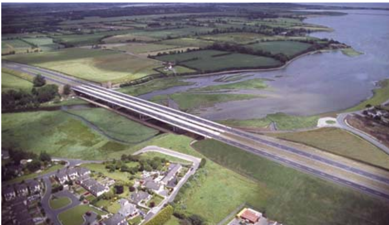
■ Diaľnica M1 prekonáva ústie rieky v Broadmeadows

V období vstupu v roku 1973 bolo Írsko jednou z najchudobnejších krajín Európskej únie. Po tridsiatich rokoch patrí medzi najviac prosperujúce štáty EÚ, aj preto, že dokázalo využiť európske programy pomoci. Čo však bolo hnacím motorom rozvoja írskej ekonomiky? Aké „tipy“ môže Írsko poskytnúť novým členským štátom?