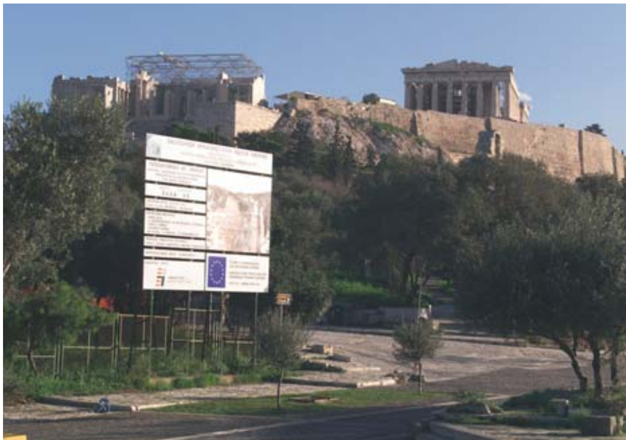
Úprava prístupov k archeologickým náleziskám v Aténach (Grécko) pri príležitosti Olympijských hier v roku 2004