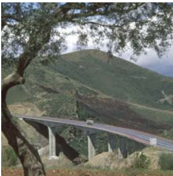
Vedľajšia komunikácia v Bragança (Norte, Portugalsko) uľahčuje prechod do Španielska

Jedným zo spôsobov riadenia štrukturálnych fondov, ktorý sa často používa v systéme diferencovaného riadenia, je vyčlenenie častí programov do správy samostatného sekretariátu. Tento systém sa už dlhšie používa v niektorých oblastiach v Belgicku, Holandsku a v Spojenom kráľovstve. Najnovším príkladom je Severné Porýnie-Vestfálsko, kde vznikol „Ziel 2 Sekretariat“ (Sekretariát Cieľa 2), ktorý spravuje konzultačná spoločnosť. Jej úlohou je zlepšiť koordináciu výborov programu, poskytovať technickú podporu jednotlivým ministerstvám a ďalším orgánom, ktoré sa podieľajú na správe programu. Konzultačná spoločnosť zabezpečuje aj aktivity v oblasti propagácie a komunikácie.