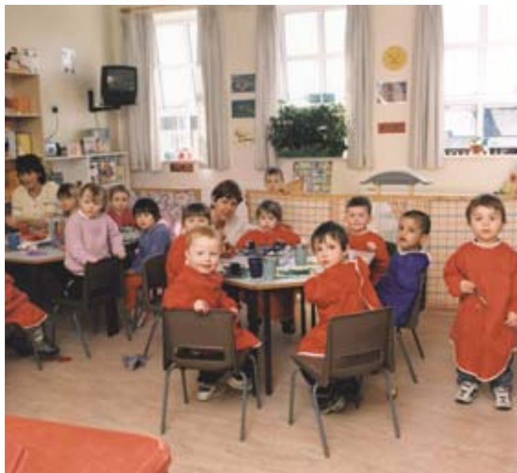
Niekoľko malých chovancov v jasliach v Mullingare