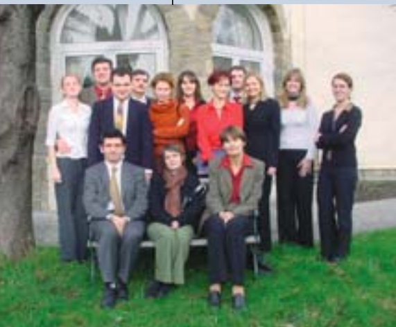
Účastníci stretnutia vo Valticiach