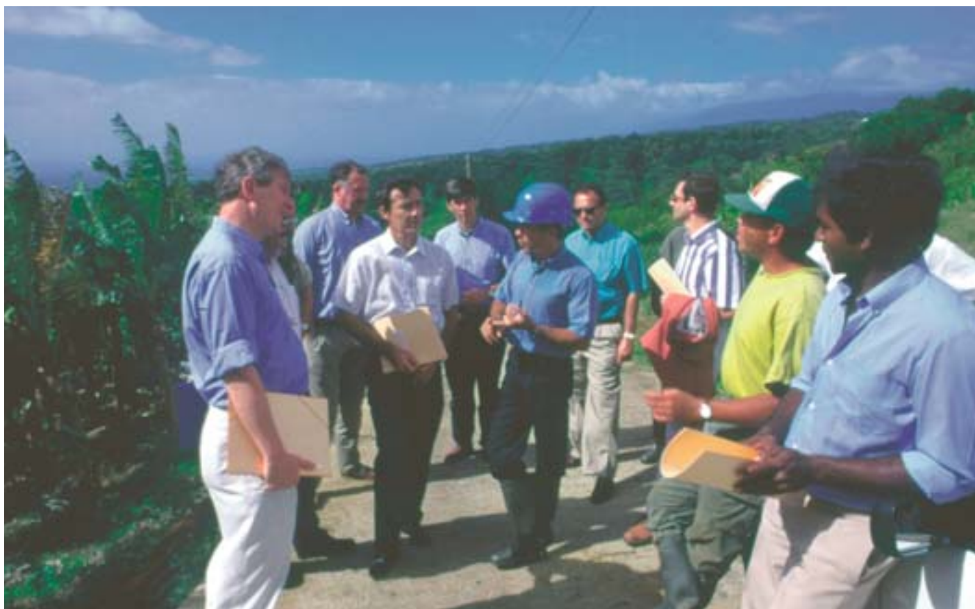
Návšteva zavlažovacích zariadení financovaných fondom EFRR na západnom brehu ostrova Réunion (Francúzsko)