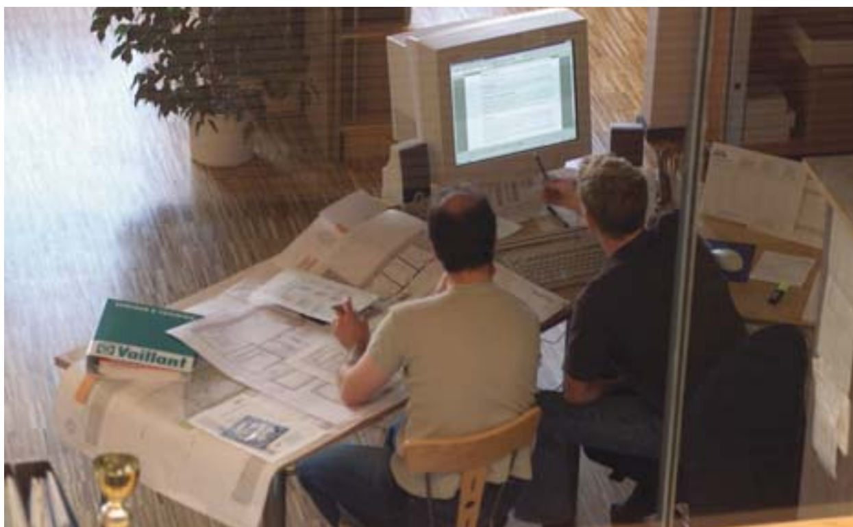
Zoskupenie podnikov v Egg v časti Vorarlberg (Rakúsko)

Implementácia štrukturálnych fondov sa často považuje za pridanú hodnotu Spoločenstva. Jedným z jej aspektov je aj odovzdávanie najlepších skúseností v správe štrukturálnych fondov v priebehu programových období a výmena skúseností medzi členskými štátmi a regiónmi. Poučenia získané počas jednotlivých fáz implementácie programu tak môžu poslúžiť ostatným.