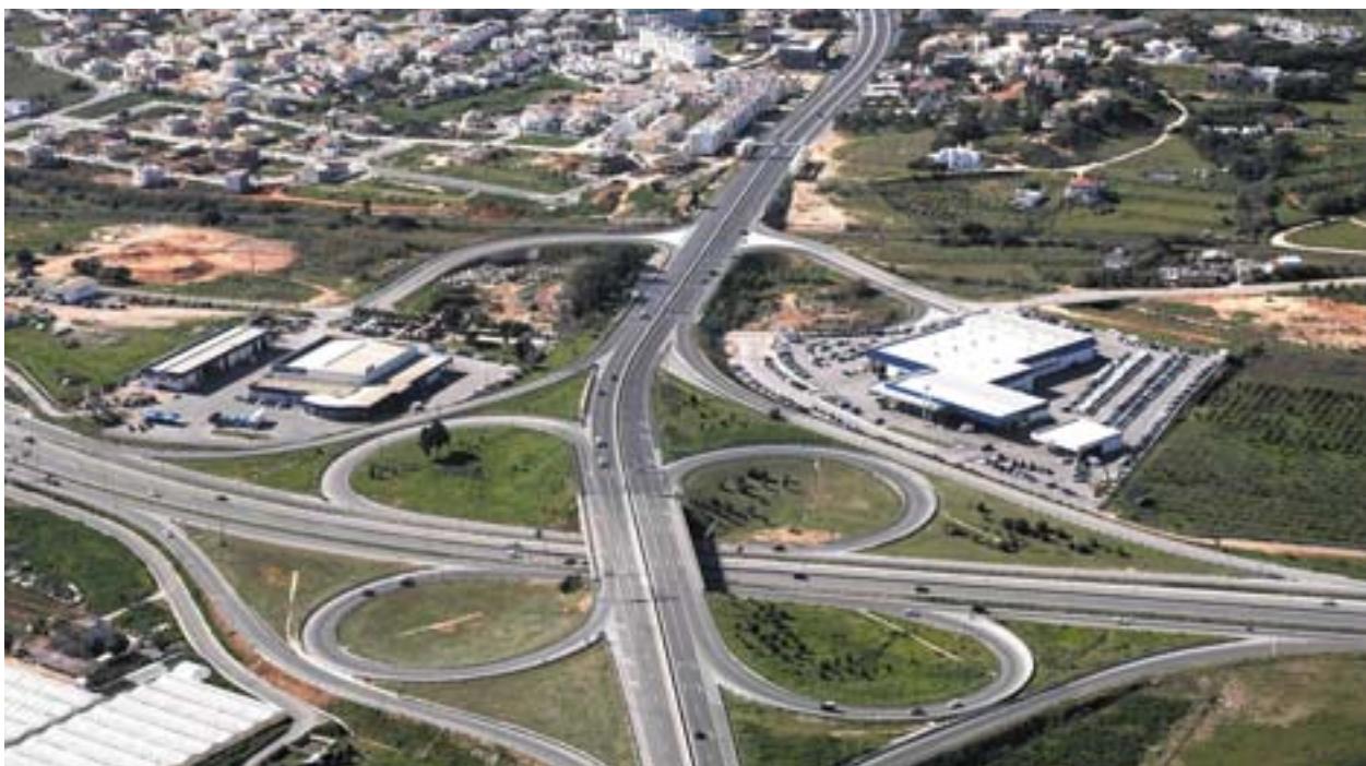
Kiirteede ristumiskoht: Algarvel on nüüd kiire ühendus Lissaboni ja Hispaaniaga.

Vaatamata sellele, et Portugali sisemaa ja ranniku vahel valitseb endiselt sügav lõhe, on Algarve, veel viiskümmend aastat tagasi riigi kõige vaesem piirkond, tänaseks tõusnud jõukuse tasemelt elaniku kohta kolmandale kohale. Pärast 2006. aastat ei kuulu Algarve tõenäoliselt enam ka eesmärgi 1 piirkondade hulka. Arenguhüppele on omalt poolt kaasa aidanud ka Euroopa Liit, rahastades nii maantee-, raudtee-, õhu- kui ka meretranspordi infrastruktuuride ehitust. Ent vaatamata tugevatele ja selgetele pingutustele võib tajuda ka teatavat muret: suurtest keskustest kaugel asuv ja suuresti turismist sõltuv Algarve peab majanduskasvu ja konkurentsivõime säilitamiseks oskama teha õigeid valikuid.