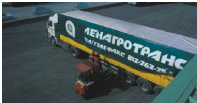
Intermodaalne platvorm (raudtee-maantee) Pratos (Itaalia).

Esiteks tuleb teha vahet riikidel, mille elatustase on Euroopa keskmisest ikka veel oluliselt madalam, ning enim arenenud piirkondadel. Keskkonnakaitse nimel ei tohiks takistada Poolal või Kreekal välja ehitada toimivat teedevõrku. Me teame, et inimeste liikuvus on majanduskasvu seisukohalt tähtis faktor. Seda ei maksa unustada. Ehkki liigset investeerimist ja vähese liiklusega infrastruktuuride toetamist tuleb vältida, ei tohi investeeringuid uutest ega ka vanades liikmesriikides siiski lõpetada. Avaliku ja erasektori partnerluse arendamine on hea võimalus eraldada terad sõkaldest. Tänu sellele saab riskid paremini välja selgi-