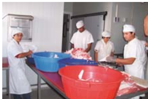
Väike lihatööstus Monchiques: teedevõrgu paranemine annab paremaid võimalusi kohalikele toodetele.

Lennujaam on ehitatud 1965. aastal ning seda on Euroopa toetuste abiga mitmel korral ümber ehitatud ja laiendatud. Praegu on see Portugalis reisijate arvult teisel kohal (4,7 miljonit reisijat 2004. aastal). Direktor ütleb: „See on lennujaam nn sissetulijatele: hea saabumispäik nii välituristidele kui ka inimestele, kellel on Portugalis teine elukoht.“ Viimastel aastatel on Algarves tõeline kinnisvarabuum ja nii on siin elamispinna ostonud juba rohkemgi kui turiste. Ka lennujaama klientuur, nii reisijad kui ka firmad on põhjalikult teisenenud: alates 1999. aastast on