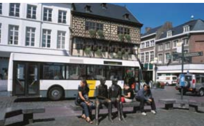
Hasseltis (Belgia) on ühistransport alates 1997. aastast tasuta.

Majanduslikule ja sotsiaalsele ühtekuuluvusele keskenduv regionaalpoliitika peaks seega võtma arvesse uute rahastatavate infrastruktuuride keskkonnasäästlikkust, eriti juhul, kui ühelt transpordiliigilt minnakse üle teisele; toetama tegevusi, mille eesmärgiks on parandada olemasolevaid transpordinfrastruktuure, nagu „intelligentsed transpordisüsteemid“ (1) , koostalitlusvõime ja ühendveod; rõhutama jätkusuutlikku linnatransporti; arendama infrastruktuure peamiselt seal, kus on juba olemas kavad, meetmed või tingimused majanduskasvu ergutamiseks.