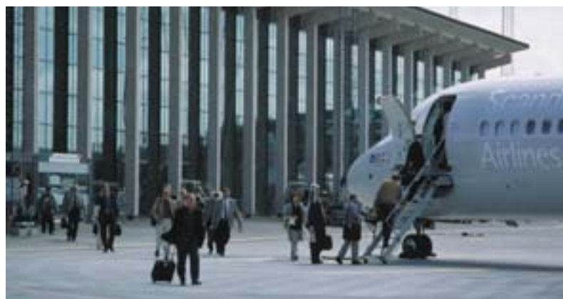
Ålborg (Taani): regionaalsed lennujaamad stimuleerivad majandusarengut.

uue liikmesriigi ja kandidaatriikide kohta. Transpordivõrkude parandamine ja ühendamine on ühenduse solidaarsuse konkreetne väljendus. Sellest annab tunnistust suurte Euroopa „koridoride“ tekkimine või ka hiljuti avaldatud Van Mierti aruanne (4) , mis soovib Euroopa Liidul kaasrahastada rohkem kui 20 põhiliselt piiriülese ning ühtlasi rahvusvahelise ulatusega infrastruktuuriprojekti.