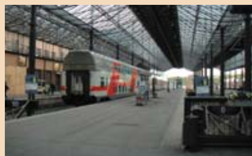
Helsingi raudteejaam (Soome).

Sõitsin ise Varssavist Helsingisse, osa teest ka aja- kirjanike saatel, et näha oma silmaga, mis seisus on infrastruktuurid praegu ning millistes lõikudes on probleeme. Kavatsen tegutseda väga aktiivselt selle nimel, et see suur piirkondlik Euroopa transpordi- telg saaks võimalikult kiiresti valmis.