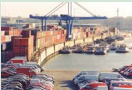
Viini sadam (Austria).

Põhjalikum teave aadressil: www.argedonau.at