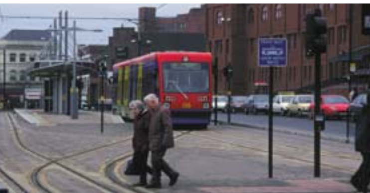
Wolverhamptoni (Ühendkuningriik) trammiliin on osa linnakeskkonna uuendamise projektist.

Kümne uue liikmesriigi ühinemine ei mänginud sellises arengus küll määravat rolli, kuid rõhutas siiski senist tendentsi. Ehkki varemalt on nendes riikides eelistatud raud- teed maanteele, muutus tendents vastupidiseks, kui toimus üleminek turumajandusele. Kaubatransport liikus raud- teelt kiiresti üle maanteele. Eratranspordiettevõtete areng, mis eeldab paindlikumaid liikumisvõimalusi, et oleks või- malik rahuldada majandusliku olukorra muutumisest tule- nevaid uudseid vajadusi, suurendas maanteetranspordi osakaalu oluliselt.