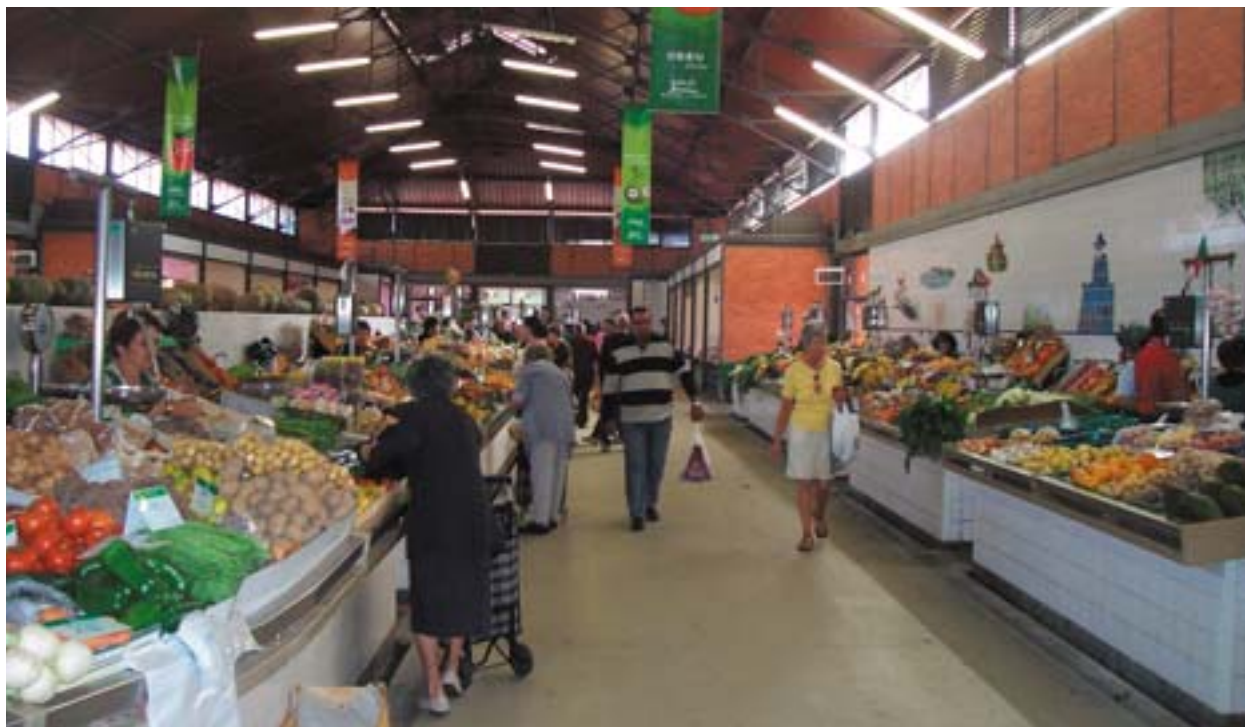
Olhão kinnine turg: ühes kalasadamate renoveerimisega restaureeritakse ka vanu hooneid ja ehitatakse uusi.

aprilli sild Lissabonis), ülesõidukohtade kaotamisele, raudteeliini elektrifitseerimisele ning signaal- ja sidesüsteemide ajakohastamisele kuulub nüüd Farost Lissaboni jõudmiseks varasema nelja ja poole tunni asemel ainult kolm tundi. Portugali raudteevõrgu REFER piirkondlik signaalsüsteemide juht loetleb eelseid, mida põhjalik ajakohastamine kaasa toõi: „Peale ajavõidu on raudtee nüüd turvalisem ning rongisõit usaldusväärsem ja ka kellaajaliselt täpsem. Sõiduplaanidest kalduvad rongid nüüd kõrvale maksimaalselt 3 minutit, enne aga võisid need hilineda 15–20 minutit. Ka on rongisõit tunduvalt mugavam, sest kasutusele võeti uued, vaiksemad vagunid. Rääkimata keskkonnasõbralikkusest, mille aitab tagada elektrifitseerimine.“ Tulemus: sõitjate arv on kasvanud umbes 30%, „kuid samuti on paranenud raudtee maine, seda peetakse senisest dünaamilisemaks,“ lisab Jorge. „Rongides näeb üha rohkem inimesi, kes teevad sülearvutiga tööd.“