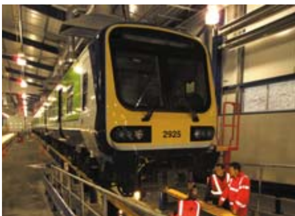
Uus raudteedepoo Droghedas (Iirimaa).