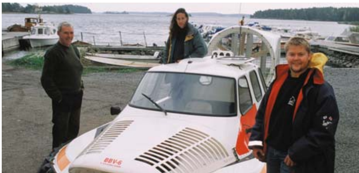
Hõljukitransport Kalmaris (Rootsi).

Niisiis võib öelda, et transpordiinfrastruktuuride mõju majanduskasvule ja sotsiaalsele ühtekuuluvusele tuleb tänapäeval vaadata uutmoodi. Ehkki alusmehhanismid on endiselt samad (tootmiskulude vähendamine, atraktiivsete piirkondade laiendamine ja polariseerumine), tuleb nende heterogeensust ja tagajärgi selgemalt väljendada.