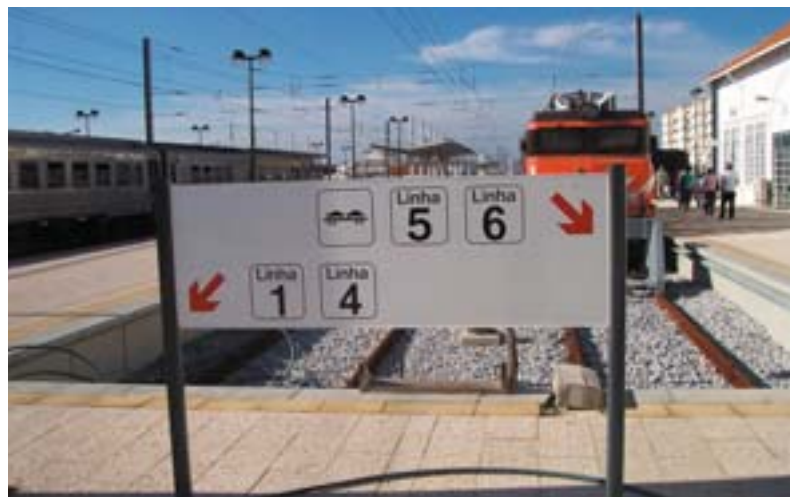
Faro raudteejaam, moderniseeritud liini lõpp-peatus.

Raudteedki ei ole unustatud: Ühtekuuluvusfondi kaasrahastas (rohkem kui 320 miljoni euro ulatuses kogusumma, milleks oli 400 miljonit eurot) projekti „Algarve ühenduse ajakohastamine“, mis omakorda oli osa üleeuroopaliste transpordivõrkude (TEN-T) prioriteetsest projektist nr 8 „Portugali – Hispaania – Kesk-Euroopa multimodaalne ühendus“. Töö lõpetati 2004. aastal pärast seda, kui järgemööda oli neljas etapis renoveeritud neli raudteelõiku kogupikkusega 339 km. Lisaks raudteele renoveeriti ka raudteejaamu. Tänu uute rööbastega paigaldamisele, marsruudi mõningasele muutmisele, uute infrastruktuurirajatiste ehitamisele või vanade renoveerimisele (näiteks kuulus 25.