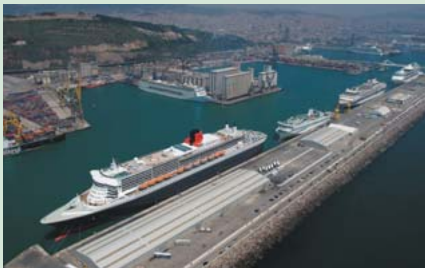
Uued kaid suudavad vastu võtta väga suuri aluseid.

Barcelona sadama laiendamisel pööratakse suurt tähelepanu keskkonnasõbralikkusele. Rakendatakse meetmeid, mis vähendavad laiendamistööde võimalikku negatiivset keskkonnamõju. Sadama arendamine vastab sadamaid ja keskkonnaküsimusi reguleerivatele õigusaktidele, kuid peale selle parandatakse ka kogu Llobregati deltat. Näiteks säilitati vanas jõesängis 10 hektari suurune märgala, et kaitsta seal elavat loomastikku. Samuti näitab sadamavõimude tahet luua jätkusuutlik ja keskkonnasõbralik infrastruktuur see, et kohale tuuakse miljoneid tonne liiva, mida kasutatakse 2 km liivaranna rajamiseks uude jõesuudmesse.