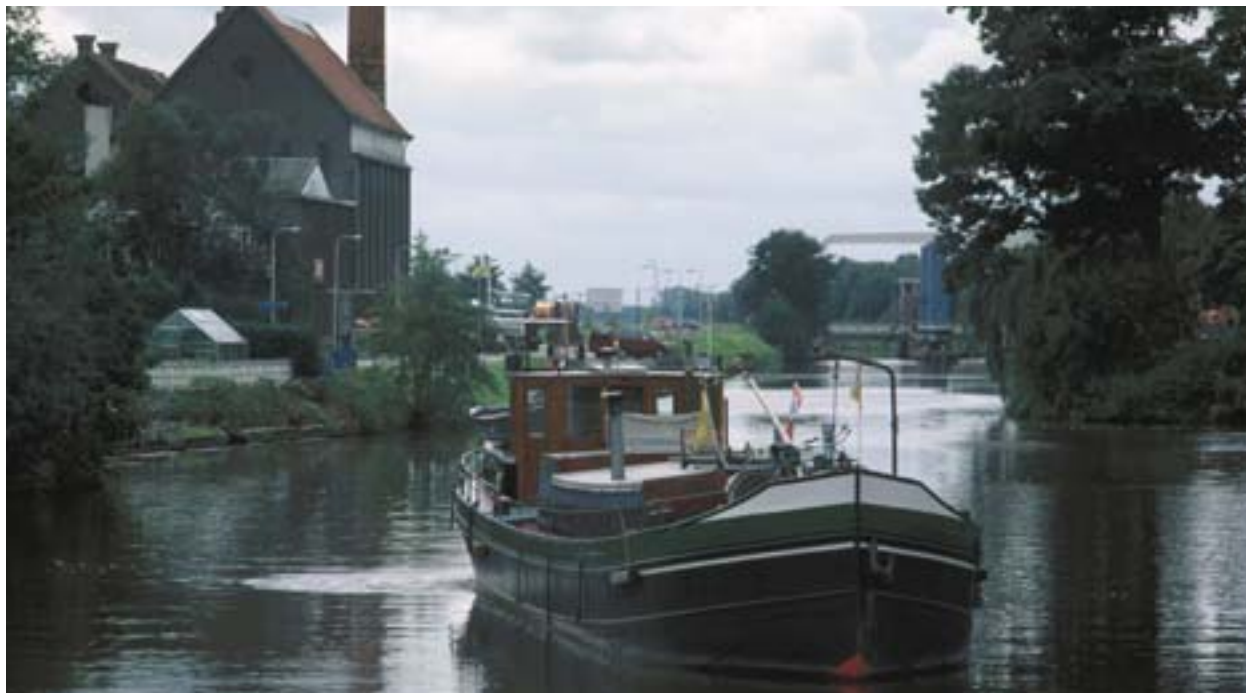
Moderniseeritud kanal Coevordeni lähistel (Madalmaad).

Keskkonnahoidlike transpordiliikide toetamine on üks ühenduse jätkusuutliku arengu neljast sambast. Kaugemas perspektiivis on Euroopa poliitika peamiseks eesmärgiks ühendada transpordi areng majanduskasvuga.