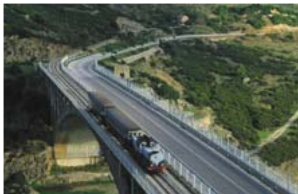
Sardiinia (Itaalia): „roheline rong“ võimaldab vana raudtee uuesti kasutusele võtta.

Samas tuleb öelda, et keskkonda säästva transpordisüsteemi loomine on pikaajaline protsess. Euroopa Komisjon pakub oma transporti käsitlevas valges raamatus (2) tähtjaks 30 aastat. Esimesed meetmed eesmärkide saavutamiseks tuleks siiski võtta kohe praegu. Seetõttu rõhutas komisjon, et poliitilisel tasandil tuleb transpordi arengu negatiivse mõju piiramiseks üles näidata suuremat initsiatiivi. Komisjon pakub välja kolm peamist tegevussuunda: a) ergutada üleminekut maanteetranspordilt teistele transpordiliikidele, mille mõju keskkonnale ei ole nii negatiivne; b) luua infrastruktuure, mis vähendaksid transpordisektoris nõudlust ning aitaksid saavutada olukorra, kus kasutaja makstav hind hõlmab ka kõiki sotsiaalseid kulusid; c) soodustada tegevust, mille eesmärgiks on parandada linna-keskkonda ja maaplaneerimist.