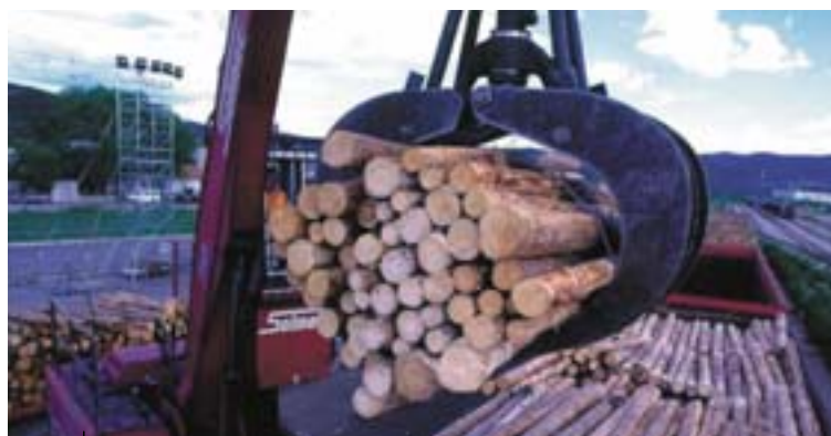
Puidu lossimine Monfalcone sadamas (Itaalia).

Neljandaks peaks transpordiinfrastruktuuridesse suunatud investeeringutega kaasnema liikluse adekvaatne juhtimine, pöörates tähelepanu ohutusele, mis peab vastama riiklikele ja ühenduse standarditele. Riiklikes ja piirkondlikes strateegiatel tuleks võtta arvesse, et transpordiliigid peaksid jaotuma tasakaalustatumalt ja keskkonnasäästlikumalt, mis aitaks rahuldada nii majanduslikke kui ka keskkondlikke vajadusi. Nimetatud strateegiatesse tuleks kaasata ka intelligentid ja multimodaalsed transpordisüsteemid, eelkõige võttes nende abil kasutusele ERTMSi ja SESAME (Euroopa ühtne lennujuhtimissüsteem) tehnoloogiad.