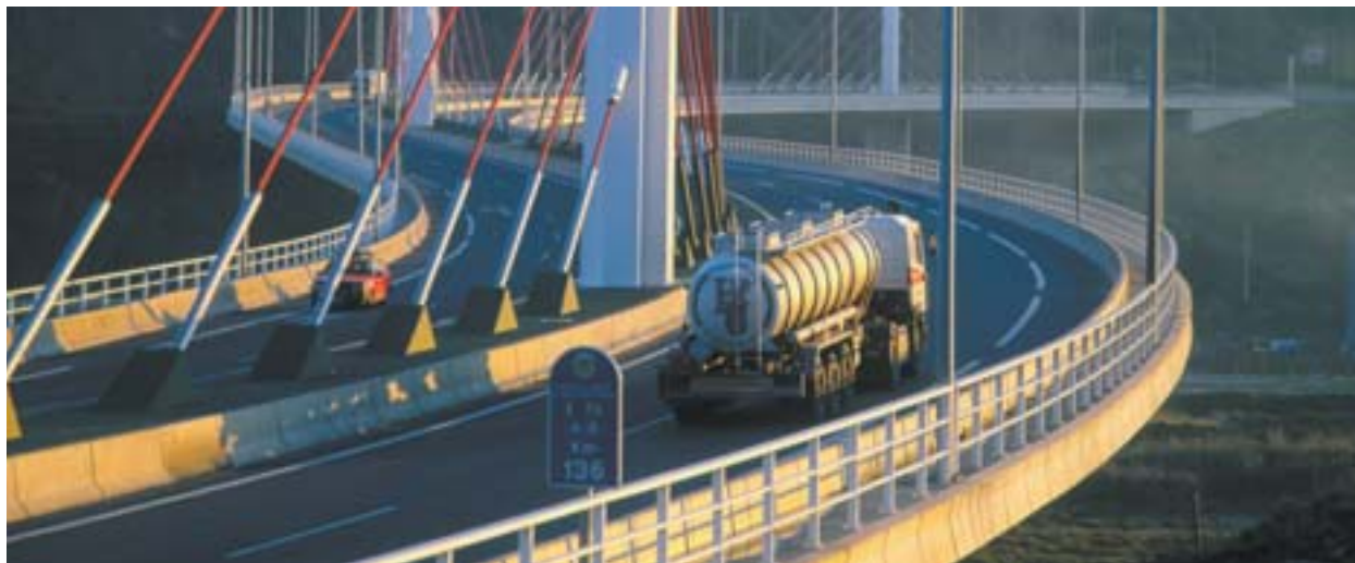
Sild Bilbao–Santanderi kiirteel (Hispaania).

Piirkondliku majanduskasvu seisukohast üliolulised transpordiinfrastruktuurid aitavad sotsiaalse ühtekuuluvuse saavutamisele kaasa üksnes teatud tingimustel.