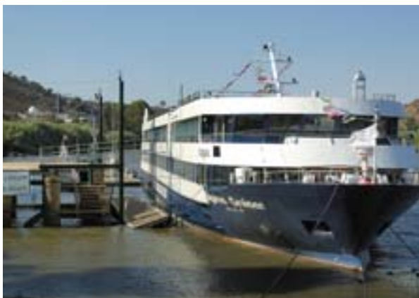
Kruisilaev peatub Alcoutimis.