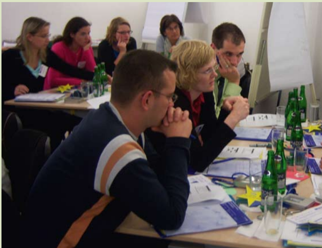
Skupinová diskuse na semináři INTERACT.