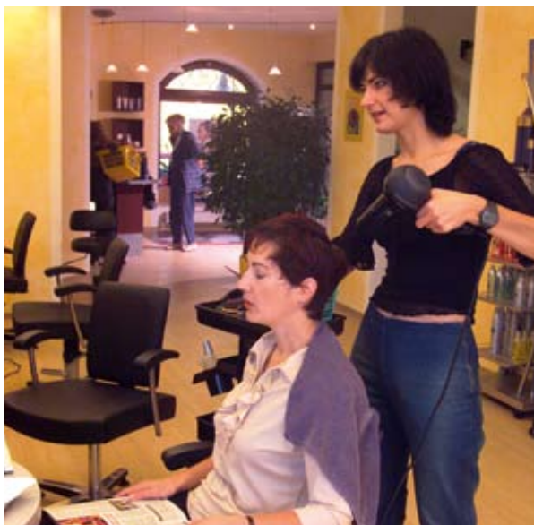
Středisko „Verein Frau und Arbeit” (Společnost Žena a práce) v Salzburku v Rakousku podporuje ženy, které otvírají svůj vlastní podnik.

Údobí 2000-2006 ukázalo potřebu takovéhoho přístupu. Přestože podporu získalo 13 000 projektů, byla tím uspokojena pouze část požadavků. Pro 2007-2013 jsou očekávány větší, číselně, strategicky a ve smyslu dopadů. Toto nové plánovací období nám poskytuje příležitost učinit další krok vpřed tím, že opakovaně použijeme zkušenost řidiče z oblasti „Brusel-Lucemburk-Štrasburk” pro další oblasti územní spolupráce.