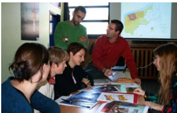
Projekt „GoGIS”: vytváření přeshraničního Mapového informačního systému.

INTERREG IV nemá nedostatek projektů – obě muzea jsou připravena k práci s novými partnery, a to docela významnými: navazují spojení s Louvrem, který bude mít od počátku roku 2008 pobočku v Lens, a muzeem Dr. Guislaina v Gentu, specializujícího se na art brut . Nápady, které jsou v jednání, zahrnují projekt Navettes de l'Art (autobusová přeprava mezi Gentem, Lille, Hornu, Lens, atd.), projekt Musées jardins (letní aktivity zaměřené na rodiny), sdružování dokumentů v držení těchto čtyř muzeí a dokonce výstavu – v budově bývalé celnice.