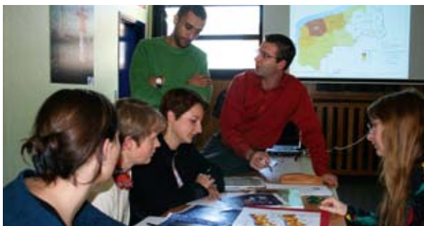
"GoGIS"-projektet: etablering af et grænseoverskridende geografisk informationssystem

Der mangler ikke projekter til INTERREG IV. De to museer er parate til at samarbejde med nye og endda ret så vægtige partnere. Man er således ved at knytte bånd til Louvre-museet, der åbner en afdeling i Lens i 2008, samt til Dr. Guislain-museet i Gent, der er specialiseret i art brut. Af øvrige projekter undervejs kan nævnes Navettes de l'Art (busbefordring mellem Gent, Lille, Hornu, Lens osv.), Musées jardins (sommeraktiviteter med familier som målgruppe), fælles adgang til de fire museers dokumentssamlinger og endda en udstilling i en tidligere toldbygning.