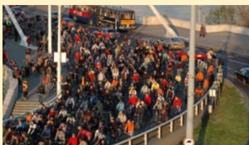
INTERREG-projektet "ChangeLAB" skal opmuntre til miljøvenlige forbrugsmønstre, uden at det koster livskvalitet og velstandsfremgang.

Hvilken fremtid venter der så for den kommende budgetperiode, 2007-2013? Det interregionale samarbejde vil fortsat udvikle sig under INTERREG IVC-programmet. Det vil bygge på IIIC-programmets succes, hvorfra visse aspekter er bibeholdt samtidig med, at der også er indført nye prioriteter og tilgange.