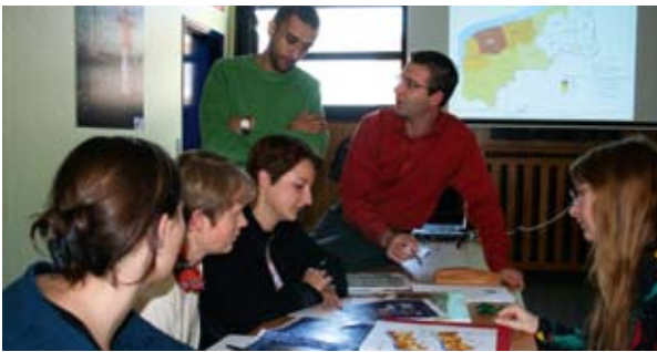
Έργο «GoGIS»: δημιουργία ενός διασυνοριακού Συστήματος Γεωγραφικών Πληροφοριών.

Οι ευκαιρίες για νέα έργα πολλαπλασιάζονται με το INTERREG IV – τα δύο μουσεία είναι έτοιμα να συνεργαστούν με νέους και αρκετά σημαντικούς εταίρους: διασυνδέονται με το Λούβρο, το οποίο θα έχει παράρτημα στη Lens από το 2008, και με το μουσείο Dr. Guislain της Γάνδης που ειδικεύεται στην art brut. Άλλες ιδέες υπό συζήτηση είναι το έργο «Navettes de l'Art» (γραμμή λεωφορείων μεταξύ των πόλεων Γάνδη, Λίλλη, Hornu, Lens κλπ.) και το έργο «Musées jardins» (καλοκαιρινές δραστηριότητες που απευθύνονται σε οικογένειες), η συγκέντρωση εγγράφων από τις συλλογές των τεσσάρων μουσείων και ακόμη μια έκθεση στο κτίριο ενός πρώην τελωνείου.