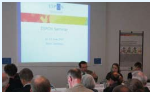
Importantes nuevos conocimientos en materia de tendencias de desarrollo especial.

Diríjase a: info@espon.eu o visite la página web http://www.espon.eu/