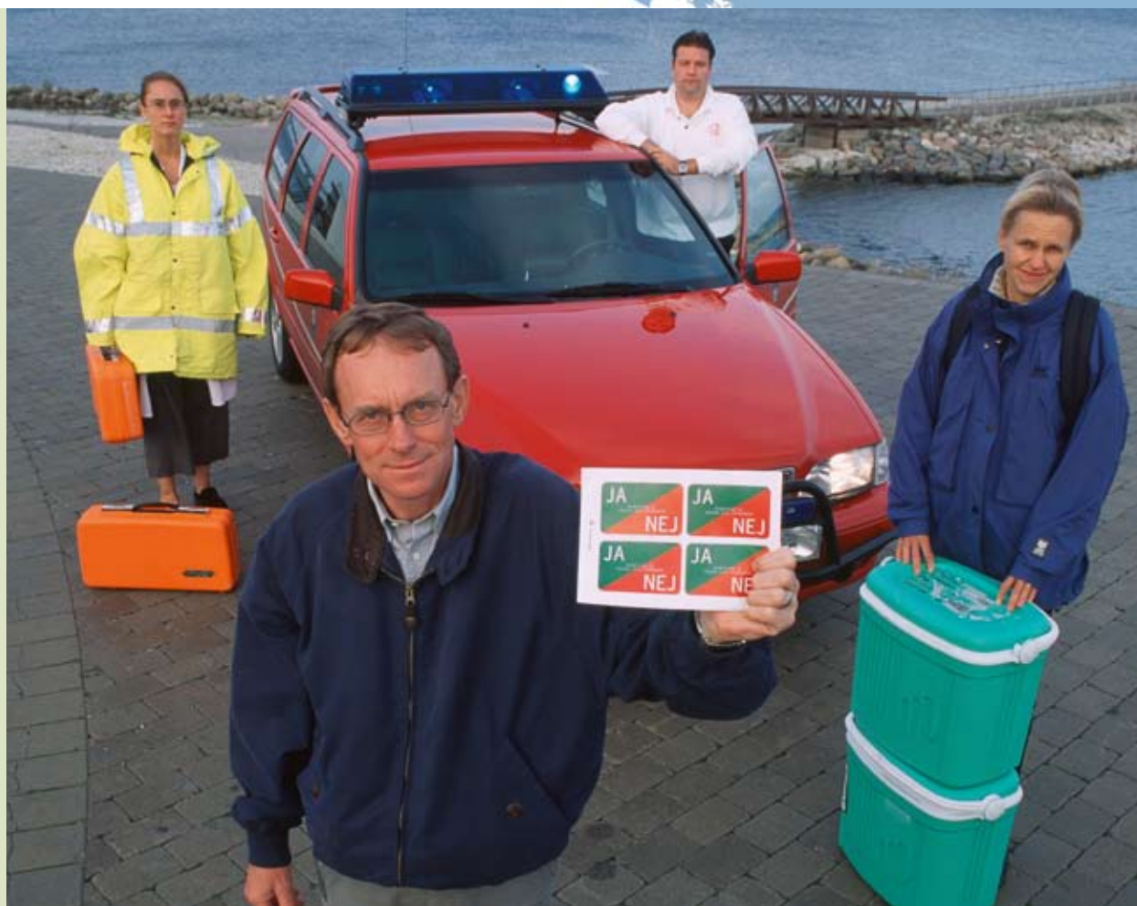
Taani ja Rootsi vaheline organidoonorluse koostöö.

Barnier, kes on ka ise pärit piiriäärsest piirkonnast (Savoie Prantsusmaal), 2004. aasta kolmandas raportis majandusliku ja sotsiaalse ühtekuuluvuse kohta ettepaneku uue õigusliku vahendi kasutuselevõtmiseks Euroopa koostööstruktuuri kujul. Määruse eelnõu moodustas tollal osa 2007.–2013. aasta programmiperioodi õigusaktide paketest uuendatud ühtekuuluvuspoliitika kohta.