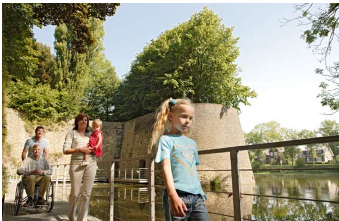
„Kindluslinnade võrgustiku” prioriteediks on kõigile kättesaadav kultuuriturism.

PACTEst kuni INTERREG IVni edeneb Prantsuse-Belgia piiriülene koostöö tööpoolest väga hästi.