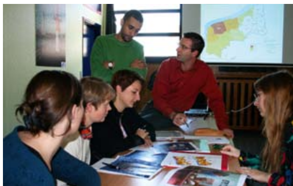
Projekt „GoGIS”: piiriülese geograafilise infosüsteemi loomine.

INTERREG IV raames ei ole projektidest puudu – kaks muuseumi on valmis töötama uute ja sealjuures päris suurte partneritega: nad moodustavad sidemeid Louvre’iga, mis rajab filiaali Lensi alates 2008. aastast, ning Dr Guislaini muuseumiga Gentis, mis on spetsialiseerunud art brut’ le. Ühendusliini ideede hulgas oli ka projekt Navettes de l’Art (bussitransport Genti, Lille’i, Hornu, Lensi jne vahel), projekt Musées jardins (peredele suunatud suvised tegevused), nelja muuseumi ühis- kasutuse dokumendid ja isegi näitus – endises tollihoones.