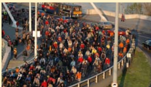
INTERREGi projekti „ChangeLAB” eesmärgiks on julgustada keskkonnasõbralike tarbimismustreid elukvaliteeti ja heaolu vähendamata.

Milline on siis järgmise eelarveperioodi (2007–2013) tulevik? Piirkondadevaheline koostöö jätkab arengut programmi INTERREG IVC raames. Arendatakse edasi programmi IIIC edu, mille teatavad aspektid on säilitatud, võttes samas kasutusele uusi prioriteete ja lähenemisviise.