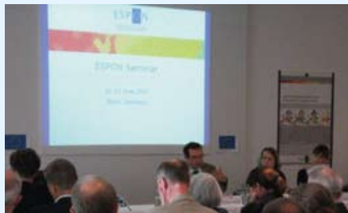
Olulised uued teadmised ruumilise arengu suundade kohta.

Kontakt: info@espon.eu ( http://www.espon.eu/ )