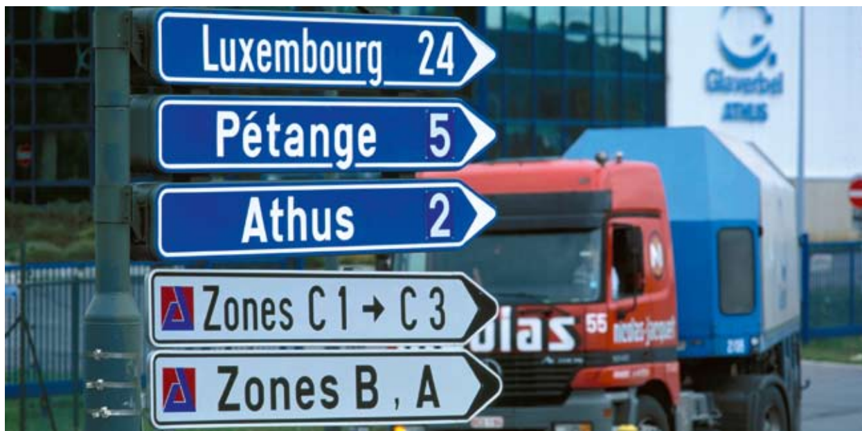
Elava liiklusega veoautomarsruut, mis ületab Belgia, Prantsusmaa ja Luksemburgi piire.

Sõites Brüsselist Luxembourg'i ja edasi Strasbourg'i, on andestatav, kui mõeldakse, et ELis enam piire ei eksisteeri. Kuid isegi siin, Euroopa südames, on INTERREGi roll piiride mõju ületamisel ja tõrgeteta toimiva siseturu saavutamisel endiselt elulise tähtsusega.