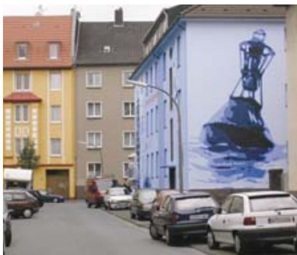
Jelenet abból a homlokzatfestési műveletből, amelyre a lakótelepek felújítását célzó URBAN-cselekvés keretében Dortmundban kerül sor