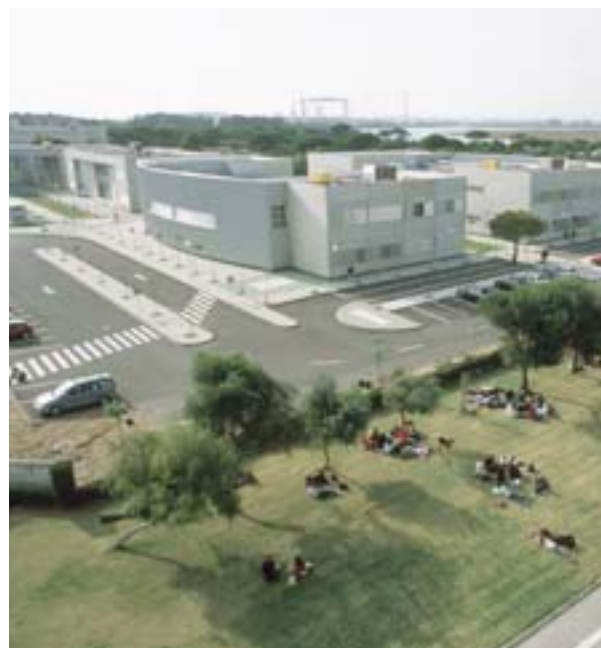
Cádizi Egyetem (Spanyolország), a tengeri tudományok tanszéke: szélesre tárt kapuk a kutatás előtt

Az európai városok számos olyan pozitív tapasztalattal rendelkeznek, amelyre építeni lehet. Döntő fontosságú, hogy a városok ne pazaroljanak erőforrásokat a spanyolvisz újabb feltalálására. Maximálisan támaszkodniuk kell az URBACT program és az egyéb európai és országos hálózatok használatára során felgyűlt tapasztalatokra. További segítséget jelent az is, hogy a Bizottság az összes európai városra ki akarja terjeszteni az URBAN programban szereplő városok tapasztalatcseréjét.