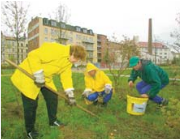
Akcióban a zöld brigád a lipcsei URBAN-övezet közepén található Henrietteparkban