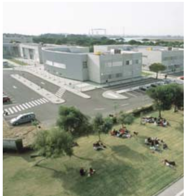
Universiteit van Cadiz (Spanje), departement Mariene wetenschappen: een campus die openstaat voor onderzoek.

Er zijn vele goede werkwijzen om op verder te bouwen in Europese steden. Het is van cruciaal belang dat steden geen middelen verspillen door het wiel steeds weer opnieuw uit te vinden. Steden moeten hun gebruik van de ervaring die is opgebouwd in het Urbact-programma en andere Europese en nationale netwerken, maximaal benutten. Het is ook nuttig dat de Commissie van plan is de uitwisseling van ervaring buiten de steden in het Urban-programma alleen uit te breiden.