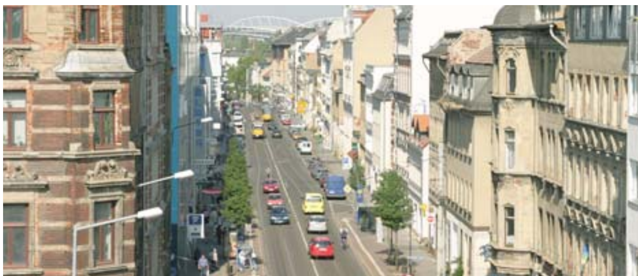
De Zschochersche Straße in Leipzig, één van de verkeersaders die zijn geherwaardeerd in het kader van Urban.

Steden worden steeds meer gezien als de motoren van nationale en regionale economieën in plaats van economische lasten — „de rijkdom van naties”. Steden zijn echter niet alleen economische troeven — het zijn niet louter markten. Zij hebben een enorme capaciteit om gemeenschapsontwikkeling, sociale cohesie en maatschappelijke en culturele identiteit te stimuleren.