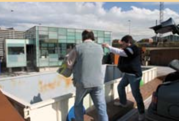
Het „milieupunt” in Gijón.

die een hefboom-effect creëren en een toegevoegde waarde opleveren. Deze zijn de geïntegreerde aanpak en het zoeken naar synergieën met andere publieke en private acties. Twee voorbeelden kunnen deze voornemens illustreren.