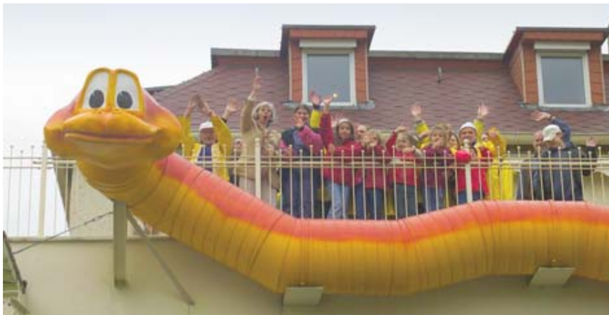
Deze reusachtige aardworm, die symbool staat voor vitaliteit, flankiert de voorgevel van het gebouw waar Wege e.V. gevestigd is. Dat is een vereniging van ouders van kinderen met psychologische problemen in Leipzig, die steun krijgt van Urban.

De 12 Duitse Urban II-programma's gaan gepaard met de interventies van de Europese fondsen en de andere ontwikkelingssteun die wordt verleend door de federale staat, de deelstaten en de steden. Door hun participatieve, geïntegreerde en vernieuwende aanpak maken zij de betrokken wijken weer aantrekkelijk en dynamisch, en geven zij de inwoners opnieuw trots en hoop. Het bewijs: Leipzig en Dortmund.