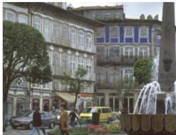
In Guimarães (Portugal), een stadscentrum dat volledig in een nieuw kleedje gestoken is om het toerisme, de cultuur en het MKB te stimuleren.

Uit de Urban-audit is gebleken dat de misdaadcijfers en de angst voor misdrijven in de stad hoger is dan elders. De enquête van de percepties van de bevolking, die deel uitmaakt van de audit, benadrukte ook dat een betere veiligheid een bepalende factor was voor de aantrekkelijkheid van een stad voor investeerders en inwoners. Op dit gebied beweert de Commissie dat steden een gezamenlijke, proactieve benadering tot misdaadbestrijding aannemen, inclusief het plannen, ontwerpen en onderhouden van openbare plaatsen om misdaad weg te werken. Tevens moeten ze de nadruk leggen op jonge mensen die het slechte pad dreigen op te gaan, en vooral potentiële criminelen pakken die aan het begin van hun „carrière” staan en plaatselijke veiligheidsgerelateerde banen creëren en professionaliseren, en daar buurtbewoners bij betrekken. Hiervoor kunnen programma's voor plaatselijke bemiddelaars, ambtenaren voor de veiligheid van de gemeenschap, straatbewakers en programma's voor buurtwachten in het leven worden geroepen.