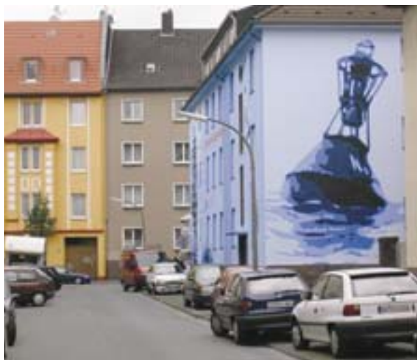
Een aspect van de operatie gevels schilderen, uitgevoerd in het kader van de Urban-actie voor de renovatie van wijken, in Dortmund.