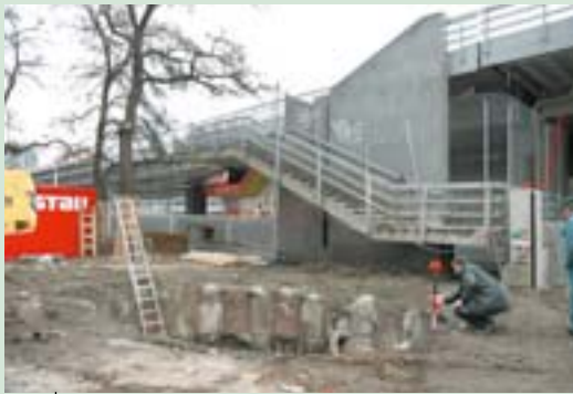
Boven en onder: inrichting van het metrostation Florenc B. in Praag.

De grote doelstelling van het doelstelling 2-programma voor Praag is van de Tsjechische hoofdstad een volwaardige dynamische Europese metropool te maken.