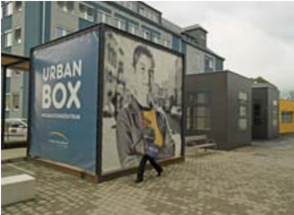
Het nieuwe technisch instituut FH Joanneum in Graz West (Oostenrijk), in een vroegere industriezone die met de hulp van Urban is omgevormd tot high-techcomplex.