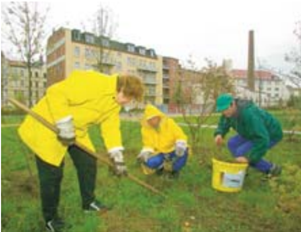
Een groene brigade in actie in het Henriettepark, in het centrum van de Urban-zone in Leipzig.