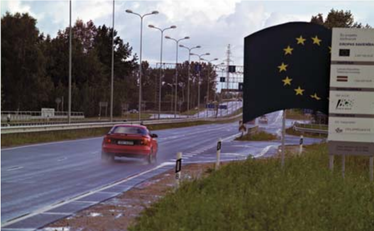
Door de toegang tot de luchthaven van Riga (Letland) te verbeteren heeft dit Phare-project de stadsontwikkeling vleugels gegeven.