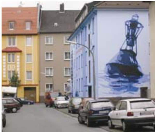
Fassaadide värvimine Dortmundis oli osa URBANi linnajagude renoveerimise meetmest.