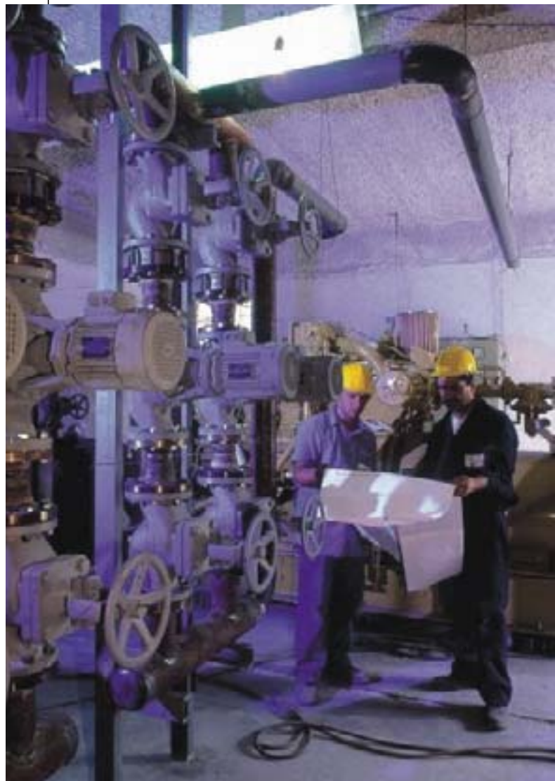
Palermo (Itaalia): naturaalsest gaasist elektrienergia tootmine.

Rohkem kui 50 uuenduslikku piirkonda teevad nimetatud eesmärgil FEDARENE'i – kogu Euroopa piirkondlike energiaagentuuride föderatsioon - raames koostööd, nende