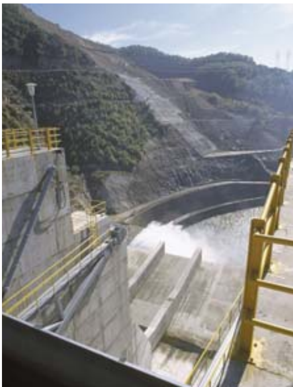
Piirideta hüdroelektrienergia: tamm Nestose jõel, Kreeka ja Bulgaaria vahel.

divõimalusi. Piirkonnad, kes investeerivad täna säästva ja rohelise energia infrastruktuuri, saavad homme hüvitust stabiilsete energiahindade ja nimetatud valdkonnas tugevate ettevõtete näol.