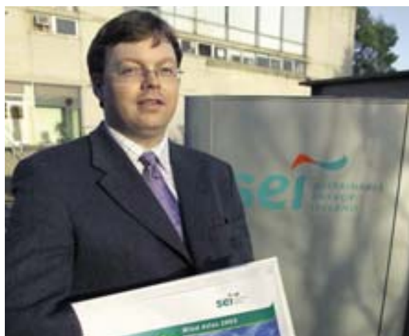
Iirimaa avaldas tuuleenergia sektori arendamiseks „Riikliku tuulte atlase“.

Hooned vastutavad Euroopa elektritarbimise 40% eest. Ehitussektor võib seega mängida olulist rolli energiatõhususe alaste eesmärkide elluviimisel. Seepärast on ehitistedirektiivi (direktiiv ehitiste energiatõhususe kohta, 2002/91/