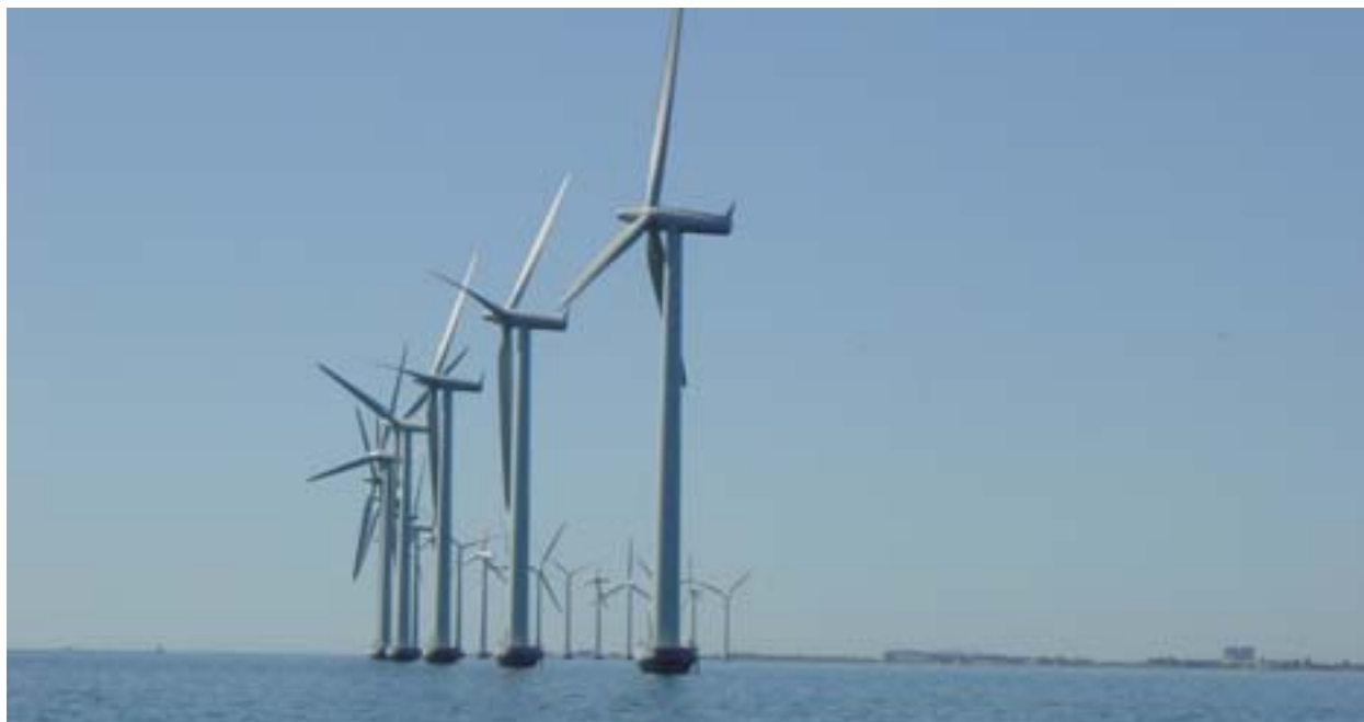
Merel asuv tuuleenergia park Kopenhaageni lähedal.