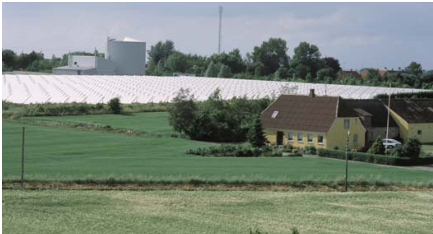
„Päikesepark“ Marstalis (Taani).

Asjaomaste osalejatega tihedalt seotud piirkonnad aitavad väga laialdaselt kaasa Euroopa ja rahvusvaheliste energiaalaste eesmärkide saavutamisele. Euroopa ja rahvusvahelised ambitsioonikad eesmärgid soodustavad vastastikku regionaalarengut ja annavad tõe kohalikule majandusele.