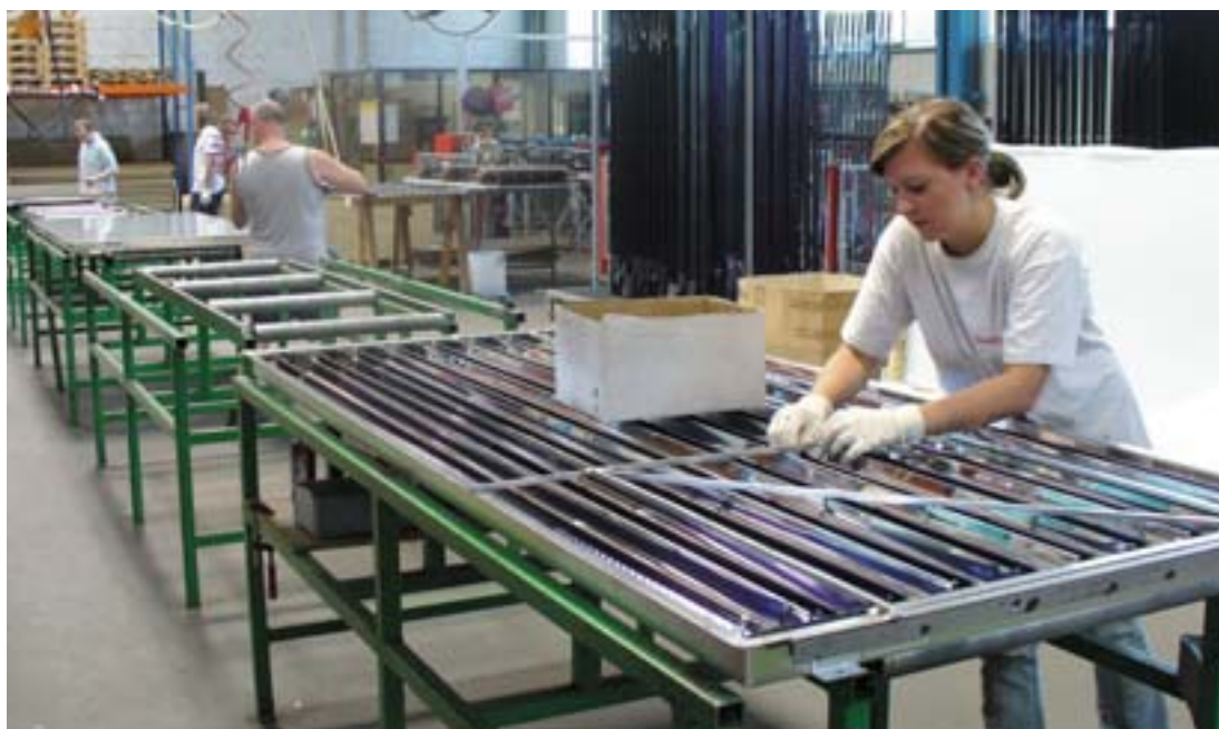
Päikesepaneelide tootmine St. Ulrichis.

Alates 1991. aastast on Ülem-Austria viljelenud energia valdkonnas ennetavat poliitikat: ergutanud energia tõhusust, toetanud alternatiivseid energiaallikaid, viinud läbi infrastruktuuride katseprojekte jne. Kui transport välja arvata, siis peaaegu kolmandik liidumaades tarbitavast energiast tuleb edaspidi taastuvatest energiaruudest. See mõjub regionaalarengule positiivselt. Kohtumised ja näited projektidest.