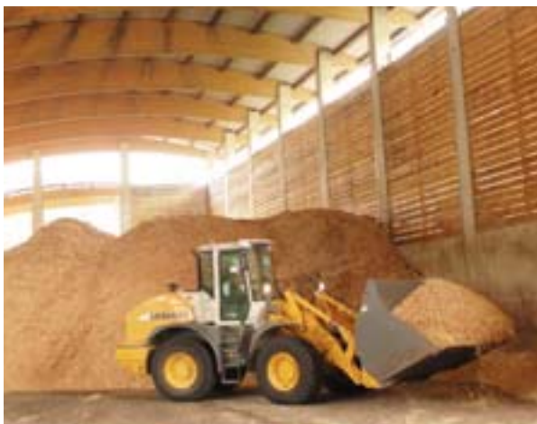
Kütteks mõeldud saepuidu ladu.

Piirkonnad tagavad erinevate osalejate vahelise ühenduse – olles kodanikele abiks, jagades olulist teavet Euroopa energiapoliitika osas – ning on lisaks sellele energiapoliitika rakendamise õnnestumiseks hädavajalikud.