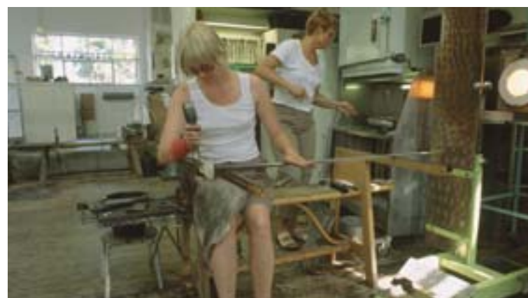
Podpora malých a stredných podnikov v Svaneke, Bornholm (Dánsko): dielňa, kde sa ručne vyrábajú sklené výrobky, určené na vývoz.