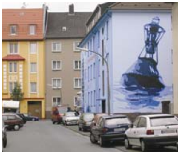
Pohľad na natieranie fasádnych múrov v rámci kampane URBAN na obnovu mestských častí v Dortmunde.