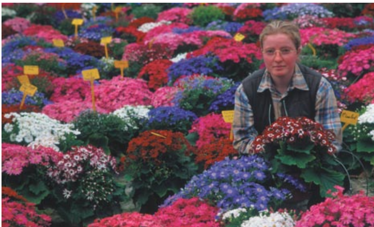
Zahradnický výzkum a vývoj spolufinancovaný z Evropského fondu pro regionální rozvoj, Barfleur, Dolní Normandie, Francie.

Pro koho mají být fondy Společenství prospěšné? Jak je veřejnost informována o projektech financovaných ze strukturálních fondů? Jaká opatření navrhla Komise, aby se orgány své kroky konzultovaly s evropskými občany a ti se aktivně účastnili? Jaká je v tomto dlouhodobém procesu role generálního ředitelství pro regionální politiku?