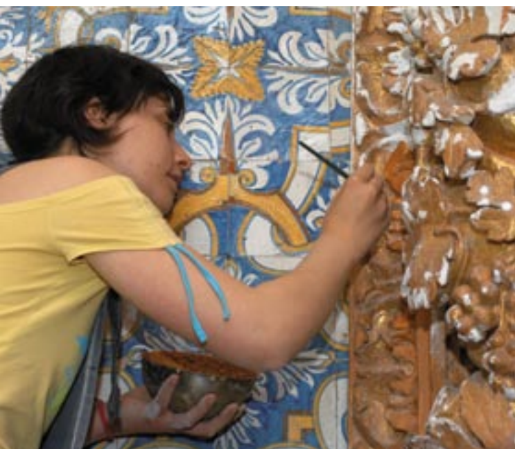
Restaurování románské fresky v údolí Sousa, Portugalsko.