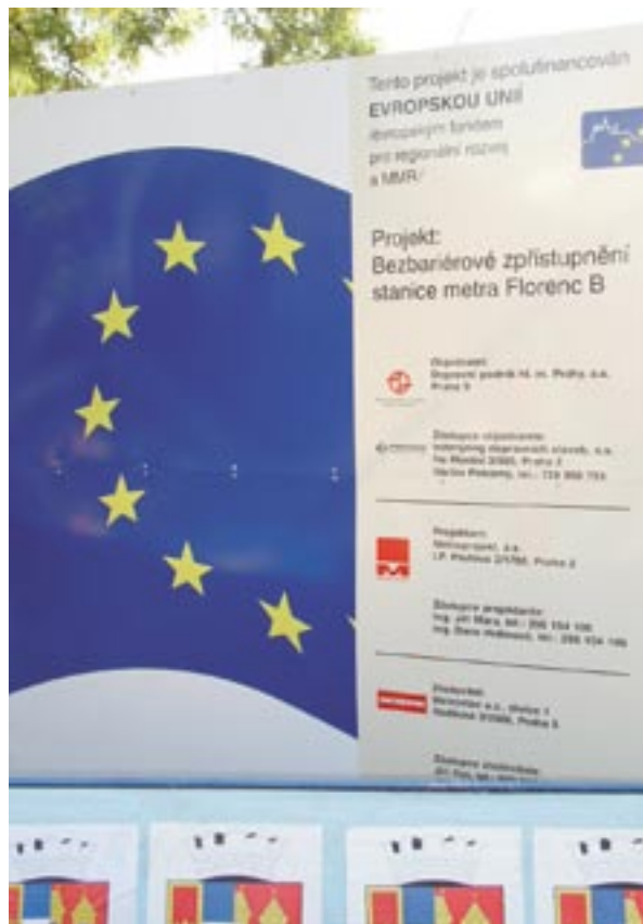
Tabule označující výstavbu nové stanice metra v Praze, Česká republika.

V Bruselu se bude ve dnech 26.-27. listopadu 2007 konat konference „ Výměna zkušeností – Politika soudržnosti v zájmu růstu a zaměstnanosti “, týkající se informování a propagace strukturálních fondů. Jejím cílem bude získat pracovníky zodpovědné za informace (Information Officers) ze všech operačních programů, očekává se 400–500 účastníků. Akce poslouží jako určitý otevřený trh pro prezentaci jednotlivých komunikačních přístupů a členům jednotlivých sítí nabídne mnoho možností a příležitostí.