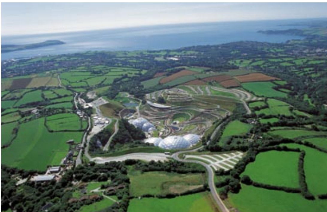
Panoramatický pohled na projekt Eden poblíž St Austell.

Region „Cornwall a ostrovy Scilly“, který byl v období 2000-2006 příjemcem Cíle 1 a v letech 2007-2013 je vhodný pro cíl „Konvergence“, zažívá skutečné sociálně-ekonomické oživení. Ze zemědělské oblasti v krizi, odkázané hlavně na své primární zdroje a turistiku, se anglický „Finistere“ mění v region, který se opírá o znalostní ekonomiku a uznává hodnoty otevřenosti, rozmanitosti, inovace a kvality.