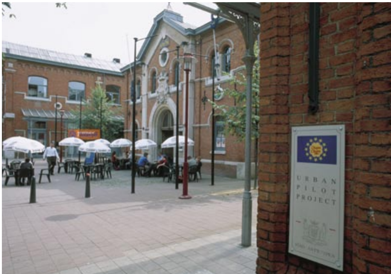
Centrum NOA v Antverpách, Belgie, poskytuje služby 15 malým firmám a místní kavárně v sousedství.

Vzájemná spolupráce národních a regionálních expertů na komunikaci zlepšuje informovanost o strukturálních fondech, zvyšuje počet a kvalitu návrhů projektů a posiluje vědomí o Evropské unii a její politice soudržnosti.