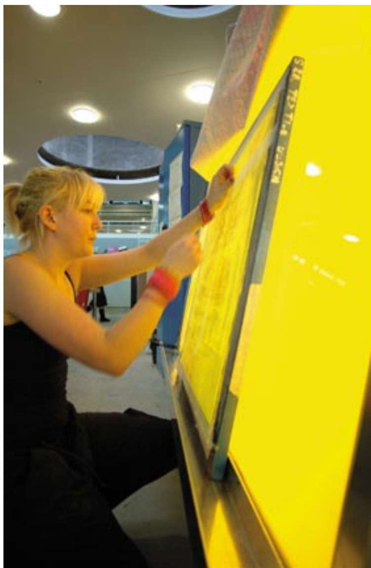
Textilní design je specializací CUC.