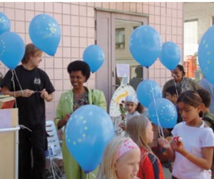
Rodiče a děti v novém rodinném centru pro přistěhovalce ve Vantaa, Finsko.

Nová síť Společenství INFORM, která nahrazuje SFIT, má za cíl spojit všechny osoby odpovědné za komunikaci ze všech operačních programů v rámci Evropského fondu pro regionální rozvoj a Fondu soudržnosti. Hlavním úkolem je sdílet zkušenosti a najít cesty ke zlepšování kvality komunikačních aktivit, zvýšit povědomí o výhodách kroků Společenství, ať již jde o potenciální příjemce nebo širokou veřejnost, a zlepšit zviditelnění projektů financovaných s pomocí EU. Doporučená prioritní témata pro období 2007-2013 jsou následující: