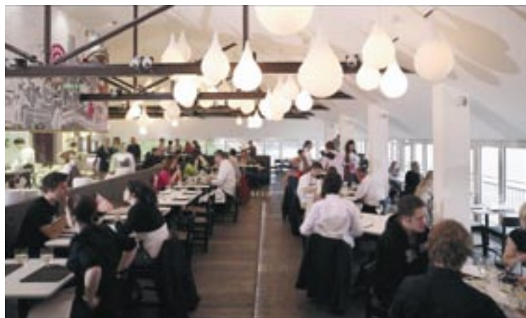
Zákazníci si vychutnávají „haute cuisine“ v restauraci Fifteen.

Těch přibližně 22 milionů EUR (z toho 9 milionů v rámci cíle 1) určených na širokopásmový internet umožnilo vytvořit nebo konsolidovat 3 500 pracovních míst a HDP v Cornwallu zvýšilo o 123 milionů EUR ročně. „ Tento internet je společně s rekvalifikacemi a inovacemi základem moderního hospodářství, “ tvrdí Mark Yeoman, zástupce ředitele Partnerství cíle 1. „ Posouvá nás směrem ke znalostní společnosti, protože velkou měrou napomáhá marketingu našich výrobků a naší otevřenosti světu. “