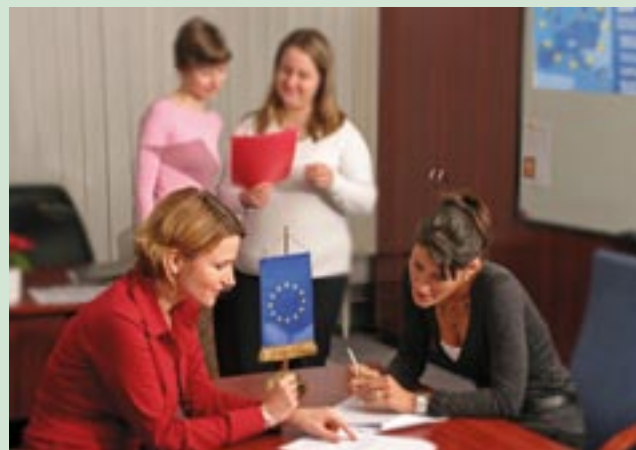
■ Tým maďarské národní rozvojové agentury v práci.