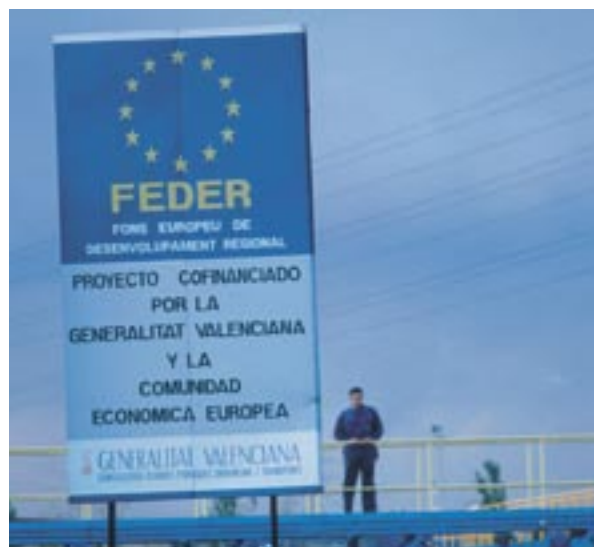
Propagace fondů EU ve Španělsku.

příjemců pomoci ze strukturálních fondů a Fondu soudržnosti. Nová prováděcí pravidla Komise v tomto ohledu stanovují, že řídicí orgány musí potenciálním příjemcům oznámit, že souhlas s finanční pomocí znamená také souhlas se zveřejněním seznamu takovýchto příjemců. Tyto seznamy, včetně názvů projektů a výše veřejných financí určených na každou z operací, budou zveřejněny v souladu s článkem 7.2(d) uvedených pravidel.