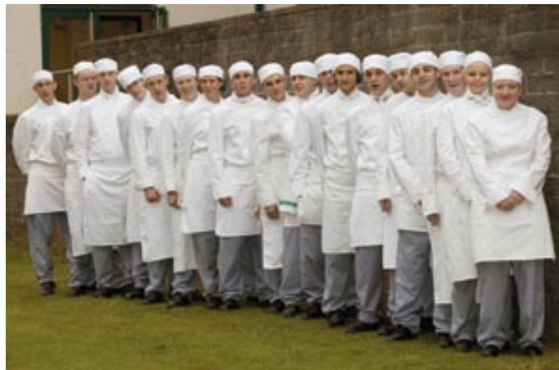
Mladí kuchařští učni se skvělou budoucností.

Jamie Oliver navštívil zátoku Watergate Bay v roce 2005 a byl místem nadšený, takže se rozhodl otevřít tady restauraci, tedy za podmínky, že dostane podporu z veřejných zdrojů. „Projekt byl připraven za několik málo měsíců,“ vysvětluje Carleen Keleman, ředitelka společných podniků v rámci cíle 1. „Partneři zahrnující SWRDA, vládní úřad pro region South West a Jobcentre Plus spolu s několika dalšími státními i soukromými partnery chtěli udělat maximum pro znevýhodněné mladé obyvatele Cornwallu. Byl schválen příspěvek z cíle 1 ve výši 828 000 EUR, projekt byl přijat v srpnu 2005 a restaurace byla otevřena v květnu 2006.“ Stejně jako Extreme Academy zaznamenala cornwallská Fifteen, ve které vzniklo