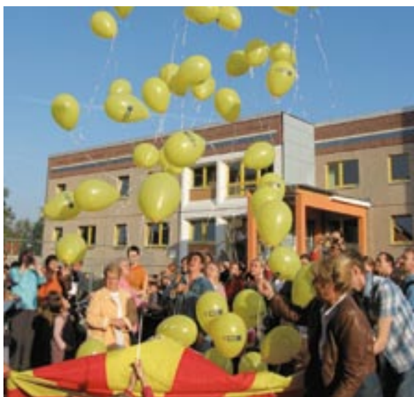
Åbning af en vuggestue i Urban II-området Leipzig, Tyskland