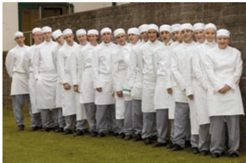
Unge kokkelærlinge med en lys fremtid