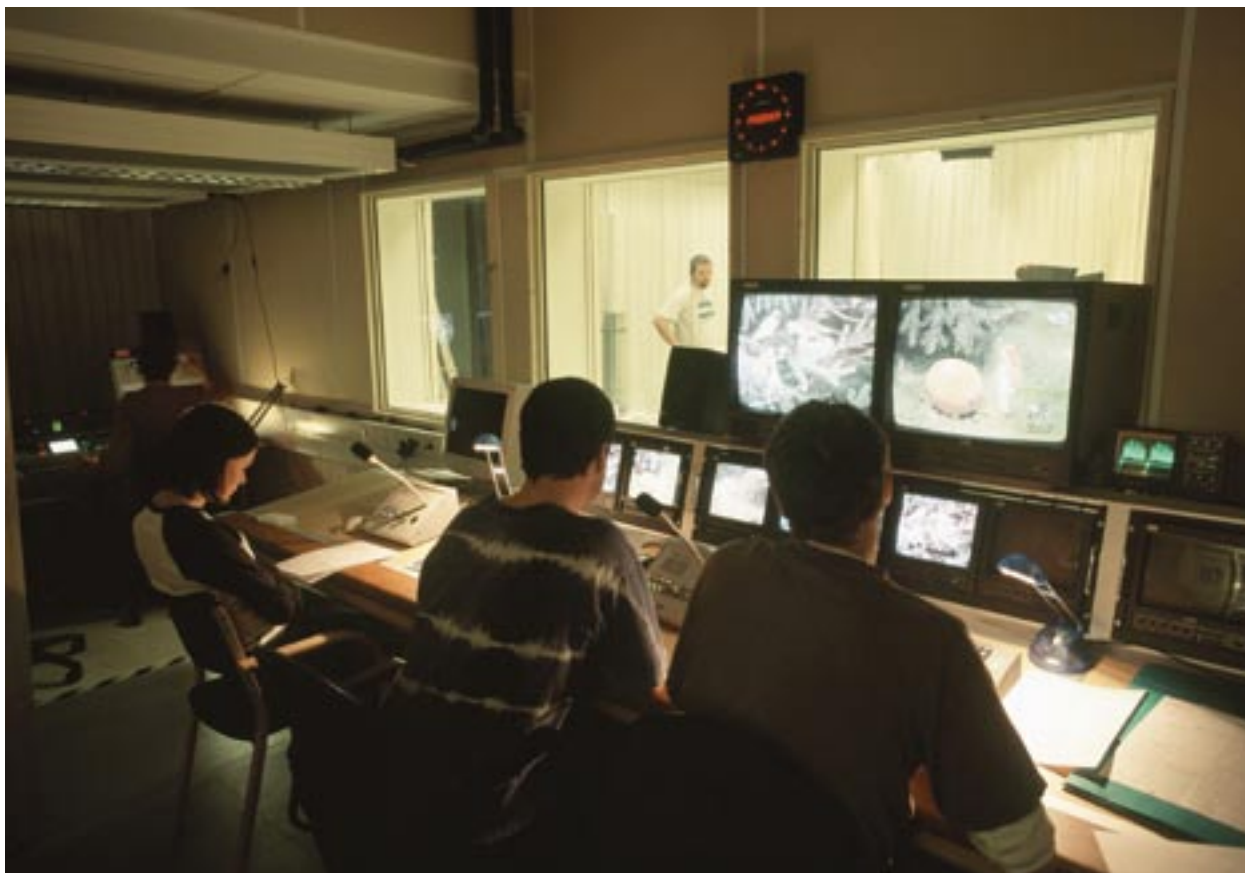
Uddannelse i digital teknologi: kursus i tv-produktion i Västernorrland, Sverige

De nye regler for perioden 2007-2013 lægger grundlaget for udarbejdelsen af en kommunikationsplan, der indeholder en detaljeret beskrivelse af de informations- og PR-foranstaltninger, som er nødvendige for at opfylde alle potentielle behov. Planen skal desuden identificere de enkelte deltagende parter roller og ansvar. Hos hver forvaltningsmyndighed vil en særligt udpeget person være ansvarlig for at gennemføre informationsforanstaltninger for at forbedre informationsudvekslingen mellem medlemsstaterne og Kommissionen om informations- og PR-foranstaltninger. Kommissionen har i den forbindelse oprettet INFORM for at samle de embedsmænd, som har ansvaret for kommunikation hos forvaltningsmyndighederne.