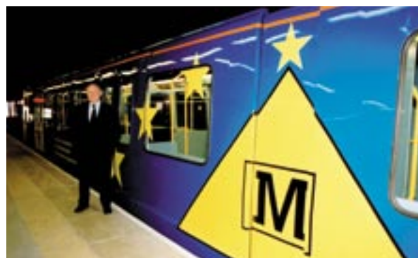
Adskillige togvogne i den nye Sunderland Metro i England er beklædt i EU-farver.