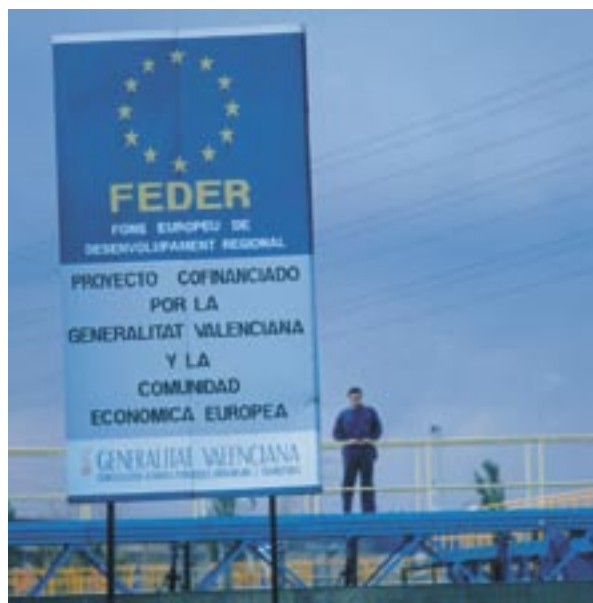
Promovering af EU-finansiering i Spanien

støttemodtagere om, at man ved at acceptere finansiell støtte også indvilger i at blive optaget på listen over støttemodtagere. Listen, herunder projektnavne og størrelsen af den offentlige finansiering til de enkelte projekter, offentliggøres i overensstemmelse med artikel 7.2.(d) i samme forordning.