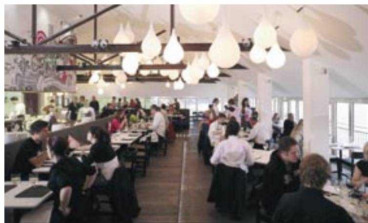
Kunder nyder haute cuisine i Fifteen.