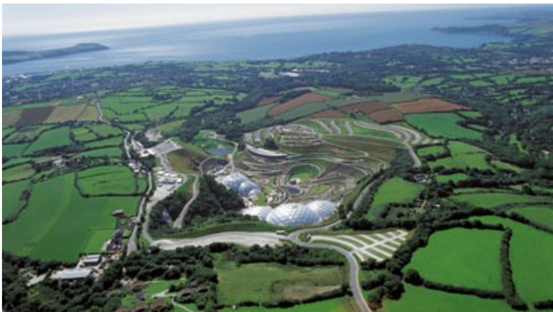
Πανοραμική άποψη του προγράμματος «Eden Project» κοντά στο St Austell

Δικαιούχος του στόχου 1 την περίοδο 2000–2006 και επιλέξιμη για χρηματοδότηση στο πλαίσιο του στόχου σύγκλισης την περίοδο 2007–2013, η περιφέρεια Cornwall & Isles of Scilly βιώνει μια πραγματική κοινωνική και οικονομική αναγέννηση. Από αγροτική περιφέρεια σε κρίση, που εξαρτάτο κυρίως από τους πρωτογενείς της πόρους και τον τουρισμό, το «Finistere» της Αγγλίας μεταμορφώνεται σε οικονομία της γνώσης, αναγνωρίζοντας την αξία της ευρύτητας των αντιλήψεων, της διαφοροποίησης, της καινοτομίας και της ποιότητας.