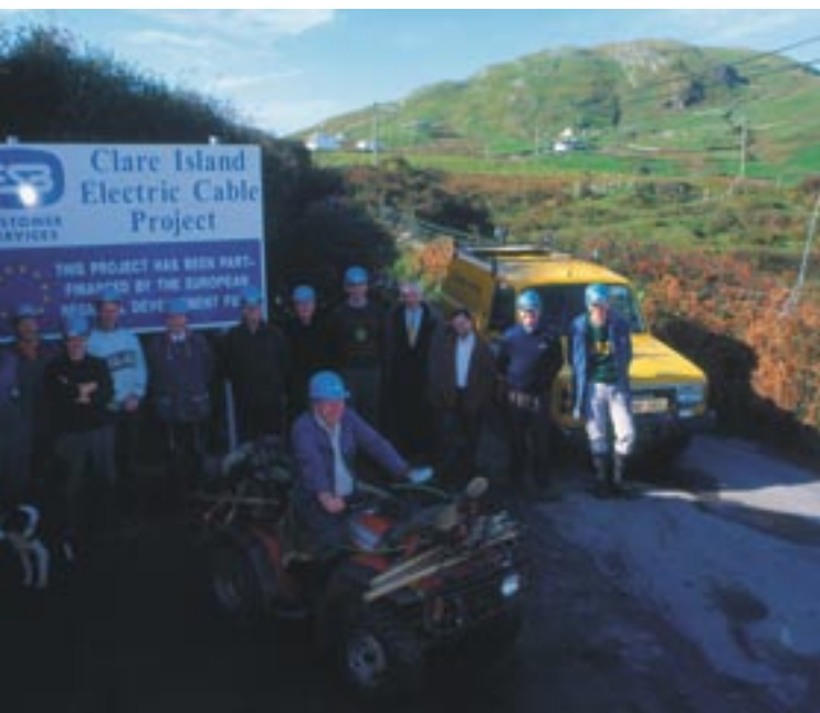
Ηλεκτροδότηση του Clare Island, Co. Mayo, Ιρλανδία

Ιστότοπος της οργάνωσης European Movement: http://www.europeanmovement.org/ .