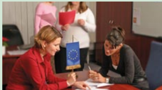
Η ομάδα επικοινωνίας της ΕΥΑ της Ουγγαρίας επί το έργον

Για περισσότερες πληροφορίες: szucs.judit@meh.hu ( www.nfh.hu )