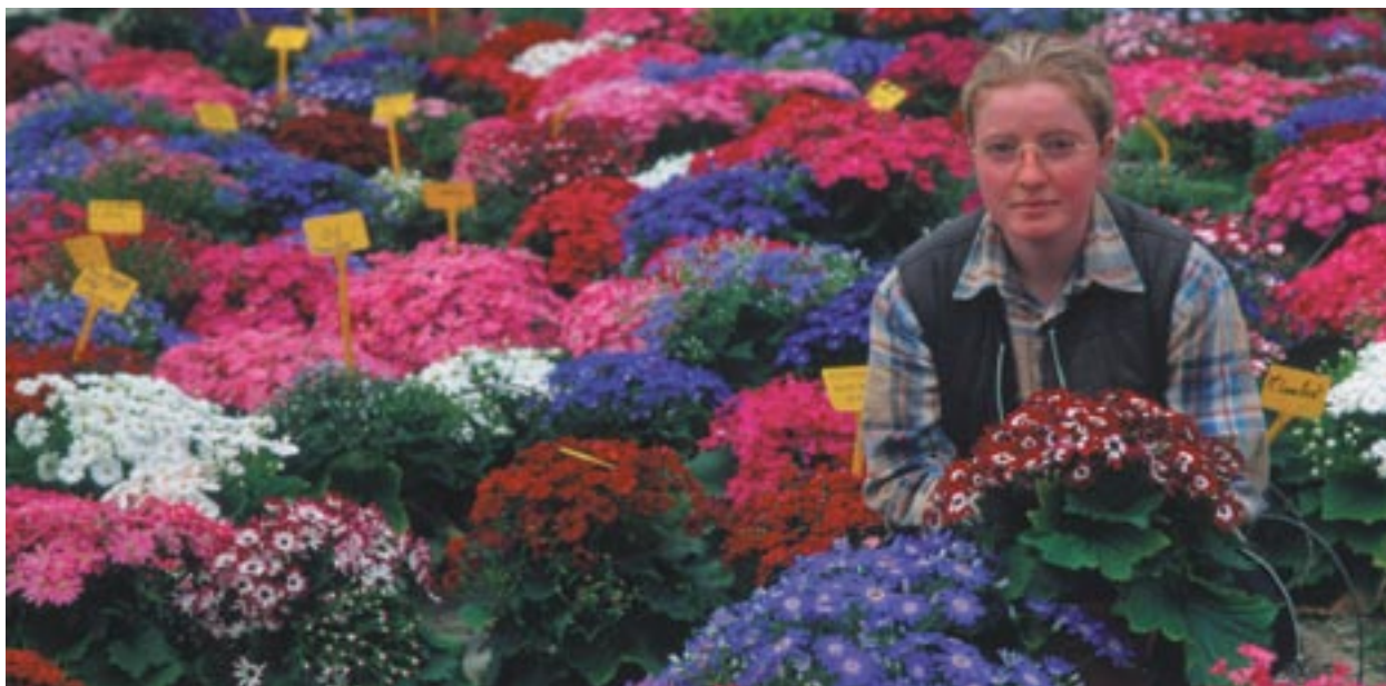
■ Ανθοκομική έρευνα και ανάπτυξη που συγχρηματοδοτείται από το ΕΤΠΑ στην πόλη Barfleur, Κάτω Νορμανδία, Γαλλία.

Ποιους θα ωφελήσουν τα κοινοτικά κονδύλια; Πώς ενημερώνεται το κοινό για τα έργα που χρηματοδοτούνται από τα διαρθρωτικά ταμεία; Ποια μέτρα πρότείνει η Επιτροπή για να διασφαλιστεί ότι λαμβάνεται υπόψη η γνώμη των ευρωπαίων πολιτών και ότι ενθαρρύνεται η συμμετοχή τους; Ποιος είναι ο ρόλος της Γενικής Διεύθυνσης Περιφερειακής Πολιτικής σε αυτή τη μακροχρόνια διαδικασία;