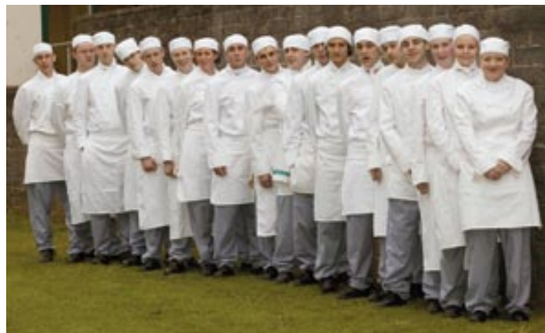
Νεαροί μαθητευόμενοι σεφ με λαμπρό μέλλον

Το 2005, ο Jamie Oliver επισκέφθηκε το Watergate Bay και εντυπωσιάστηκε από την περιοχή. Επιθυμούσε διακαώς να ανοίξει ένα εστιατόριο Fifteen εκεί, με την προϋπόθεση ότι το πρόγραμμα θα είχε τη στήριξη του κοινού. «Το έργο αναπτύχθηκε σε λίγους μόλις μήνες», εξηγεί η Carleen Kelemen, διευθύντρια του Objective One Partnership (σύμπραξη στόχου 1). «Οι εταίροι, συμπεριλαμβανομένης της υπηρεσίας SWRDA, της υπηρεσίας Government Office for the South West και του Jobcentre Plus καθώς και ορισμένων άλλων εταίρων του δημόσιου και ιδιωτικού τομέα, επιθυμούσαν να επωφεληθούν τα μέγιστα από την ευκαιρία αυτή