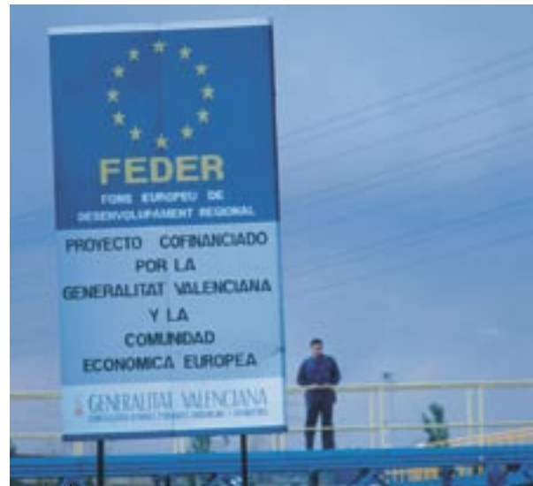
Προβολή της χρηματοδότησης από την ΕΕ στην Ισπανία

τους δυνητικούς δικαιούχους πως αποδοχή των χρηματικών ενισχύσεων σημαίνει επίσης ότι αποδέχονται να συμπεριληφθούν στον κατάλογο των δικαιούχων. Οι κατάλογοι, που περιλαμβάνουν επίσης το όνομα των έργων και το ποσό της δημόσιας χρηματοδότησης που χορηγείται για κάθε δράση, θα δημοσιεύονται σύμφωνα με το άρθρο 7 παράγραφος 2 στοιχείο δ) του σχετικού κανονισμού.