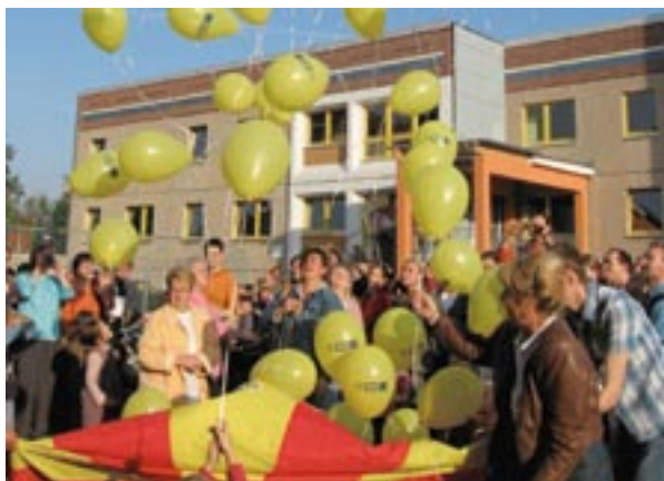
Εγκαίνια παιδικού σταθμού στην περιοχή Leipzig URBAN II, Γερμανία