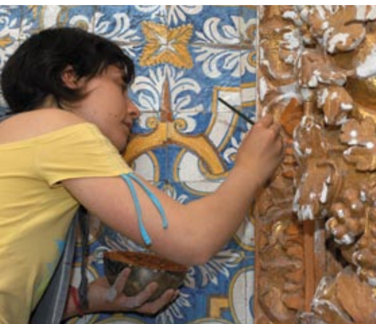
Restauración de un fresco romano en el valle de Sousa, Portugal.

Estos tres elementos se confirmaron en el Libro Verde (2) aprobado por la Comisión el 3 de mayo de 2006. El tema central de este documento es la investigación de puntos de vista y propuestas sobre la manera de establecer un orden del día para una política europea de comunicación. Este enfoque se inscribe en una lógica complementaria al «Plan D como democracia, diálogo y debate» iniciado por la Comisión el 13 de octubre de 2005 para favorecer la participación activa de los ciudadanos en el debate sobre Europa. El Plan D es la primera etapa de un proceso a largo plazo destinado a consolidar los fundamentos democráticos de la Unión Europea y afianzarla en los valores y expectativas de sus ciudadanos.