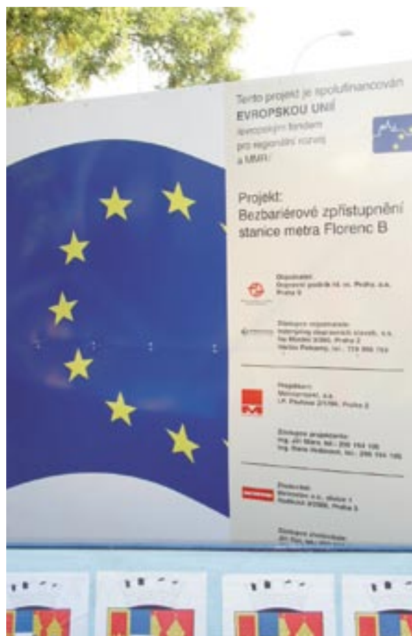
Valla para anunciar la construcción de una nueva estación de metro en Praga, República Checa.

Los días 26 y 27 de noviembre de 2007 , se celebrará en Bruselas una conferencia sobre la información y la publicidad relativas a los Fondos Estructurales, titulada Telling the story — Cohesion Policy for Growth and Jobs . Está prevista para atraer responsables de la comunicación de todos los programas operativos. Pueden esperarse entre cuatrocientos y quinientos participantes. Este acontecimiento permitirá la presentación de distintos enfoques de la comunicación y brindará numerosas oportunidades de conectarse en red.