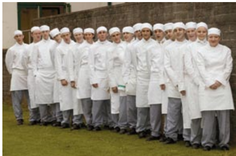
Jóvenes aprendices de cocinero con un brillante futuro por delante.