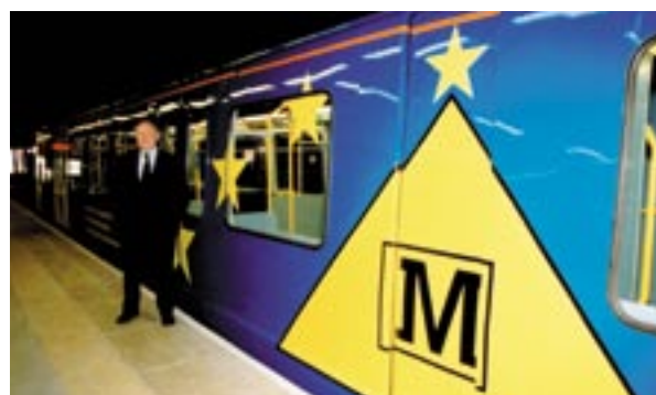
Varios coches del nuevo metro de Sunderland, en Inglaterra, lucen los colores de la Unión Europea.