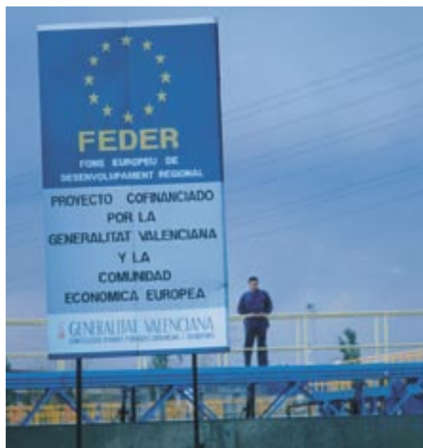
Promoción de la financiación de la Unión Europea en España.

que las autoridades de gestión informarán a los beneficiarios potenciales que la aceptación de la financiación también implica la aceptación de su inclusión en la lista de los beneficiarios. Esta lista, que incluirá el nombre del proyecto y el importe de los fondos públicos asignados a cada operación, se publicará de conformidad con lo dispuesto en el artículo 7, apartado 2, letra d), de este mismo Reglamento.