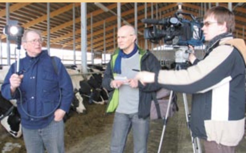
Rodando un reportaje sobre una granja letona.

En 2005, empezaron a difundirse con regularidad programas de radio (en febrero) y de televisión (marzo). Para garantizar la mejor calidad posible de estos programas, la Autoridad de gestión organizó un concurso abierto para seleccionar al equipo de producción. El resultado final fue un programa radiofónico semanal de veinte minutos: «Llaves para los Fondos Europeos» ( Eiropas fondu atslēgas ), difundido en la radio nacional todos los miércoles. Este programa da a los radioyentes información sobre los fondos europeos y ejemplos de proyectos financiados por la Unión Europea, complementada con visitas a los lugares y entrevistas con las personas y las comunidades locales beneficiarias de los proyectos. Cada quince días, los lunes, se difunde un programa televisado de veintiséis minutos, «Eurobus» ( Eirobussīņš ), que presenta proyectos financiados por la Unión Europea y explica cómo presentar una solicitud de fondos europeos. En realidad, «Eurobus» es un microbús, que recorre Letonia para encontrar a las personas que participan en proyectos financiados por la Unión Europea. En 2005, «Eurobus» empezó por una serie que enumeraba seis etapas para desarrollar un proyecto financiado con fondos comunitarios, y luego presentó las ocho agencias de ejecución de Letonia. Al igual que «Llaves para los fondos europeos», «Eurobus» visita lugares y examina las experiencias de los ciudadanos para presentar una solicitud de fondos europeos.