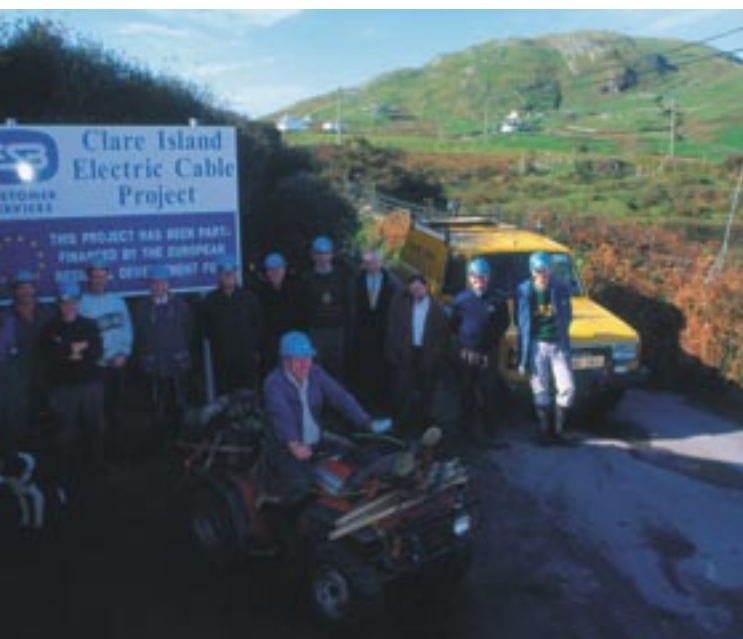
Electrificación de la Isla de Clare, en el condado de Mayo, Irlanda.