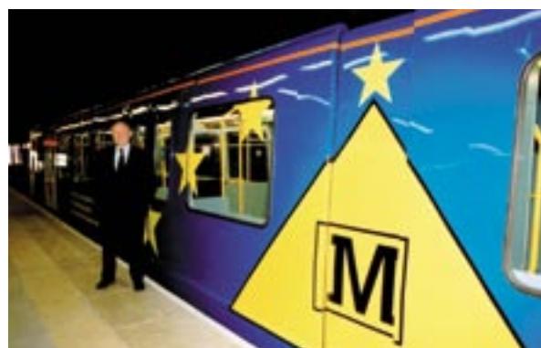
Mitmel vagunil Suderlandi uues metroos Inglismaal on kasutatud ELi värve.