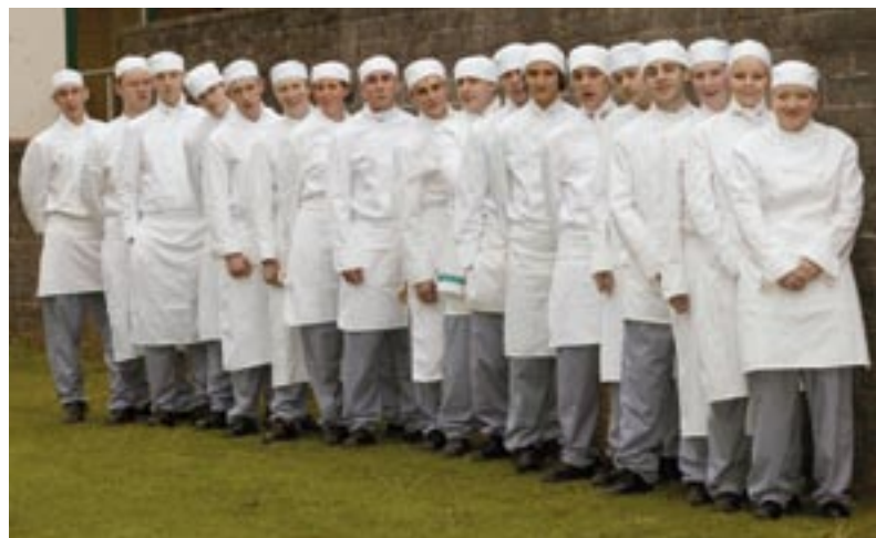
Noori peakoka õpilasi ootab suur tulevik.