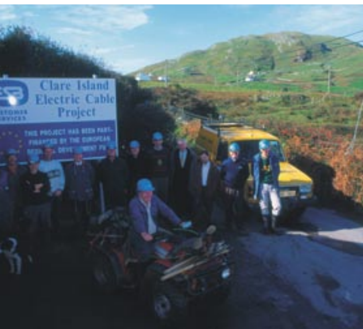
Clare saare elektrifitseerimine Mayo krahvkonnas Iirimaa.

Kõik need tingimused on osaks pikaajalises protsessis, mis lisaks Euroopa fondide kasutamise tõhustamisele on samuti suunatud kodanike sidemete tihendamisele ühenduse institutsioonidega ning Euroopa Liidu demokraatlike aluste konsolideerimisele.