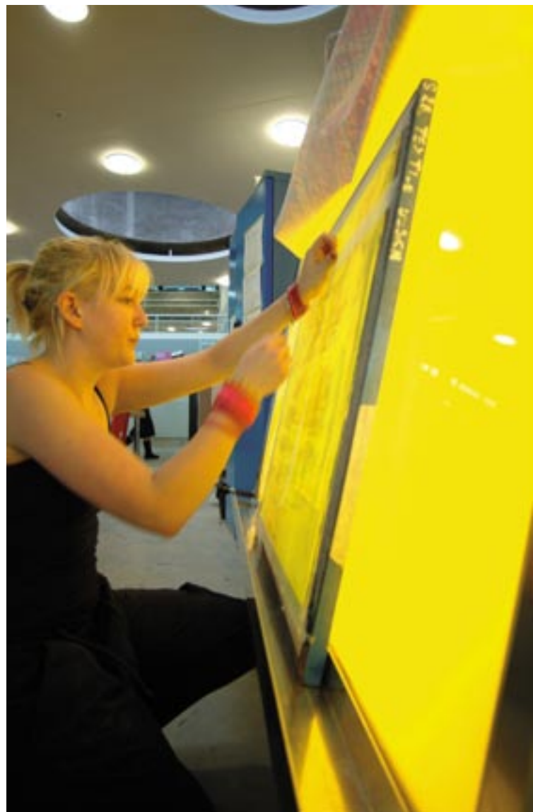
■ Tekstiilidisain on üks CUCi erialasid.