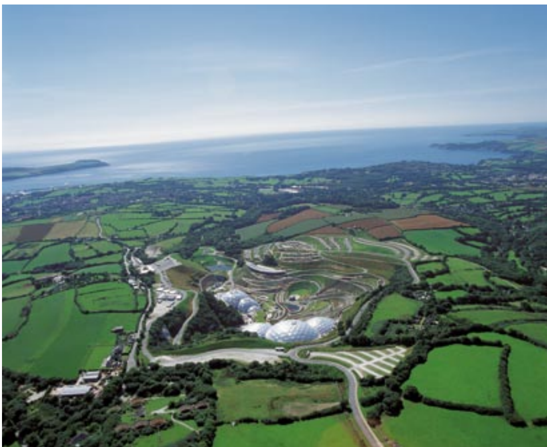
Eedeni projekti panoraamvaade St Austelli lähedal.

Cornwalli ja Scilly saarte regioon kui sihtala 1 raames abisaaja aastatel 2000–2006 ja konvergentsi sihtala raames abikõlblik aastateks 2007–2013 elab üle tõelist sotsiaalmajanduslikku taassündi. Kriisiseisundis, peamiselt oma põhiressurssidest ja turismist sõltuvast maapiirkonnast on Inglismaa „Finistere” teostamas üleminekut teadmispõhisele majandusele, teadvustades avatuse, mitmekesisuse, innovaatika ja kvaliteedi väärtusi.