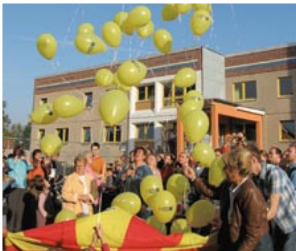
Lastesõime avamine Leipzigi URBAN II piirkonnas, Saksamaal.