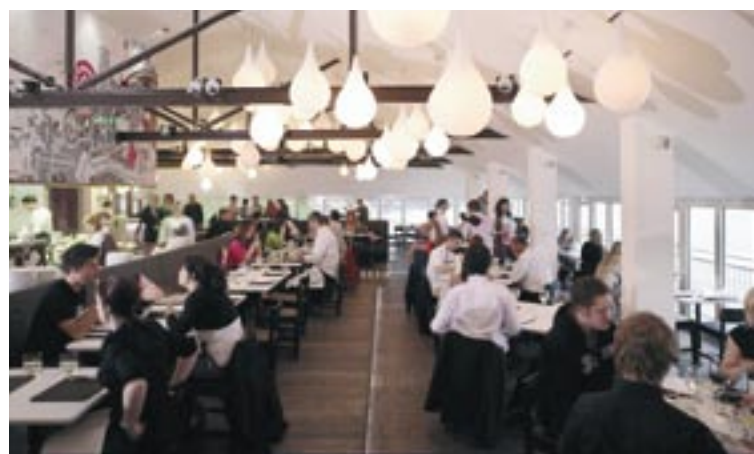
Kliendid nautivad „Fifteenis” kõrgkokakunsti.