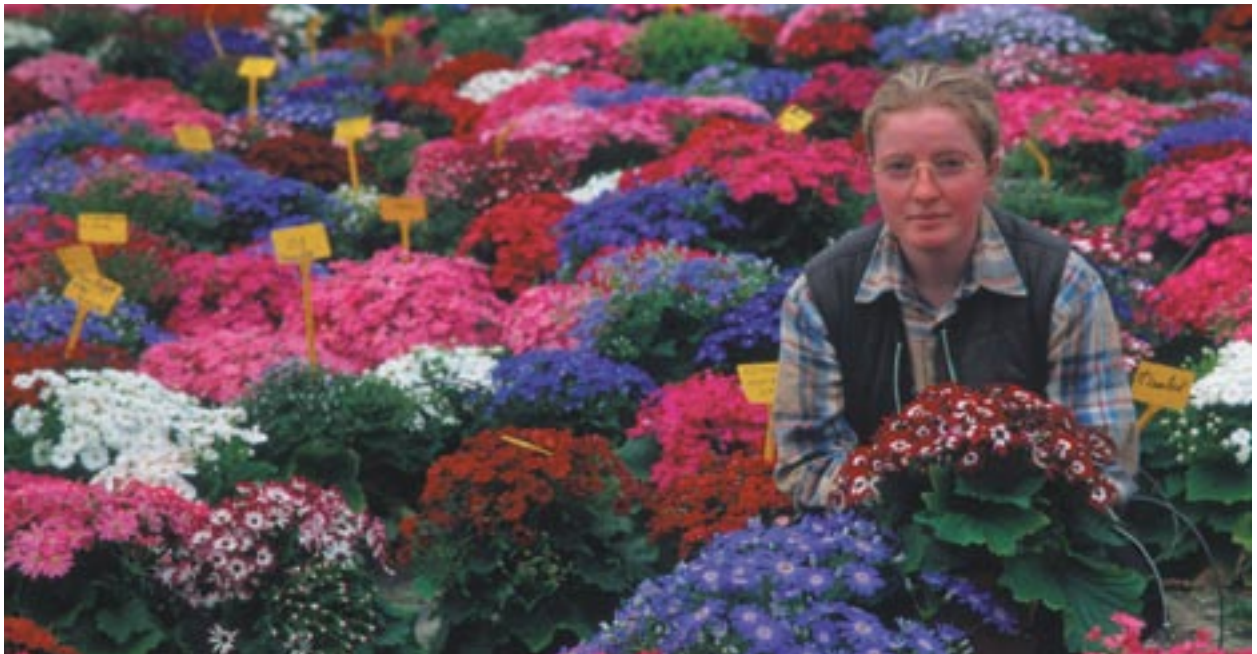
EAKR on osarahoittanut puutarhanhoitoon liittyvää tutkimusta ja kehitystä Ranskassa Basse-Normandien alueella.

Kenen on tarkoitus hyötyä yhteisön varoista? Kuinka kansalaisille kerrotaan rakennerahastoista rahoitettavista projekteista? Minkälaisilla toimilla komissio varmistaa, että Euroopan asukkaat pääsevät osallistumaan päätöksentekoon ja saavat äänensä kuuluviin? Mikä rooli aluepolitiikan pääosastolla on tässä pitkän aikavälin prosessissa?