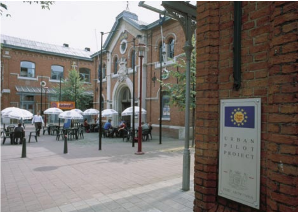
Houkuttelevan kahvilan lisäksi NOA-keskus Antwerpenissa tarjoaa palveluita 15 pienelle yritykselle (Belgia).

Kansallisten ja alueellisten viestinnän asiantuntijoiden yhteistyö tehostaa rakennerahastoista tiedottamista. Se lisää hanke-ehdotusten määrää ja laatua sekä parantaa tietoisuutta EU:sta ja sen koheesiopolitiikasta.