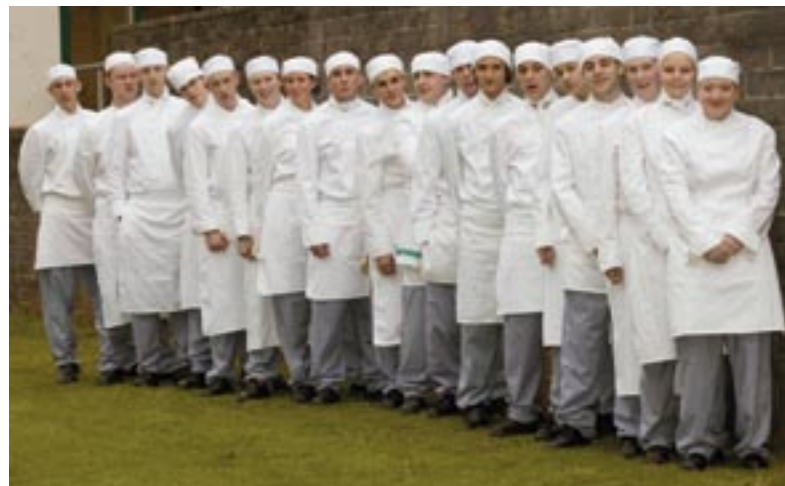
Nuorilla kokkioppilailla on edessään loistava tulevaisuus.