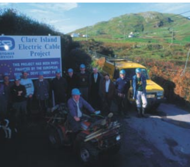
Clare Island -saaren sähköistäminen Irlannissa Mayon maakunnassa

Järjestelyt kuuluvat pitkän aikavälin prosessiin, jonka tarkoituksena on ottaa kansalaiset yhä tiiviimmin mukaan yhteisön instituutioihin ja vahvistaa Euroopan unionin demokraattista perustaa sekä tehostaa eurooppalaisten rahastojen käyttöä.