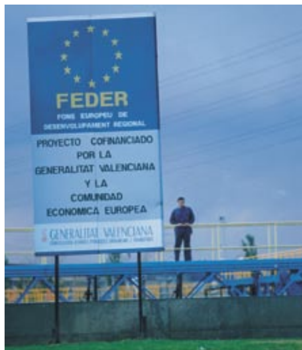
EU-rahoituksen mainos Espanjassa

myönnetyn julkisen tuen määrä, julkaistaan saman säädöksen 7.2 d artiklan mukaisesti.