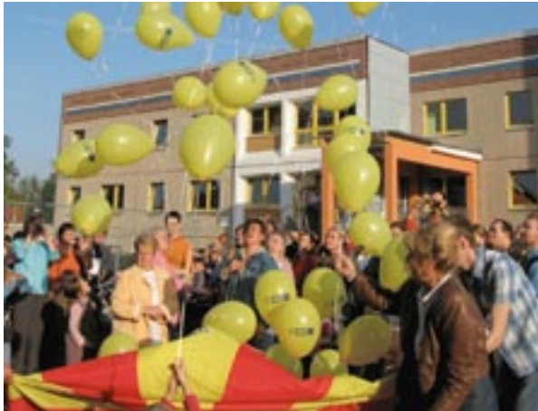
Päiväkodin avajaiset Urban II -alueella Saksan Leipzigissä