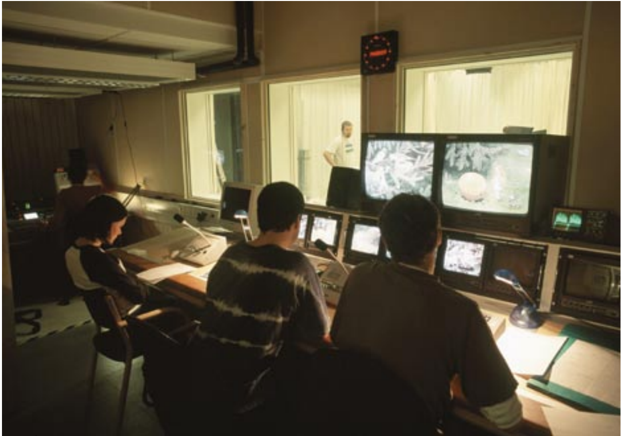
Ruotsin Västerbottenissä järjestetään koulutusta digitekniikasta. Opiskelijat perehtyvät TV-tuotantoon.

käyttöönoton Euroopan komissio aikoo kytkeä toimenpideohjelmien toimeenpanoon kaikki osapuolet, edunsaajat mukaan lukien.