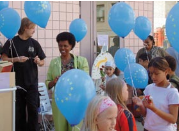
Lapsia ja vanhempia Vantaan uudessa maahanmuuttajille tarkoitetussa perhekeskuksessa

joissa osallistujat käsittelevät asiantuntemuksensa ja kokemuksensa pohjalta erityisiä aihealueita tai etsivät ratkaisuja yleisiin ongelmiin.