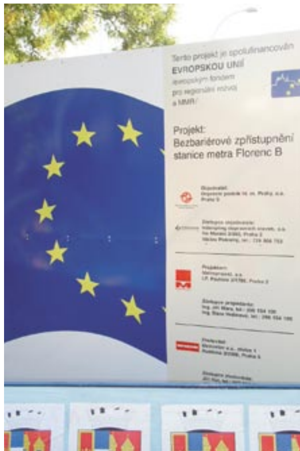
Egy új metróállomás építését hirdető tábla Prágában, a Cseh Köztársaságban

2007. november 26–27-én „A történet bemutatása – A növekedési és foglalkoztatási kohéziós politika” című, a strukturális alapokra vonatkozó tájékoztatással és reklámozással kapcsolatos konferenciára kerül sor Brüsszelben. A konferencia célja az összes operatív program tájékoztatói felelőseinek összehívása. A résztvevők várható számát 4-500-ra becsülik. Az esemény teret ad majd a különféle kommunikációs megközelítések bemutatásának, és számos hálózatépítési lehetőséget is biztosítani fog.