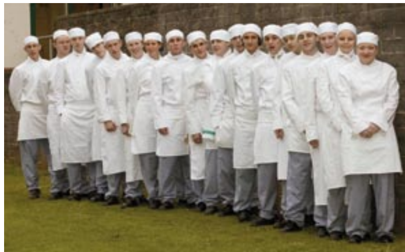
Fiatal szakácstanulók fényes jövő előtt

2005-ben Jamie Oliver meglátogatta a Watergate Bayt, és a helyszín kiváló benyomást tett rá. Ő nagyon lelkesen támogatta egy Fifteen vendéglő itteni megnyitását, de ezt a projekt állami támogatottságához kötötte. „A projekt kidolgozásához csak néhány hónapra volt szükség – magyarázza Carleen Kelemen, az »1. Célkitűzési Partnerség« igazgatója. – Partnereink, azaz az SWRDA, a Délnyugati Kormányzati Hivatal, a Jobcentre Plus és a köz- és magánszféra számos más szereplője azon voltak, hogy a hátrányos helyzetű cornwalli fiatalok ebből a lehetőségből a lehető legtöbb hasznot húzhassák. Az 1. célkitűzés 828 000 euró támogatást ítélt oda. A projektet 2005 augusztusában fogadták el, az étterem pedig 2006 májusában nyílt meg.” Akárcsak az Extrém Sportok Akadémiája, ez is tökéletes sikernek bizonyult: 2006 májusa és decembere között a 40 új munkahelyet teremtő Fifteen Cornwall étterem 65 000