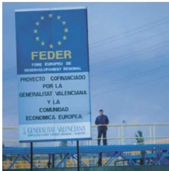
Az EU-támogatás promóciója Spanyolországban

a pénzügyi támogatás elfogadásával együtt azt is elfogadják, hogy felvegyék őket a kedvezményezettek listájára. Ezeket a a projektek neveit és az egyes műveleteknek nyújtott állami finanszírozás mértékét is feltüntető listákat az említett szabályzat 7.2(d) cikkének megfelelően fogják közzétenni.