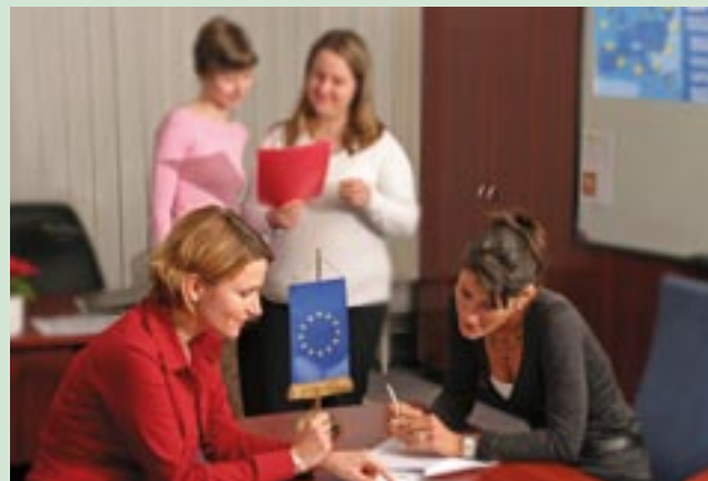
Dolgozik a magyar NFH kommunikációs csapata