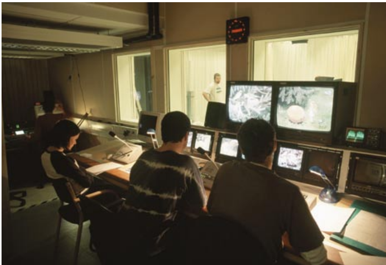
Oktatás digitális technológiával: oktató tv-programok készítése a svédországi Västernorrlandban

A 2007–13-as periódus új szabályai egy olyan kommunikációs terv előkészítését szolgálják, mely részletesen azonosítja azokat a tájékoztatási és reklámozási intézkedéseket, amelyekre a lehetséges hiányok pótlásához szükség lehet. Ennek minden egyes érintett fél szerepét és felelősségét is meg kell határoznia. Minden egyes irányító hatóság részéről egy erre kijelölt személy lesz felelős a tájékoztatási intézkedések bevezetéséért, valamint a tagállamok és a Bizottság közötti – a tájékoztatási és a reklámozási intézkedésekre vonatkozó – információcsere javításáért. Ennek érdekében a Bizottság létrehozta az irányító hatóságok kommunikációért felelős hivatalos személyeit egyesítő INFORM-ot.