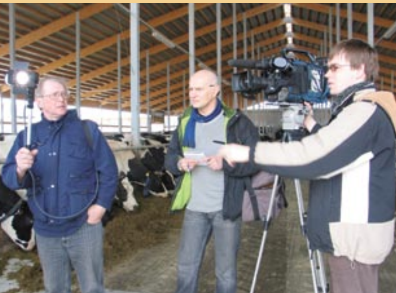
Filmuojamas reportažas apie vieną Latvijos ūkių

Abi programos pasižymi puikiais reitingais. 2005 m. pradėta transliuoti naujoji radijo laida turėjo 10 % visų radijo klausytojų, t. y. 45 000 žmonių auditoriją, o 2006 m. pabaigoje jos klausėsi 7,3 %, t. y. 35 000 radijo klausytojų. Televizijos laida 2005 m. turėjo 25 % žiūrovų auditoriją, kuri 2006 m. išaugo iki 33 %, t. y. 230 000 žiūrovų. 2006 m. pabaigoje per nacionalinę televiziją ir radiją iš viso buvo transliuojama 99 radijo programos ir 41 televizijos programa. Kiekvienas gali ištraukti į įdomią „Eurobuso“ kelionę ar pasinaudoti „Europos fondų raktais“ ES finansavimui skirtame tinklalapyje www.esfondi.lv – tereikia spustelėti televizijos ir radijo reklamjuostę dešiniajame puslapyje http://www.esfondi.lv/page.php?id=698 kampe.