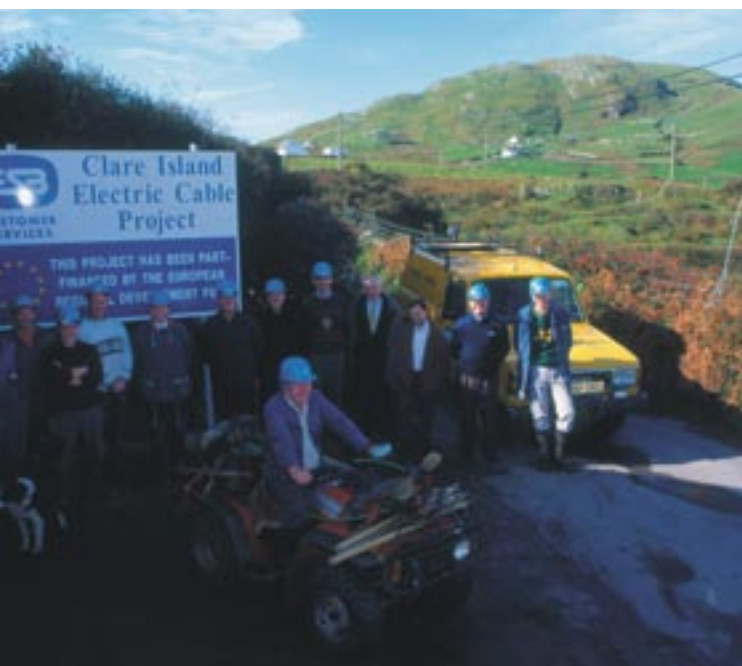
Klery salos Mėjo grafystėje (Airija) elektrifikacija

Visos šios priemonės yra dalis ilgalaikio proceso, kurio tikslas – ne tik veiksmingiau naudoti Europos fondų lėšas, bet ir skatinti glaudesnę piliečių bei Bendrijos institucijų ryšį ir stiprinti demokratinius Europos Sąjungos pagrindus.