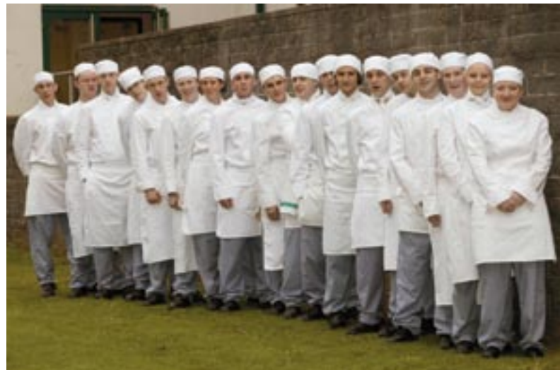
Būsimieji vyriausieji virėjai, kurių laukia puiki ateitis

2005 m. Jamie'is Oliveris apsilankė Votergeito įlankoje, kuri paliko jam didelį įspūdį. Jis panorė čia atidaryti „Fifteen“ restoraną – su sąlyga, kad projektas gaus valstybės