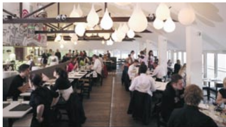
Lankytojai mėgaujasi aukščiausio lygio virtuve „Fifteen“ restorane