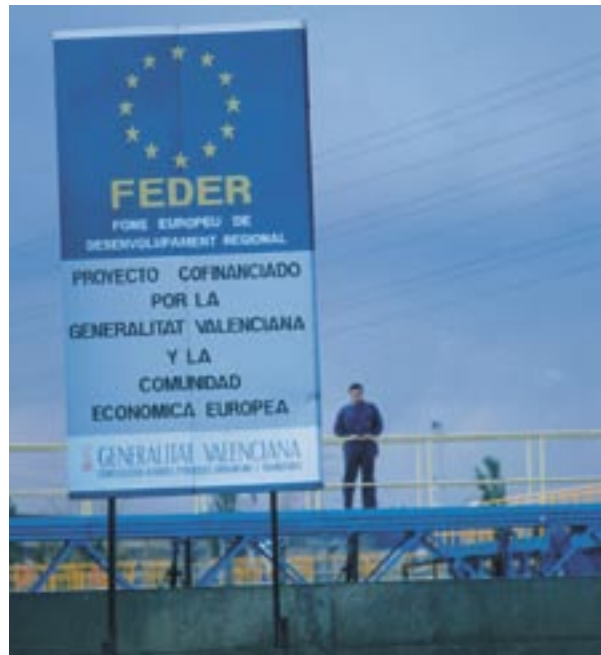
Informacijos apie ES finansavimą skelbimas Ispanijoje

pavadinimai bei kiekvienai operacijai skirta viešojo finansavimo suma, bus skelbiami to paties reglamento 7 straipsnio 2 dalies d punkte nustatyta tvarka.