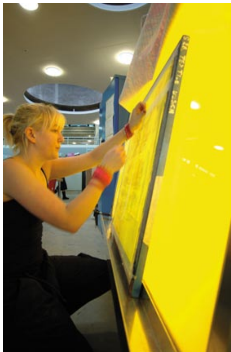
■ Tekstilės dizainas – viena iš CUC dėstomų specialybių