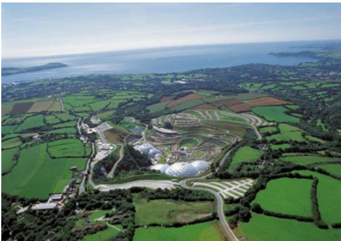
Netoli Sent Ostelo vykdomo Edeno projekto panorama

Gavęs 1-ojo tikslo paramą 2000–2006 m. ir atitinkantis 2007–2013 m. konvergencijos tikslo reikalavimus Kornvalio ir Silio salų regionas išgyvena tikrą socialinį ir ekonominį atgimimą. Anglijos „Finisteras“, kuris anksčiau buvo laikomas krizės apimtu kaimo regionu ir priklausė daugiausia nuo pirminių išteklių bei turizmo, dabar pereina prie žinių ekonomikos ir įsitikina atvirumo, įvairovės, naujovių bei kokybės teikiama nauda.