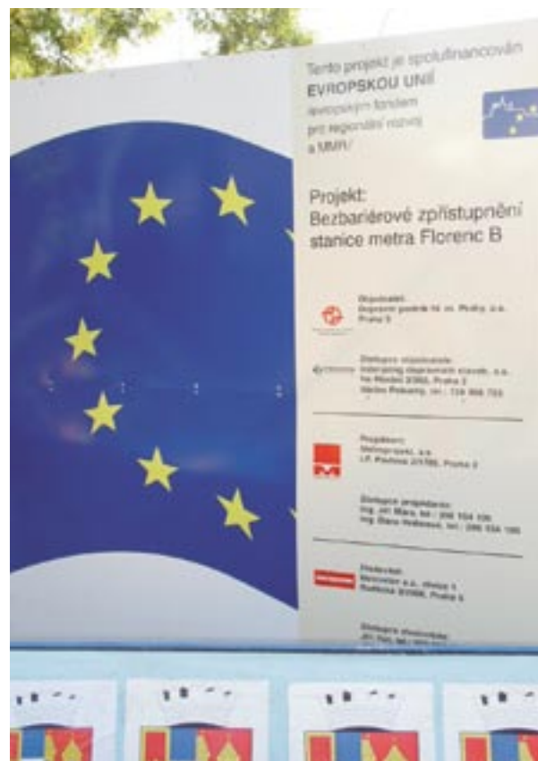
Stendas, informuojantis apie naujos metro stoties statybą Prahoje (Čekija)

Informavimui apie struktūrinius fondus ir viešumai skirta konferencija „Pasakojama istorija – sanglaudos politika augimui ir užimtumui skatinti“ įvyks 2007 m. lapkričio 26–27 d. Briuselyje. Jos tikslas – suburti visų veiksmų programų komunikacijos specialistus. Tikimasi, kad atvyks 400–500 dalyvių. Šis renginys taps atvira rinka, skirta pristatyti įvairius informavimo metodus ir atverti plačias tinklų kūrimo galimybes.