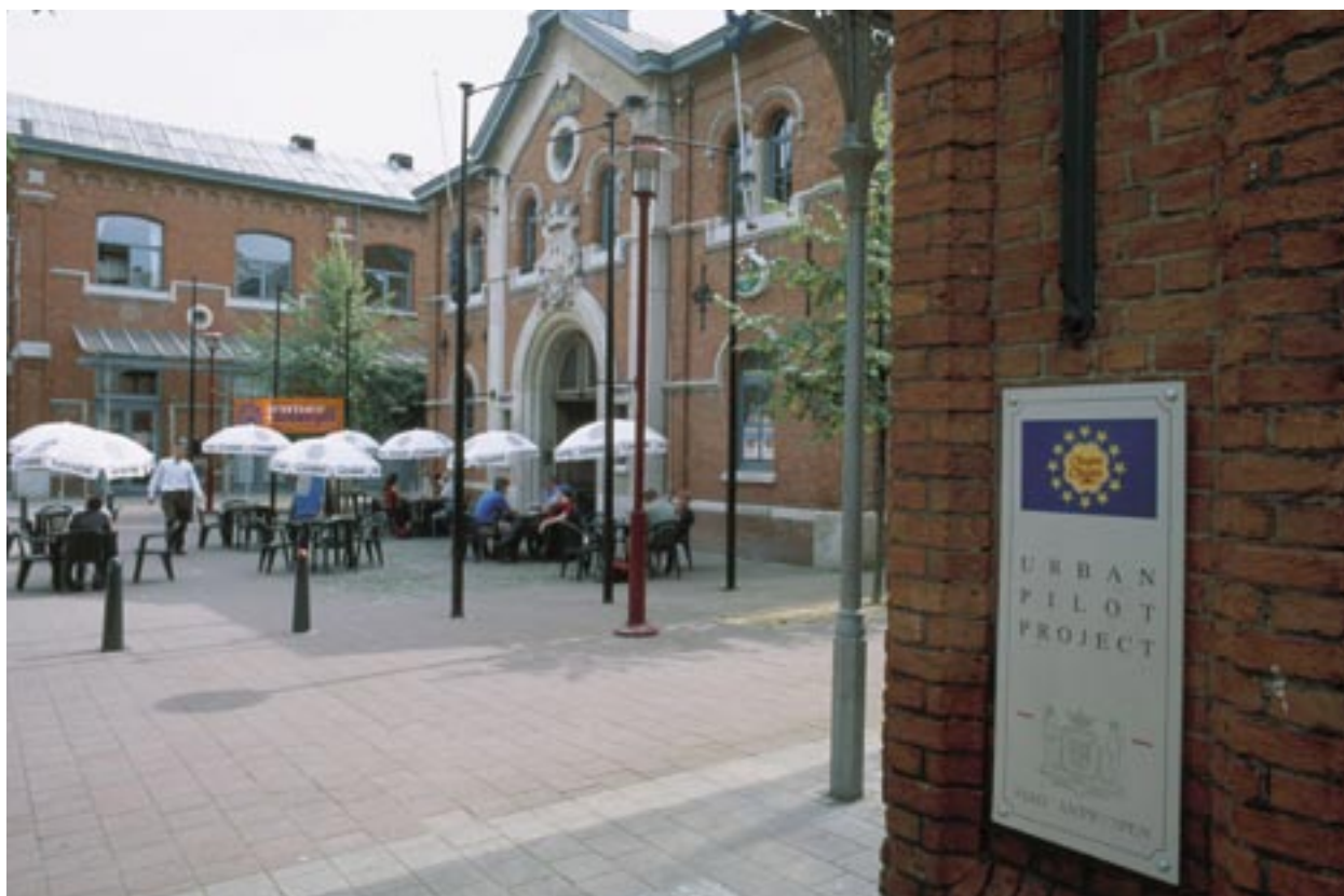
NOA centre Antverpene (Belgija) teikiamos paslaugos 15 mažų įmonių ir veikia kavinė aplinkiniams gyventojams

Kartu dirbant nacionaliniams ir regioniniams komunikacijos ekspertams veiksmingiau informuojama apie struktūrinius fondus, skatinama teikti daugiau ir kokybiškesnių projektų pasiūlymų ir didinamas Europos Sąjungos bei jos sanglaudos politikos žinomumas.