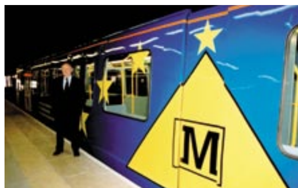
Daži jaunā Sanderlendas metro vagoni ES krāsās Anglijā.