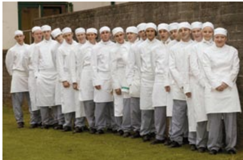
Jaunie pavāri-mācekļi ar spožu nākotni.