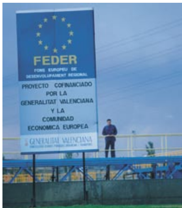
ES finansējuma veicināšana Spānijā.

tostarp arī projektu nosaukumi un piešķirtā valsts finansējuma summa katrai darbībai, tiks publicēti saskaņā ar tās pašas regulas 7.2. panta d) apakšpunktu.