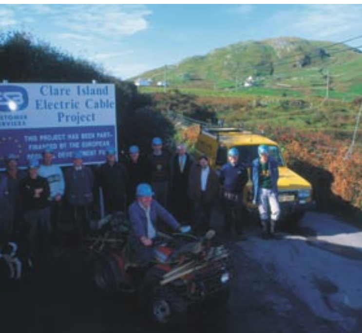
Elektrifikācija Klērailendā (Clare Island), Co. Mayo uzņēmums, Īrija.

Visi šie noteikumi ir iekļauti ilgtermiņa procesā, kas papildus efektīvākai Eiropas fondu izmantošanas sekmēšanai arī nodrošina labāku saikni starp pilsoņiem un Kopienas iestādēm un konsolidē Eiropas Savienības demokrātijas pamatus.