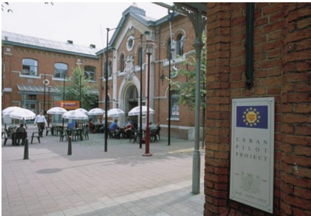
NOA centrs Antverpenē, Beļģijā, tuvākajā apkaimē sniedz pakalpojumus 15 mazajiem uzņēmumiem un vietējai kafejnīcai.

Valsts un reģionālie sabiedrisko attiecību darbinieki kopā uzlabo struktūrfondu efektivitāti, atbalsta projekta projektu pieteikumu skaitu un kvalitāti un sekmē Eiropas Savienības un tās kohēzijas politikas izplatību.