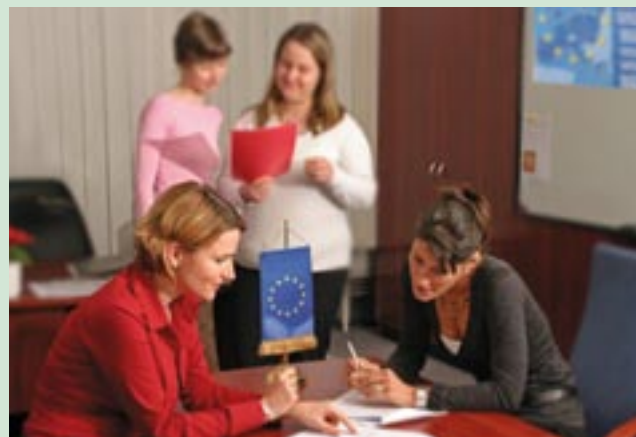
Ungārijas VAA komunikāciju grupa darbā.