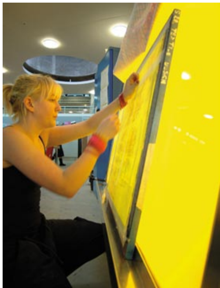
Tekstila dizains ir Kornvolas universitāšu apvienības profesija.

Kopš 2004. gada šajā programmā, strādājot 150 mazos un vidējos uzņēmumos, iesaistījušies 180 universitātes beidzēji. Aptuveni 50 % programmas dalībnieku ir no Kornvolas,