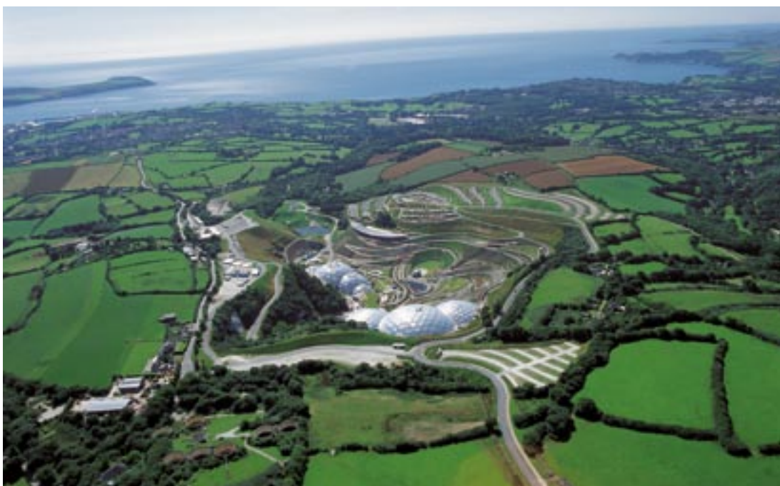
Panorāmas skats uz Paradīzes projektu pie Santostelas (St Austell).

Kornvolas un Sili salu reģions, kas piedzīvo patiesu sociāli ekonomisku atdzimšanu, laikā no 2000. līdz 2006. gadam bija 1. mērķa finansējuma saņēmēji un laikā no 2007. līdz 2013. gadam ir tiesīgi saņemt konverģences mērķa finansējumu. No krīzes situācijā nonākuša lauku reģiona, kas bija atkarīgs galvenokārt no saviem primārajiem resursiem un tūrisma, Anglijas “tumsa” apgūst uz zinātnes atziņām balstītu ekonomiku, atzīstot atklātuma, daudzveidības, jaunievedumu un kvalitātes vērtību.