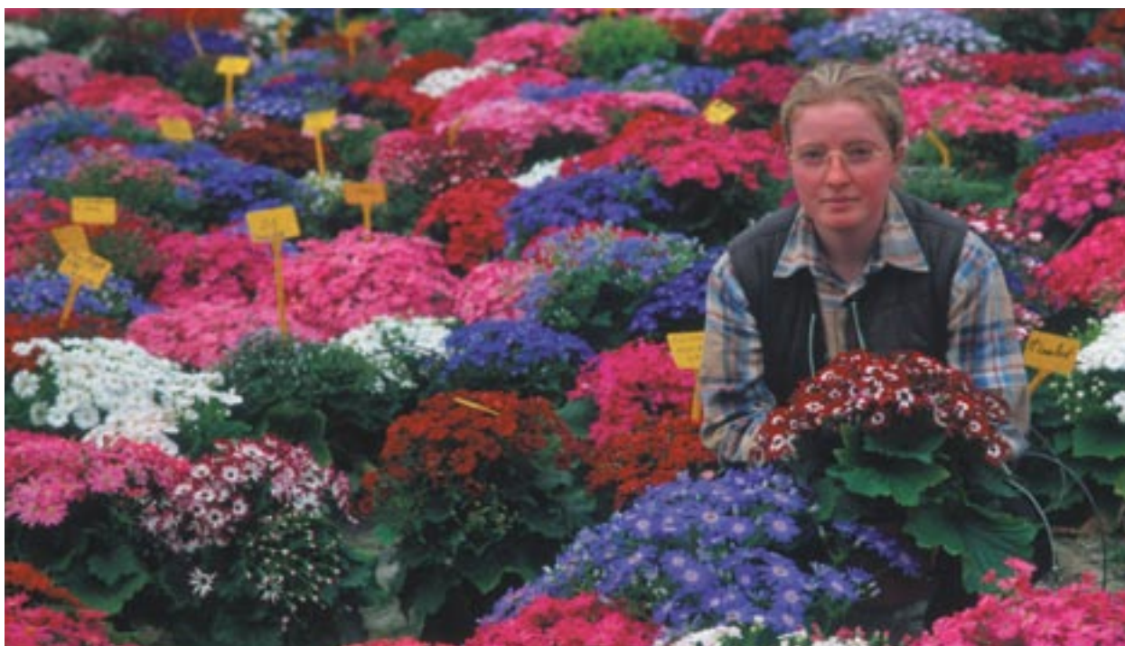
■ Dārzkopības pētniecība un attīstība, ko Beflērā (Barfleur), Lejasnormandijā (Francijā), līdzfinansē ERAF.

Kam ir paredzēti Kopienas līdzekļi? Kā sabiedrība tiek informēta par projektiem, kas tiek finansēti no struktūrfondu līdzekļiem? Kādus pasākumus Komisija ir ierosinājusi, lai nodrošinātu, ka Eiropas pilsoņi tiek informēti un sekmēti piedalīties projektu konkursos? Kāda ir Reģionālās politikas ģenerāldirektorāta loma šajā ilgtermiņa procesā?