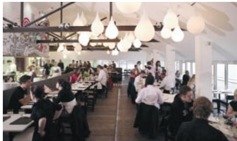
Klienti labprāt bauda Fifteen virtuves piedāvātās maltītes.

ir tikai labākais paraugs nodarbinātības veicināšanas projektu virknē, kuri saņēmuši līdzfinansējumu atbilstīgi 1. mērķim: 12 miljoni euro sākuma kapitāla šajā jomā kopumā ļāva sniegt palīdzību 12 000 cilvēku, integrējot darba tirgū 4 500 cilvēkus un organizējot mācības vairāk nekā 3 100 darba meklētājiem.