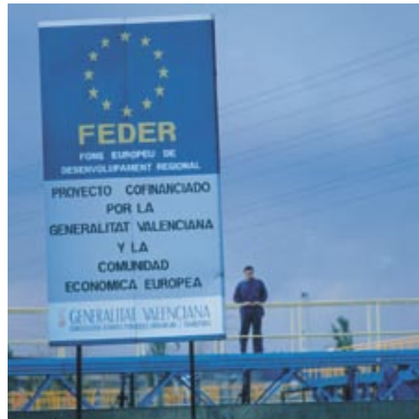
EU-financiering in Spanje.

den moeten meedelen dat het aanvaarden van financiële hulp ook betekent dat zij ermee instemmen te worden opgenomen in de lijst van begunstigden. De lijsten, die ook de projectnamen en het bedrag van de overheidsfinanciering bevatten dat aan elke operatie wordt toegekend, zullen worden gepubliceerd conform artikel 7.2.d van die verordening.