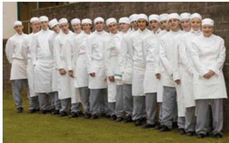
Jonge chefkoks-in-spe met een schitterende toekomst.