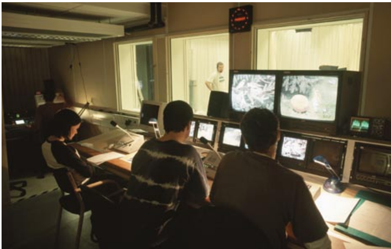
Onderwijs in digitale technologie: televisieproductie leren in Västernorrland, Zweden.

uitgevoerd is de Europese Commissie van plan alle partijen te ontmoeten die betrokken zijn bij de uitvoering van de operationele programma's, met inbegrip van begunstigden.