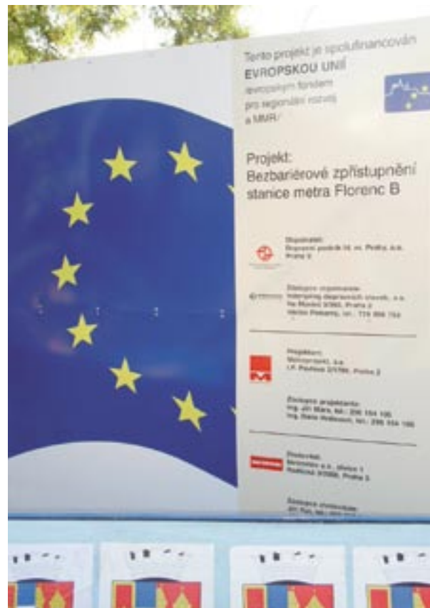
Uithangbord dat informatie geeft over de bouw van een nieuw metrostation in Praag, Tsjechische Republiek.

Een conferentie, „ Telling the story — Cohesion Policy for Growth and Jobs ”, aangaande voorlichting en publiciteit over de structuurfondsen, zal op 26-27 november 2007 plaatsvinden in Brussel. De doelstelling ervan is het aantrekken van voorlichtingsambtenaren uit alle operationele programma's. Er worden 400 tot 500 deelnemers verwacht. Het evenement zal dienen als een open markt voor de presentatie van verschillende communicatiebenaderingen en zal verscheidene kansen tot netwerking bieden.