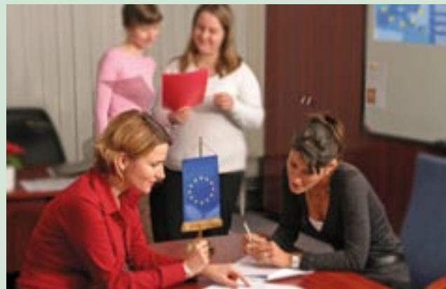
Het Hongaarse NDA-communicatieteam aan het werk.

Contactpersoon: szucs.judit@meh.hu ( www.nfh.hu )