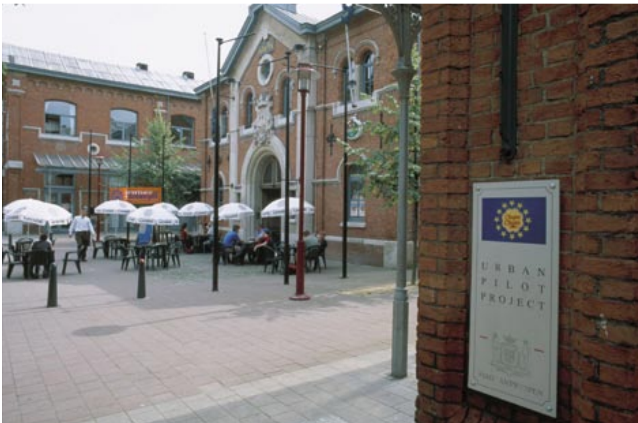
NOA Bedrijvencentrum in Antwerpen, België, verleent diensten aan 15 kleine bedrijven. Er is ook een taverne voor de buurtbewoners.

Nationale en regionale communicatiedeskundigen, samengebracht om de doeltreffendheid van de communicatie van de structuurfondsen te verbeteren, voeren het aantal en de kwaliteit van projectvoorstellen op en maken de bevolking meer bewust over de Europese Unie en haar cohesiebeleid.