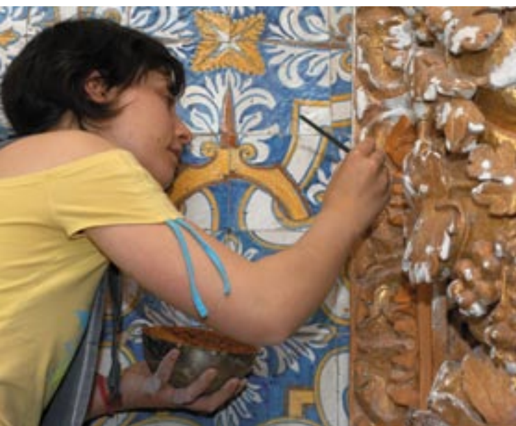
Restauratie van een Romaans fresco in de Sousavallei, Portugal.

Deze drie elementen werden opgenomen in het groenboek ( 1 ), dat op 3 mei 2006 door de Commissie werd goedgekeurd. Het centrale thema van dit document is zoeken naar standpunten en voorstellen over het opstellen van een agenda voor een Europees communicatiebeleid. Deze benadering stemt overeen met de redenering achter „ Plan D voor democratie, dialoog en debat ” dat de Commissie op 13 oktober 2005 lanceerde om de actieve deelname van burgers in het debat over Europa aan te moedigen. Plan D is het eerste stadium in een langetermijnproces dat bedoeld is om de democratische grondvesten van de Europese Unie te versterken en ze te wortelen in de waarden en verwachtingen van haar burgers.