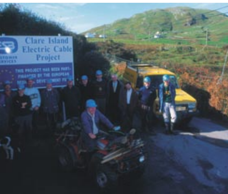
Elektrisering van Clare Island, graafschap Mayo, Ierland.