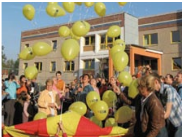
Opening van een crèche in het Urban II-gebied Leipzig, Duitsland.