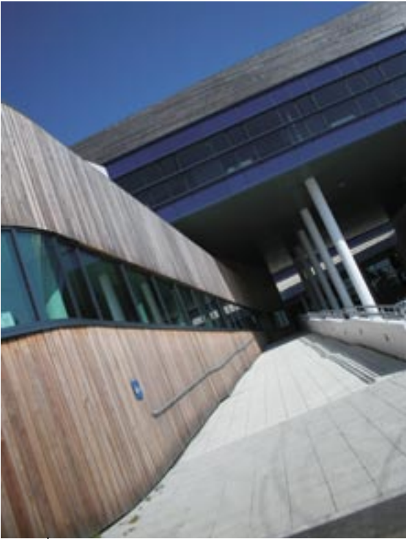
De architectuur van de Campus Hub in Tremough combineert moderniteit en traditionele materialen.

deerden, en profiteert het van een doelstelling 1-subsidie van 8 000 EUR. Met dat geld kan het de afgestudeerden een redelijk loon van minstens 24 000 EUR per jaar betalen, wat zeer goed is voor dit gebied. Aan de universiteit verlenen wij bijstand tijdens de hele plaatsing."