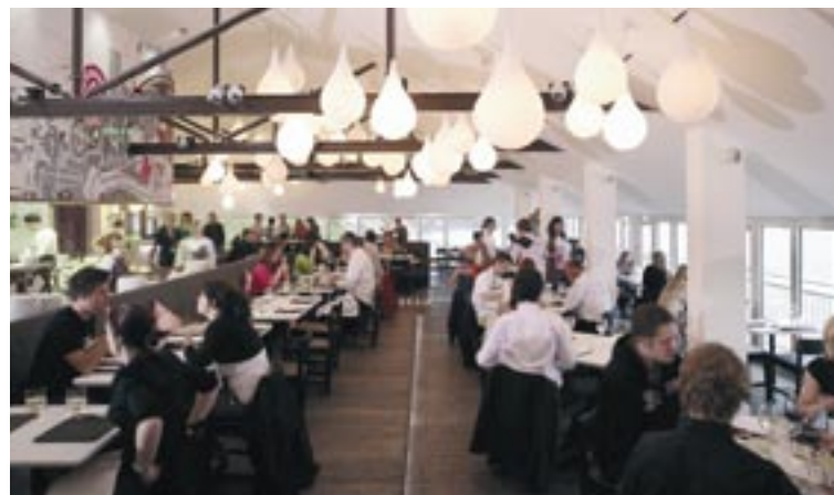
Klanten genieten van de haute cuisine in restaurant Fifteen.

hen werden toegelaten tot het college en 20 mensen namen uiteindelijk deel aan de plaatsing.” Voor Jacki is Fifteen Cornwall echter slechts het vlaggenschip van een reeks tewerkstellingsprojecten gefinancierd in het kader van doelstelling 1: dankzij de 12 miljoen EUR startkapitaal in dit gebied konden 12 000 mensen bijstand genieten, werden 4 500 mensen geïntegreerd op de arbeidsmarkt en kregen meer dan 3 100 werkzoekenden een opleiding.