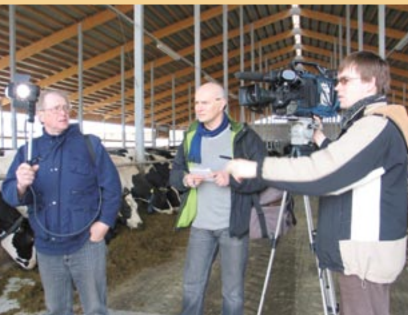
Filmen van een verslag over een Letse boerderij.

Beide programma's kunnen op uitstekende kijkcijfers bogen. Toen het in 2005 van start ging, bereikte het radioprogramma 10 % van alle radioluisteraars, of 45 000 mensen. Tegen eind 2006 bereikte het 7,3 %, of 35 400 radioluisteraars. Het televisieprogramma bereikte 25 % van de televisiekijkers in 2005 en deed het daarna nog beter: 33 %, of 230 000 kijkers in 2006. Tegen eind 2006 waren er in totaal 99 radioprogramma's en 41 televisieprogramma's uitgezonden op de nationale televisie en radio. Iedereen kan een eindje meerijden met de Eurobus , of de Sleutels tot de Europese fondsen omdraaien op de website van EU-financiering: www.esfondi.lv . Daarvoor moeten ze op de vlag „TV en radio”, rechts op de pagina, klikken http://www.esfondi.lv/page.php?id=698 .