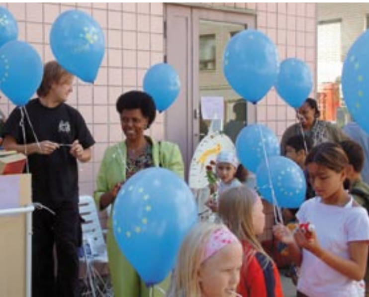
Ouders en kinderen in het nieuwe gezinscentrum voor immigranten in Vantaa, Finland.

Het doel van het nieuwe communautaire netwerk, Inform, dat SFIT vervangt, is het samenbrengen van communicatie-ambtenaren uit alle operationele programma's in het kader van het EFRO en het Cohesiefonds. De voornaamste doelstellingen zijn het delen van ervaring en het identificeren van manieren om de kwaliteit van communicatieactiviteiten te verbeteren, potentiële begunstigden en de bevolking meer bewust te maken van de voordelen van interventies van de Gemeenschap, en de zichtbaarheid van door de EU gefinancierde projecten te vergroten. De voorgestelde prioritaire thema's voor de periode 2007-2013 zijn: