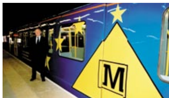
Verscheidene rijtuigen van de metro in Sunderland, Engeland, zijn geschilderd in de EU-kleuren.

Contactpersoon: aurora.tranescu@mfinante.ro