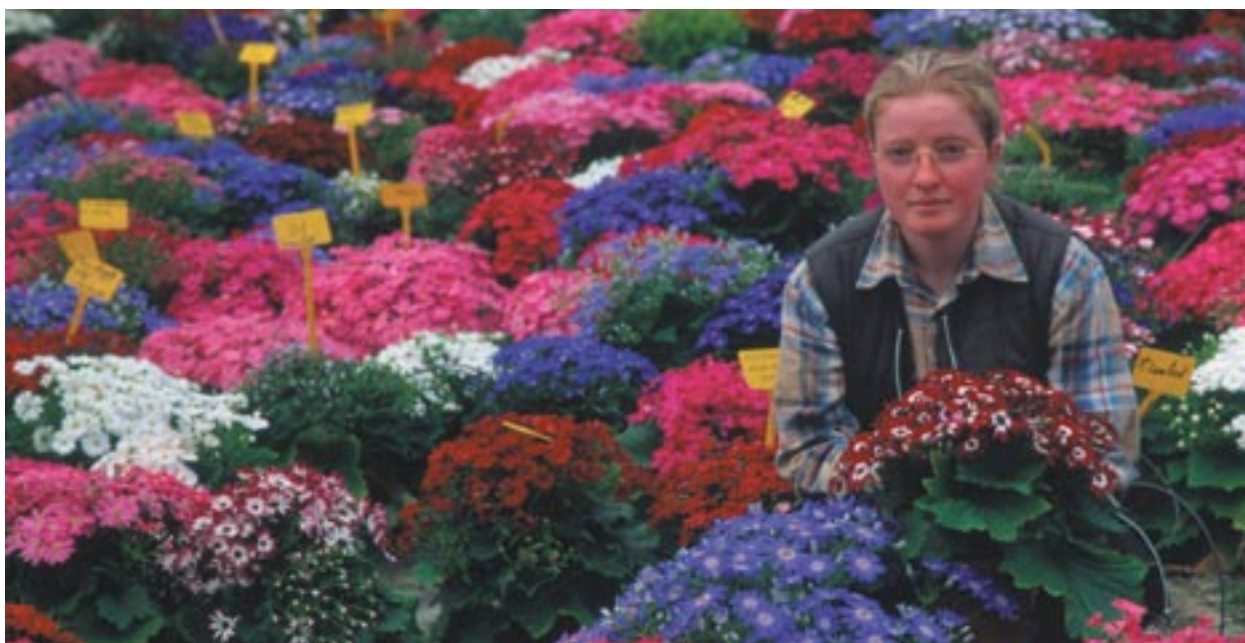
Onderzoek en ontwikkeling in de tuinbouw, gefinancierd door het EFRO in Barfleur, Laag-Normandië, Frankrijk.

Voor wie zijn de communautaire fondsen bestemd? Hoe wordt de bevolking geïnformeerd over projecten die zijn gefinancierd door de structuurfondsen? Welke maatregelen heeft de Commissie voorgesteld om ervoor te zorgen dat de Europese burgers worden geraadpleegd en aangemoedigd om deel te nemen? Wat is de rol van het directoraat-generaal Regionaal beleid in dit langetermijnproces?