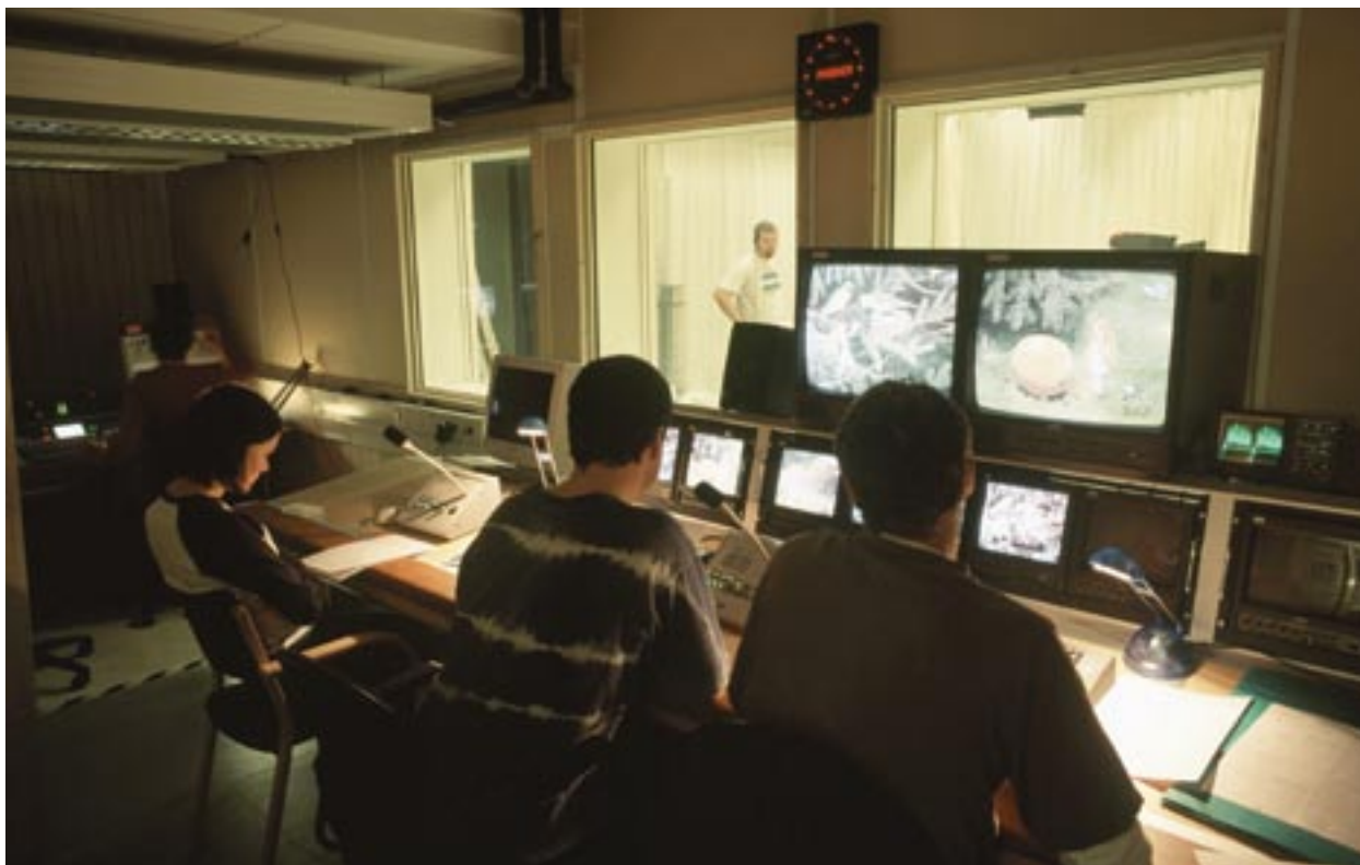
Wykształcenie w zakresie technologii cyfrowych: nauka produkcji telewizyjnej w Västernorrland, Szwecja.

prawnych, Komisja Europejska zamierza doprowadzić do zaangażowania wszystkich stron w realizację programów operacyjnych, włączając w to beneficjentów.