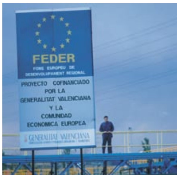
Promowanie funduszy unijnych w Hiszpanii.

że jednostki zarządzające muszą informować potencjalnych beneficjentów o tym, że przyjęcie pomocy finansowej wiąże się również ze zgodą na umieszczenie ich na liście beneficjentów. Listy, zawierające również nazwę projektów oraz wysokość pomocy publicznej przyznanej na każdą operację, będą publikowane zgodnie z art. 7 ust. 2. lit. d) tego samego rozporządzenia.