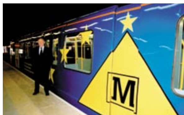
Niektóre wagony nowego metra Sunderland, w Anglii, wykorzystują kolory UE.