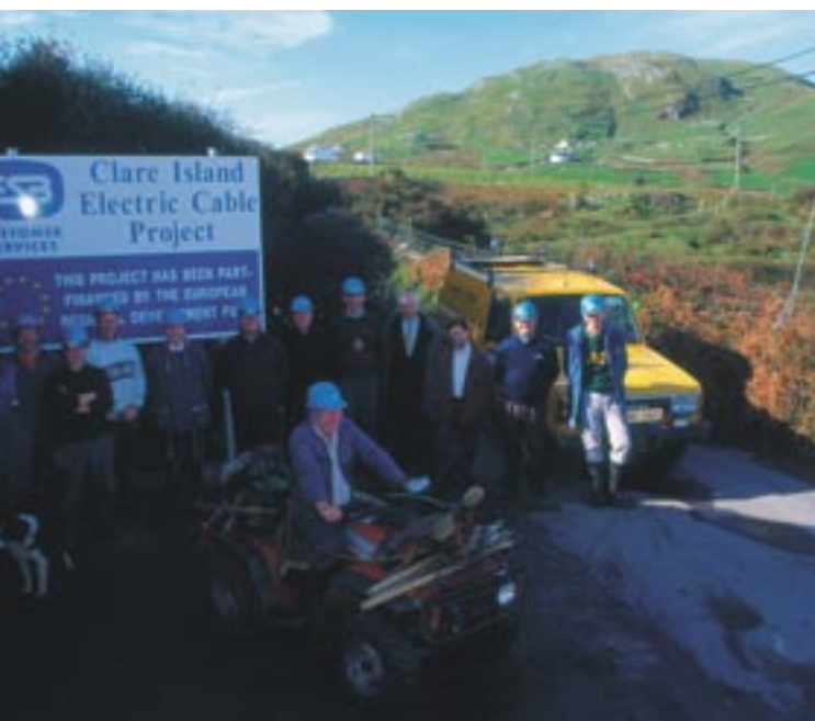
Elektryfikacja Wyspy Clare, Co. Mayo, Irlandia.

Wszystkie te przepisy stanowią część długofalowego procesu, który oprócz przyczyniania się do bardziej efektywnego wykorzystania funduszy unijnych dąży również do ściślejszego powiązania obywateli z instytucjami wspólnotowymi i skonsolidowania demokratycznych fundamentów Unii Europejskiej.