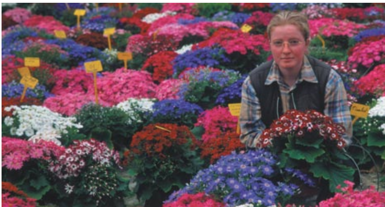
Ośrodek badań i rozwoju w dziedzinie sadownictwa współfinansowany ze środków EFRR w Barfleur, Dolna Normandia, Francja.

Komu przyznawane są fundusze unijne? W jaki sposób społeczeństwo jest informowane o projektach finansowanych z funduszy strukturalnych? Jakie działania przewiduje Komisja w celu ułatwienia konsultacji publicznych, które zachęcają obywateli Unii do aktywnego uczestnictwa? Jaką rolę w tym długofalowym procesie odgrywa Dyrekcja Generalna ds. Polityki Regionalnej?