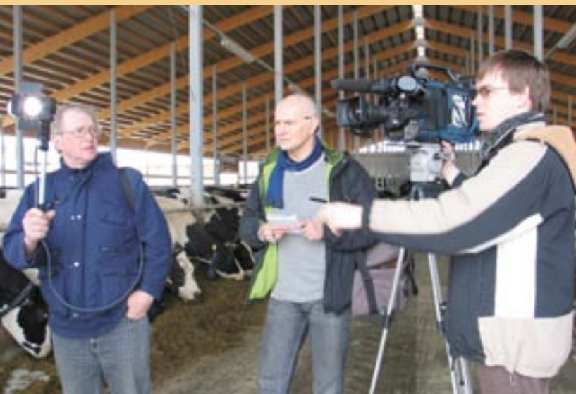
■ Kręcenie reportażu na temat łotewskiej farmy.

Oba programy mają świetne notowania. Na samym początku, w 2005 r., program radiowy zyskał 10% wszystkich słuchaczy, czyli 45 tysięcy osób, natomiast pod koniec 2006 r. liczba ta spadła do 7,3%, czyli 35 400 słuchaczy. Poziom oglądalności programu telewizyjnego sięgnął 25% w 2005 r. i w 2006 r. zwiększył się nawet do 33%, czyli do 230 tysięcy widzów. Pod koniec 2006 r. publiczna telewizja i radio nadały w sumie 99 audycji radiowych i 41 programów telewizyjnych. Każdy może dołączyć do ekscytującej podróży Eurobusu lub użyć „Kluczy do funduszy europejskich” na stronie internetowej funduszy UE: www.esfondi.lv , klikając na baner telewizyjny i radiowy znajdujący się w prawym rogu strony http://www.esfondi.lv/page.php?id=698 .