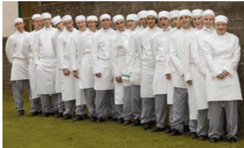
Młodzi adepci sztuki kucharskiej ze świetlaną przyszłością.