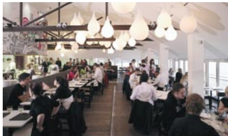
Klienci doceniają wyrafinowaną kuchnię w restauracji Fifteen.