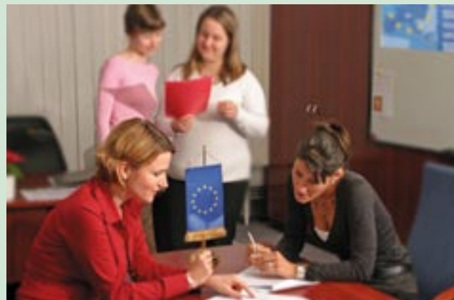
Węgierski zespół NAR ds. komunikacji przy pracy.