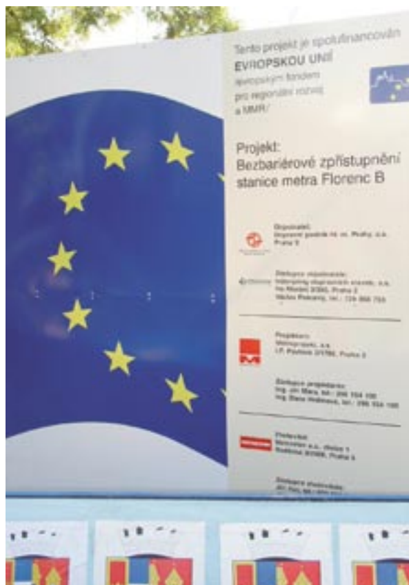
Tablica promująca budowę nowej stacji metra w Pradze, Republika Czeska.

W dniach 26–27 listopada 2007 r. odbędzie się w Brukseli konferencja „ Telling the story – Cohesion Policy for Growth and Jobs ” („Opowiedz swoją historię – polityka spójności na rzecz wzrostu i zatrudnienia”) na temat informacji i promocji dotyczącej funduszy strukturalnych. Jej celem jest doprowadzenie do spotkania specjalistów ds. komunikacji ze wszystkich programów operacyjnych. Przewiduje się, że na konferencję przybędzie od 400 do 500 uczestników. Konferencja ta będzie okazją do przedstawienia różnych rozwiązań komunikacyjnych oraz zaoferowania różnych możliwości współpracy.