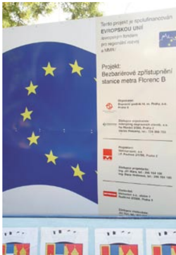
Znaková reklama výstavby novej stanice metra v Prahe, Česká republika.

26. – 27. novembra 2007 sa v Bruseli uskutočnila konferencia pod názvom „ Rozprávanie príbehu – Politika súdržnosti pre rast a zamestnanosť “, na tému informácií a propagácie štrukturálnych fondov. Jej cieľom je dosiahnuť účasť referentov pre komunikáciu zo všetkých operačných programov. Možno očakávať 400 až 500 účastníkov. Udalosť posluží ako otvorený trh na prezentáciu rôznych komunikačných prístupov a poskytne množstvo príležitostí na networking.