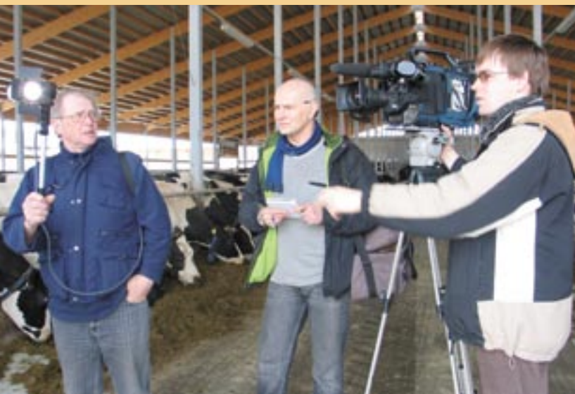
Filmovanie dokumentu o lotyšskej farme.

Oba programy majú vynikajúcu sledovanosť. Keď rozhlasový program začínal v roku 2005, počúvalo ho 10 % všetkých rozhlasových poslucháčov, čiže 45 000 ľudí. Do konca roku 2006 podiel dosiahol 7,3 %, čiže 35 400 rozhlasových poslucháčov. Televízny program v roku 2005 sledovalo 25 % televíznych divákov a v roku 2006 stúpol na 33 %, čiže 230 000 divákov. Do konca roku 2006 sa vysielalo celkom 99 rozhlasových a 41 televíznych programov v štátnej televízii a rozhlase. Pripojiť sa ku vzrušujúcej jazde Eurobusu alebo otočiť kľúčmi k európskym fondom môže ktokoľvek na stránke o financovaní EÚ: www.esfondi.lv . Stačí kliknúť na televíznu alebo rozhlasovú reklamu na pravej strane stránky http://www.esfondi.lv/page.php?id=698 .