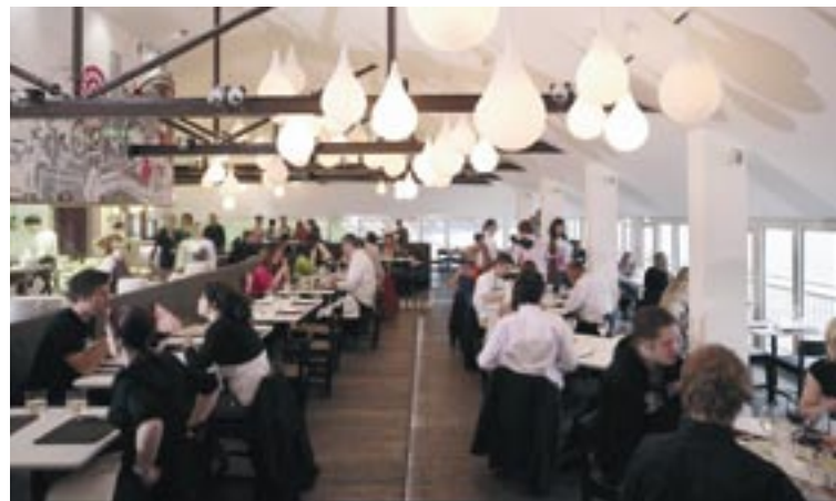
Zákazníci si vychutnávajú haute cuisine vo Fifteen.

70, akadémia prijala 32 a na samotnom projekte sa zúčastnilo 20 ľudí.“ Pre Jacki je však Fifteen Cornwall iba vlajkovou loďou celej škály projektov zvyšovania zamestnanosti, ktoré boli spolufinancované v rámci Cieľa 1: 12 miliónov EUR zárodkového kapitálu v tejto oblasti umožnilo pomoc pre 12 000 ľudí, integráciu 4 500 ľudí na trhu práce a školenie pre viac ako 3 100 ľudí, ktorí hľadajú prácu.