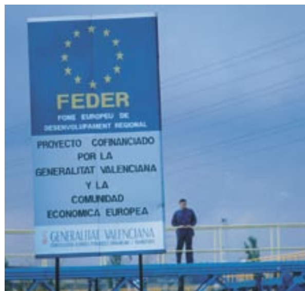
Podporovanie financovania z EÚ v Španielsku.

pomoci musia súhlasiť s tým, že budú uvedení v zozname príjemcov. Zoznamy budú obsahovať názvy projektov a čiastky poskytnutej verejnej finančnej podpory na každú operáciu. Zoznamy sa budú zverejňovať v súlade s článkom 7.2.(d) toho istého nariadenia.