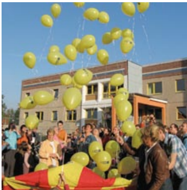
Otvorenie jaslí v lipskej oblasti URBAN II, Nemecko.