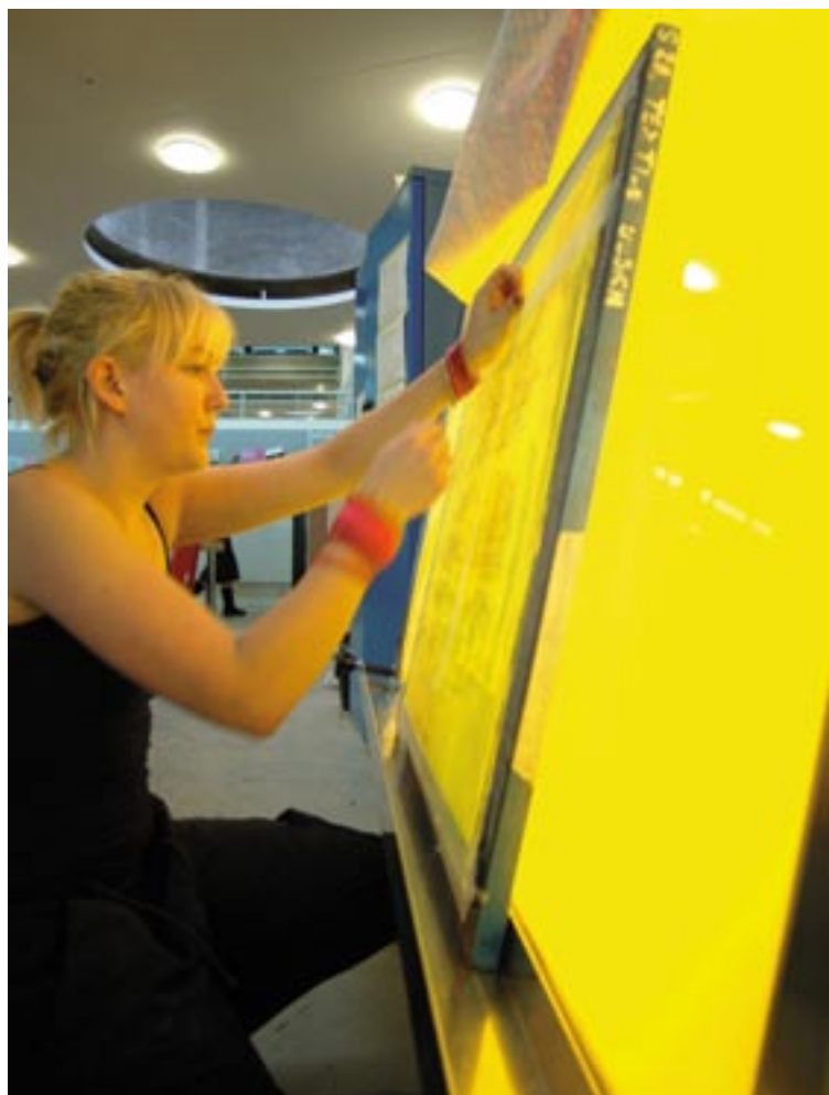
Textilný dizajn je špecialitou CUC.