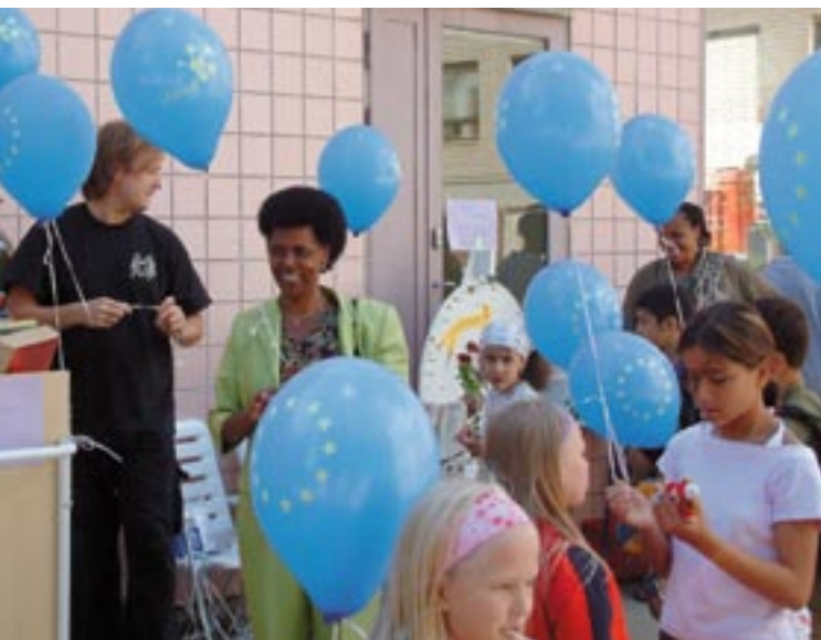
Rodičia a deti v novom rodinnom centre pre imigrantov vo Vantaa, Fínsko.

Nová sieť Spoločenstiev INFORM, ktorá nahrádza SFIT, sa zameriava na spoluprácu referentov pre komunikáciu zo všetkých operačných programov v rámci EFRR a Kohézneho fondu. Medzi hlavné ciele patrí zdieľanie skúseností a identifikácia spôsobov zlepšenia kvality komunikačných aktivít, zvyšovanie informovanosti o prínosoch intervencií Spoločenstiev u potenciálnych príjemcov a širokej verejnosti, ako aj zlepšenie viditeľnosti projektov financovaných z EÚ. Na obdobie 2007 – 2013 sú navrhnuté tieto prioritné témy: