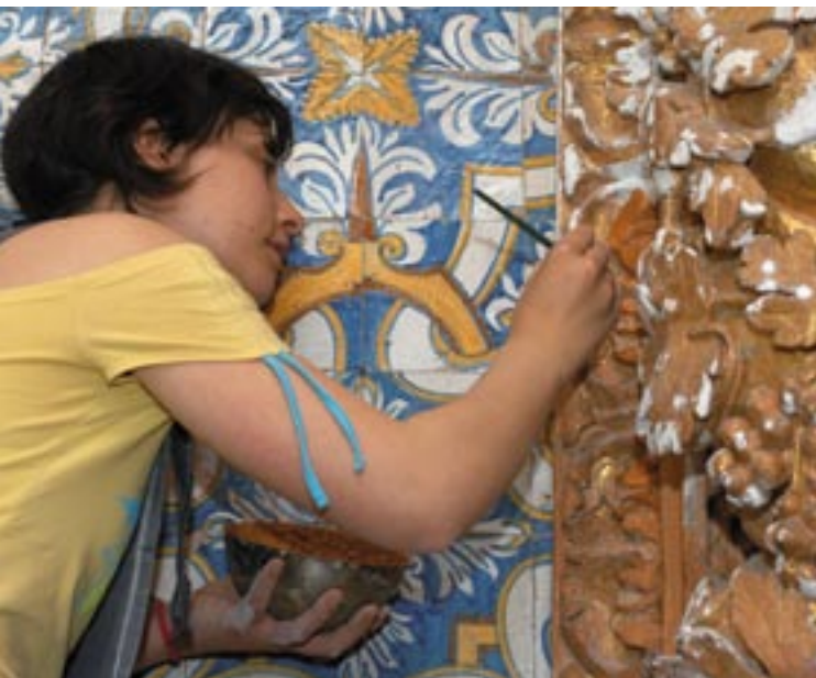
Zreštaurovanie románskej fresky v Sousa valley, Portugalsko.

Uvedené tri prvky boli potvrdené v Zelenej knihe , ktorú prijala Komisia 3. mája 2006. Hlavnou témou tohto dokumentu je hľadanie názorov a návrhov na zriadenie agendy európskej komunikačnej politiky. Tento prístup je v súlade s úvahami o „ Pláne D pre demokraciu, dialóg a debatu “, ktorý Komisia začala realizovať 13. októbra 2005, s cieľom podporiť aktívnu účasť občanov na diskusii o Európe. Plán D je prvým stupňom dlhodobého procesu zameraného na konsolidáciu demokratických základov Európskej únie a ich prenos do hodnôt a očakávaní jej občanov.