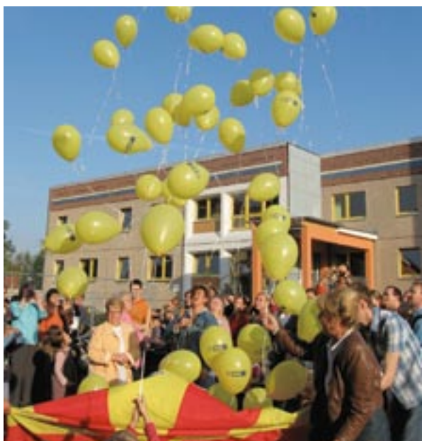
Otvoritev otroških jasl v Leipzigu po programu pobude URBAN II, Nemčija.