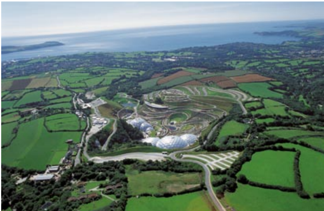
Panoramski pogled na prizorišče „Eden Project“ v bližini St. Austella.

Regija Cornwall and Isles of Scilly, ki je v obdobju 2000–2006 koristila sredstva v okviru Cilja 1, v obdobju 2007–2013 pa je upravičena do financiranja v okviru cilja „konvergenca“, doživlja obdobje družbenega in gospodarskega preporoda. Cornwall, ki mu pravijo tudi „angleški Finistere“ oziroma „konec sveta“, se je iz podeželske regije v krizi, ki je bila v glavnem odvisna od primarnih virov in turizma, prelevil v ekonomijo znanja. Nove regionalne vrednote so odprtost, raznolikost, inovativnost in kakovost.