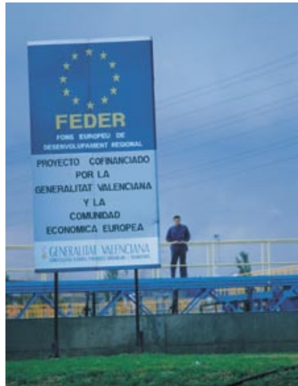
Spodbujanje financiranja s sredstvi EU v Španiji.

Vsi ukrepi so del dolgoročnega procesa, ki prispeva k učinkovitejši izrabi evropskih sredstev, poleg tega pa si prizadeva za tesnejšo povezanost državljanov z institucijami Skupnosti in za utrjevanje demokratičnih temeljev Evropske unije.