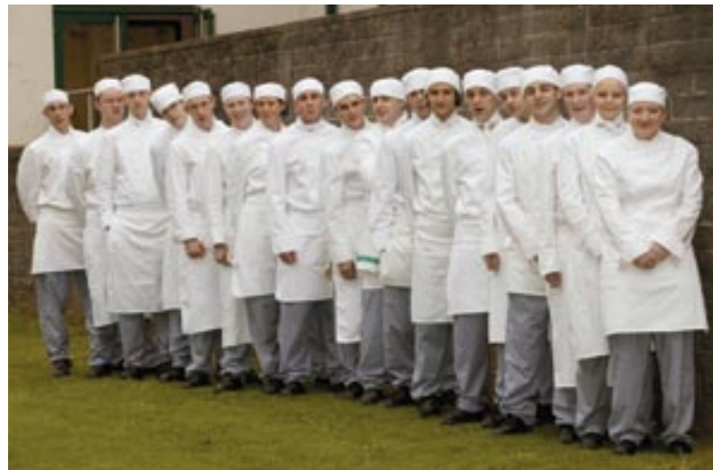
Bodoči kuharski mojstri s svetlo prihodnostjo.