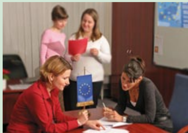
Madžarska komunikacijska skupina NDA pri delu.