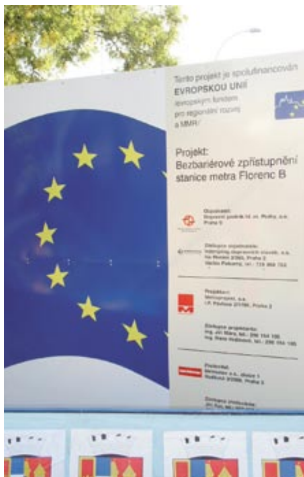
Znak, ki oglašuje gradnjo nove postaje podzemne železnice v Pragi, Češka.

26. in 27. novembra bo v Bruslju potekala konferenca „ Povej mi zgodbo – kohezijska politika za rast in zaposlovanje “ na temo informiranja in obveščanja o strukturnih skladih. Konferenca želi privabiti odgovorne za obveščanje iz vseh operativnih programov. Pričakujejo, da se bo konference udeležilo med štiristo in petsto sodelujočih. Prireditelj bo tudi sejem predstavitev različnih pristopov na področju obveščanja, veliko pa bo tudi priložnosti za vzpostavljanje novih omrežij.