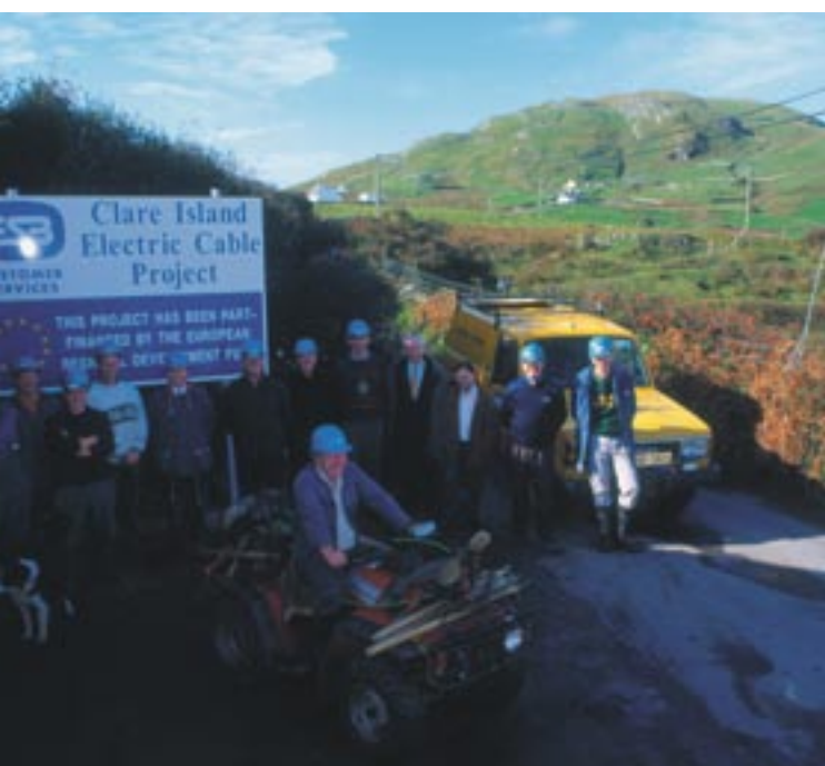
Elektrifikacija otoka Clare, Co. Mayo, Irska.

Vsi ukrepi so del dolgoročnega procesa, ki prispeva k učinkovitejši izrabi evropskih sredstev, poleg tega pa si prizadeva za tesnejšo povezanost državljanov z institucijami Skupnosti in za utrjevanje demokratičnih temeljev Evropske unije.