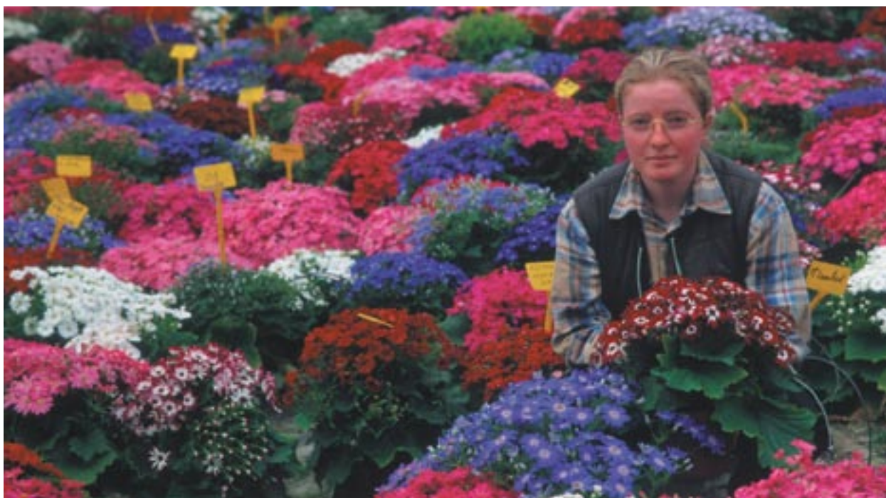
Raziskave in razvoj na področju hortikulture, sofinancirano iz Evropskega sklada za regionalni razvoj (ESRR), Barfleur, Spodnja Normandija, Francija.

Komu je namenjena pomoč iz skladov Skupnosti? Kako je javnost obveščena o projektih, ki jih financirajo strukturni skladi? Kakšne ukrepe je predlagala Komisija, da bi zagotovila vključevanje državljanov Evrope v javne posvete in da bi jih spodbudila k sodelovanju? Kakšna je vloga Generalnega direktorata za regionalno politiko v tem procesu?