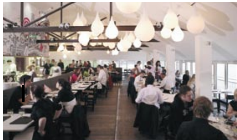
Gosti uživajo kulinarične specialitete v restavraciji Fifteen.

štiriindvajset) smo jih sedemdeset povabili na razgovor, dvaintrideset sprejeli na srednjo šolo, dvajset pa jih je sodelovalo v programu vajeništva.“ Za Jacki pa je restavracija „Fifteen Cornwall“ le paradni konj v celi vrsti projektov podpore za zaposlovanje, ki so bili sofinancirani v okviru Cilja 1: 12 milijonov evrov zagonskega kapitala na tem področju je omogočilo pomoč za 12 000 ljudi, vključevanje 4 500 ljudi na trg dela in usposabljanje več kot 3 100 iskalcev zaposlitve.