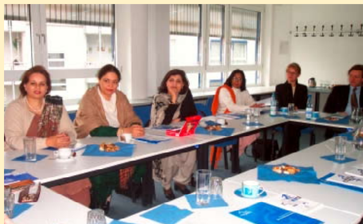
Υποδοχή Αντιπροσωπείας του Πακιστάν στο Ίδρυμα.

Για περισσότερες πληροφορίες: http://www.g-i-s-a.de