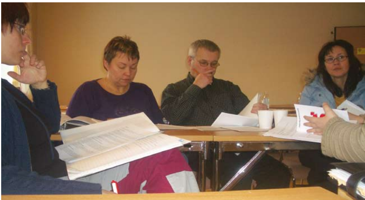
Σεμινάριο με θέμα την ισότητα των φύλων στο Strömsund.