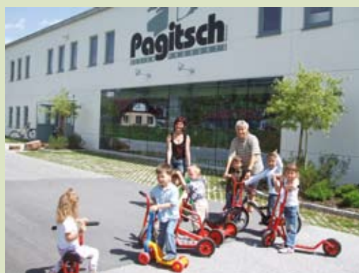
Λειτουργία βρεφονηπιακού σταθμού μέσα στην επιχείρηση.

Το πρώτο αποσκοπούσε στη στήριξη του γυναικείου πληθυσμού των περιοχών του στόχου 2. Αφορούσε την ενθάρρυνση και τη διευκόλυνση της συμμετοχής των γυναικών στο πρόγραμμα, αλλά και τη συμβολή στην εκπόνηση έργων για την ισότητα των φύλων. Η ιδέα ήταν να δημιουργηθεί ένα μηχανισμός στον οποίο θα είχαν ελεύθερη πρόσβαση οι τοπικοί φορείς, που θα μπορούσε