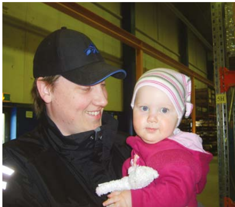
Πατέρας και παιδί απολαμβάνουν την άδεια πατρότητας.

Όσον αφορά την αναζήτηση καλύτερης ισορροπίας ανάμεσα στην επαγγελματική και την οικογενειακή ζωή στο Husqvarna, δόθηκε ιδιαίτερη προσοχή σε ένα στοιχείο της μεθόδου Know How: κίνητρο να μοιράζονται οι γονείς τη γονική άδεια σε περίπτωση γέννησης. Στη Σουηδία δεν υπάρχει η έννοια της άδειας μητρότητας: υπερέχει η έννοια της γονικής άδειας. Η άδεια αυτή είναι διάρκεια δεκαπέντε μηνών, εκ των οποίων οι δύο πρέπει να λαμβάνονται υποχρεωτικά από τον ένα ή τον άλλο γονέα. Κατά τη διάρκεια ενός έτους, το κράτος εξασφαλίζει το 80% του μισθού. Στο Tandsbyn, η Husqvarna προσθέτει επί τέσσερις μήνες το 10% αυτού του ποσού, με αποτέλεσμα το επίδομα να ανέρχεται στο 90% του μισθού, εάν η μητέρα και ο πατέρας μοιραστούν ισομερώς τη γονική άδεια.