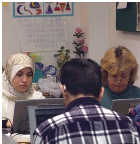
Μαθήματα εκμάθησης γλώσσας για μετανάστες στη Βιέννη (Αυστρία).

Ο Χάρτης πορείας αναγνωρίζει τη διάσταση του φύλου σε θέματα υγείας και καταπολέμησης της φτώχειας. Τα προγράμματα των Διαρθρωτικών Ταμείων μπορούν να συμβάλουν σε μεγάλο βαθμό στην ενθάρρυνση των δραστηριοτήτων περιφερειακής ανάπτυξης που λαμβάνουν υπόψη τις ανάγκες των γυναικών και των ανδρών, προωθώντας την ισότητα μεταξύ γυναικών και ανδρών στο πλαίσιο των στρατηγικών αειφόρου ανάπτυξης, τοπικής οικονομικής ανάπτυξης και αναζωογόνησης των περιοχών. Είναι γνωστό ότι οι περισσότεροι αποδέκτες κοινωνικών επιδομάτων είναι γυναίκες και οι μονογονεϊκές οικογένειες και οι μεμονωμένοι συνταξιούχοι είναι ιδιαίτερα ευάλωτοι στη φτώχεια. Ανταποκρινόμενα καλύτερα στην ανάγκη συμφιλίωσης της επαγγελματικής, ιδιωτικής και οικογενειακής ζωής, πολλά σχέδια προτείνουν πλέον την παροχή στήριξης και ευέλικτα ωράρια για την επαγγελματική κατάρτιση, παρέχοντας άμεσα υποδομές φύλαξης παιδιών και φροντίδας εξαρτώμενων ατόμων ή διευκολύνοντας την πρόσβαση σε παρόμοιες υποδομές.