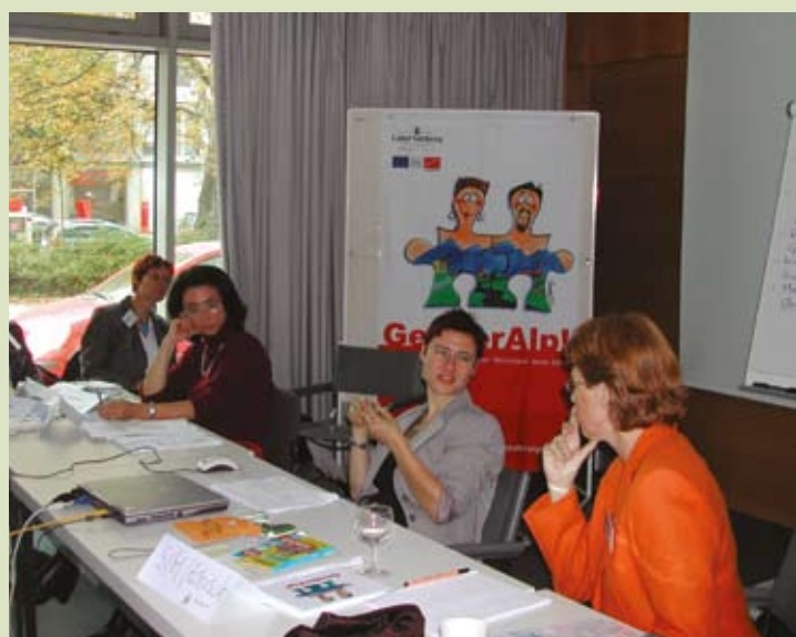
Συνεδρίαση των εταίρων του δικτύου.