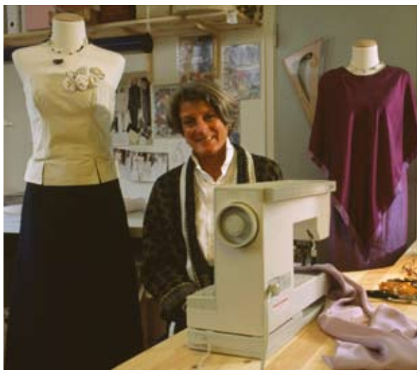
Οίκος υψηλής ραπτικής στο Frederikshavn (Δανία).

Ακόμη, ο Χάρτης πορείας επισημαίνει το χαμηλό ποσοστό γυναικών επιχειρηματιών. Ως προς αυτό, πρέπει οι διαφορετικές ανάγκες των γυναικών που δημιουργούν επιχειρήσεις και των ομολόγων τους ανδρών να λαμβάνονται υπόψη στα έργα τα οποία στηρίζουν τη δημιουργία και την ανάπτυξη των επιχειρήσεων: οι γυναίκες χρειάζονται ενδεχομένως κεφάλαιο εκκίνησης για την καλύτερη προσαρμογή των συστημάτων επιδοτήσεων και δανείων του τύπου «μικροπιστώσεις»· οι γυναίκες προτιμούν ορισμένες φορές μέτρα στήριξης και βραδινά μαθήματα ή μαθήματα το Σαββατοκύριακο για να μπορούν να συνδυάσουν τις εργασιακές με τις οικογενειακές τους ευθύνες και μερική απασχόληση.