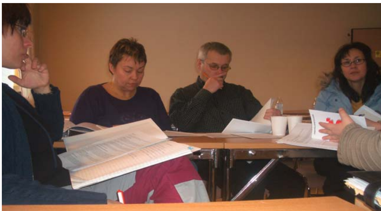
Soolise võrdõiguslikkuse seminar Strömsundis.