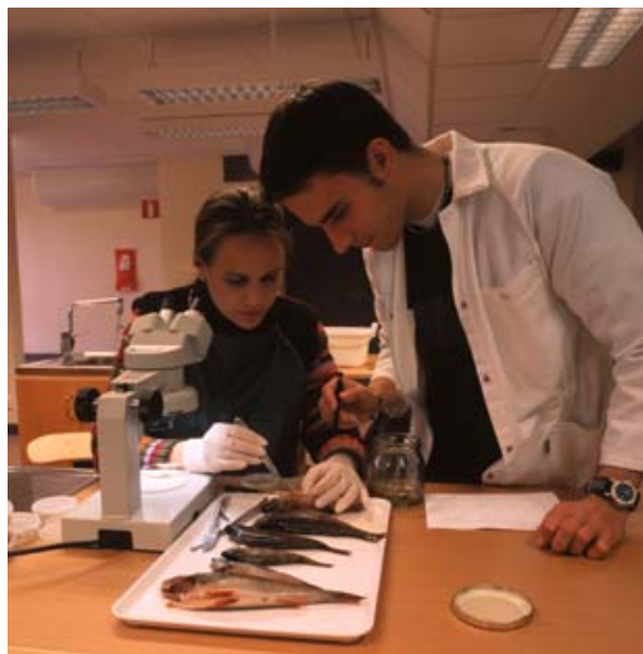
Rootsi-Lapi kalade toitumist käsitlev uurimus.

http://www.yellowwindow.be/assets/free/r-finalreport-EN.doc