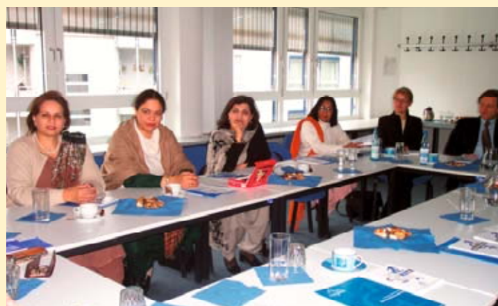
Instituudis on külas Pakistani delegatsioon.

Põhjalikum teave aadressilt: http://www.g-i-s-a.de