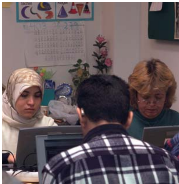
Keeletunnid sisserändajatele Viinis (Austrias).

Juhistes tunnustatakse sooküsimuse tähtsust tervishoiu ning vaesuse vastu võitlemise valdkonnas. Struktuurifondide programmide kaudu saab paljuski julgustada regionaalarengu alast tegevust, milles arvestatakse naiste ja meeste vajadustega, töstes jätkusuutliku arengu, kohaliku majandusarengu ja majanduse elavdamise strateegiate raames avalikkuse sugudevahelise võrdõiguslikkuse alast teadlikkust. On üldteada, et enamik sotsiaaltoetuste saajaid on naised ning et üksikvanemaga pered ja üksi elavad pensionärid on vaesuse seisukohast eriti haavatavad. Paljud projektid, mis võtavad varasemast enam arvesse vajadust sobitada tööd ning era- ja pereelu, pakuvad nüüd tugisüsteeme ja paindlikke koolitusaegu, tagades lapsehoiuvõimaluse ja hooldatavate isikutega tegelemise või hõlbustades nende leidmist.