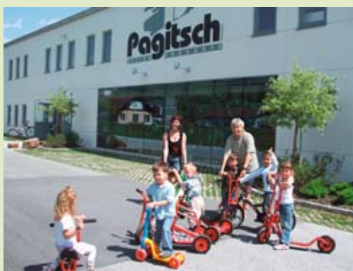
Ettevõtte juurde loodud lastesõim.

Esimese meetme eesmärgiks oli toetada eesmärgi 2 piirkondades elavaid naisi. Sihiks seati julgustada naisi programmis osalema, samuti aga aidata välja töötada soolise võrdõiguslikkusega seotud projekte. Asja idee oli luua kohalikule elanikkonnale avatud süsteem, mis aitaks ellu viia rohujuure tasandil tekkivaid algatusi. Tulemus: alates 2001.–2002. aastast tegutseb Salzburgi liidumaal kaks „soolise võrdõiguslikkuse projektijuhti“. Nende amet hõl-