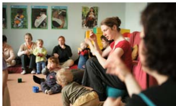
Lastesõim Leipzgis (Saksamaal).

Partnerlusele tuginev lähenemine on soolise võrdõiguslikkuse süvalaiendamise juures esmatähtis: see ühendab organisatsiooni ja üksikisikuid, kelle eesmärgiks on koguda kasulikke andmeid, tõsta kohalike elanike teadlikkust ning edendada naiste ja meeste vajaduste mõistmist, samuti aga kaotada võrdsete võimaluste tagamisega seoses ilmnevaid takistusi. Laiendamine peab olema regionaalarengus osalejatele „mõttekas“. Projektihoodjatel on vaja kvaliteetseid andmeid, et tõendada soolise võrdõiguslikkuse süvalaiendamise vajalikkust ja asjakohasust ning selgeid eeliseid, mida see võib organisatsioonidele ja projektidele pakkuda.