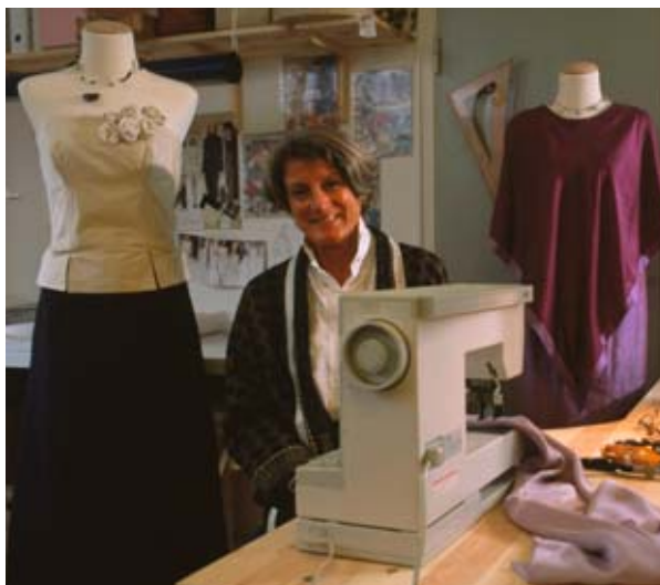
Moemaja Frederikshavn (Taanis).

Muuhulgas rõhutatakse juhistes naiste väikest osakaalu ettevõtete juhtide seas. Seoses sellega tuleb ettevõtluse arengut toetavate projektide puhul arvesse võtta ettevõtteid asutavate naiste ja meeste erinevaid vajadusi: naistel võib olla vaja algkapitali, mis tähendab, et neile sobiks enam toetus- või väikelaeenusüsteemid; samuti eelistavad naised mõnikord õhtuti või nädalavahetustel toimuvaid koolituskursusi, mis aitaksid sobitada perekondlike kohustusi ja osajaga tööd.