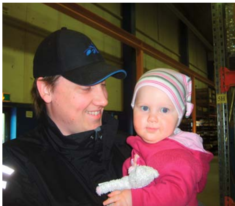
Isa ja laps tunnevad rõõmu vanemapuhkusest.

Mis aga puutub töö ja pereelu tasakaalustamisse, siis võttis Husqvarna Know How raames eriti arvesse üht aspekti: vanemaid julgustati lapse sünni korral vanemapuhkust jagama. Rootsisis nimelt ei kasutata enam emapuhkust, nüüd nimetatakse seda vanemapuhkuseks. Selle pikkus on viisteist kuud, millest kaks kuud peab üks vanematest igal juhul välja võtma. Aasta jooksul tagab riik 80% palgast. Tandsbynis lisab Husqvarna sellele nelja kuu jooksul 10%, mis teeb kokku 90% palgast, kui ema ja isa jagavad puhkuse võrdselt.