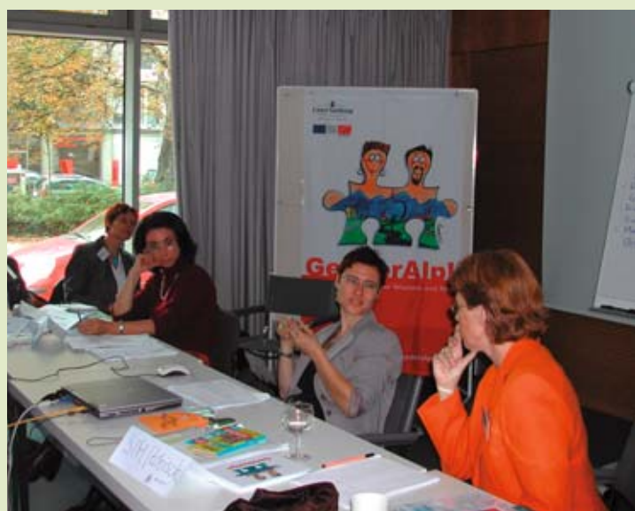
Võrgu partnerite koosolek.