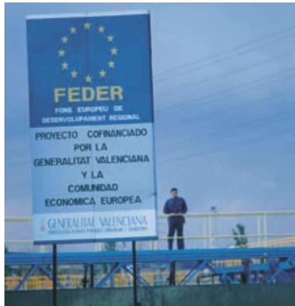
PR för EU-finansiering i Spanien.

också innebär samtycke till att de sätts upp på listan över stödmottagare. Listorna, som även redovisar projektnamnen och beloppen på de offentliga medel som ställts till förfogande för varje verksamhet, kommer att offentliggöras i enlighet med artikel 7.2 d i samma förordning.