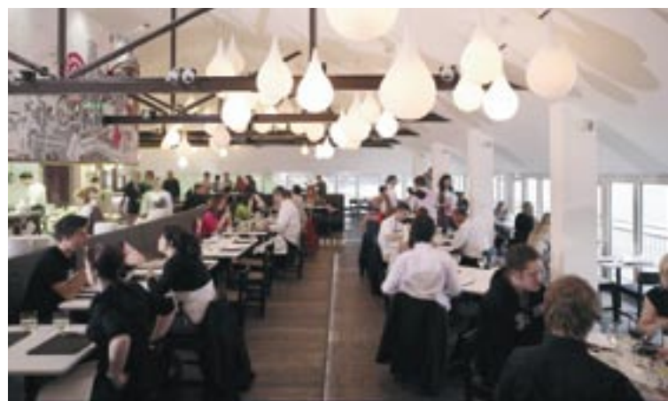
Gäster som låter sig väl smaka av haute cuisine på en Fifteen-restaurant.