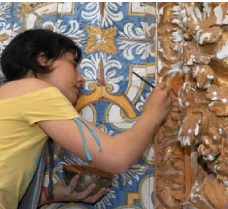
Restaurering av en romansk fresk i Sousadalen i Portugal.