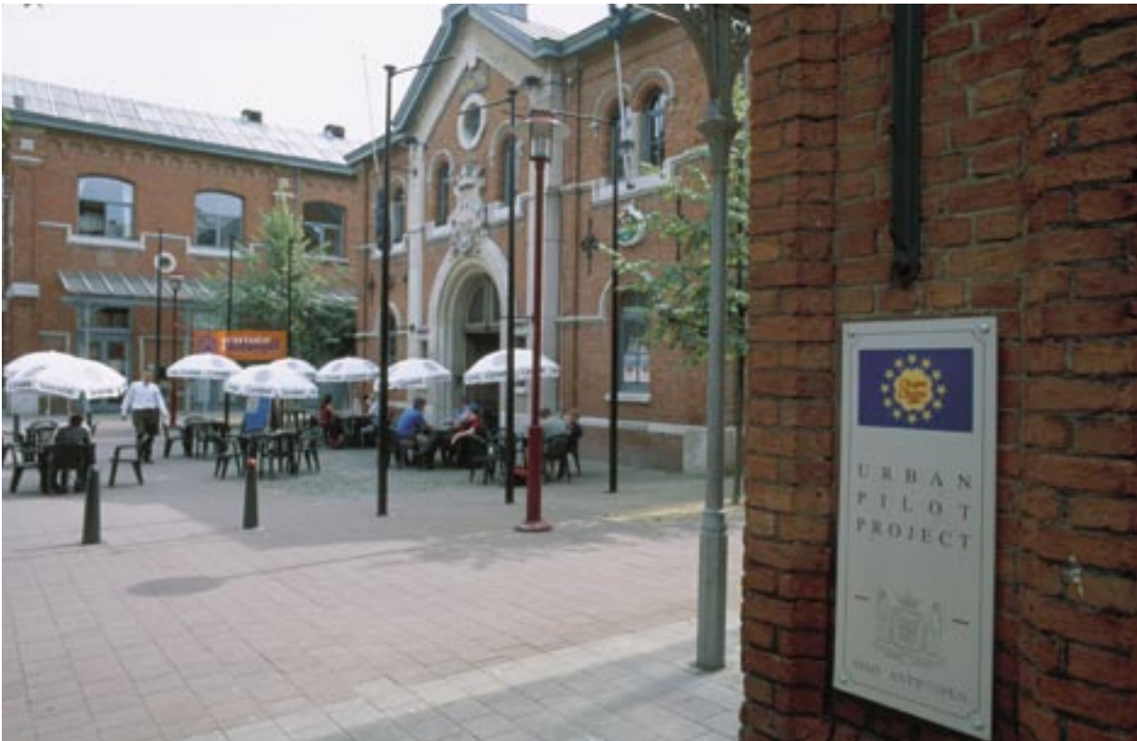
NOA-centret i Antwerpen i Belgien tillhandahåller tjänster för 15 småföretag och driver ett lokalt kafé för människorna i grannskapet.

Samverkande nationella och regionala kommunikationsexperter förbättrar effektiviteten i strukturfondernas kommunikation, ökar antalet projektförslag och höjer deras kvalitet och vidgar medvetenheten om Europeiska unionen och dess sammanhållningspolitik.