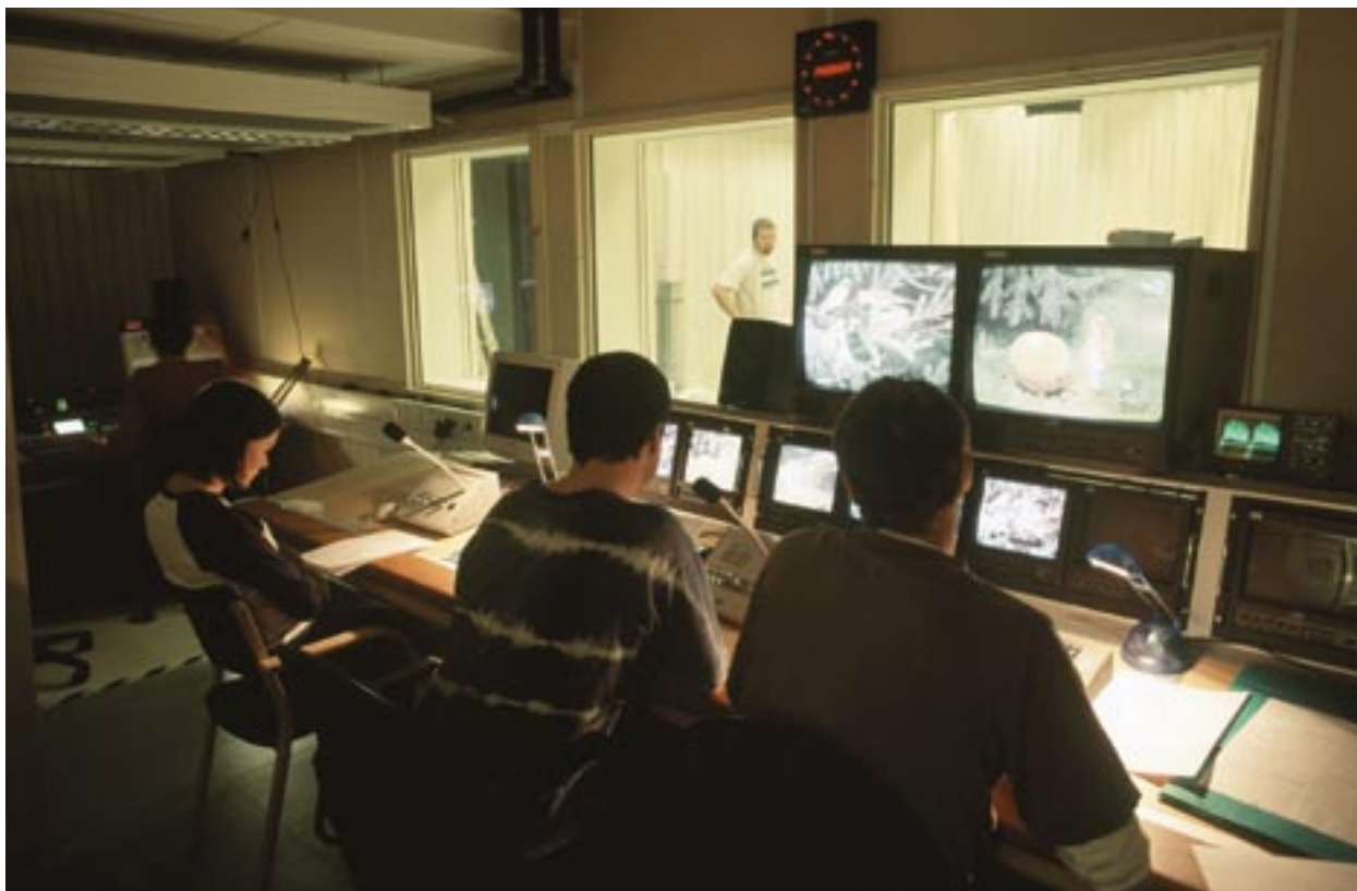
Undervisning i digital teknik: här lär man sig TV-produktion i Västernorrland i Sverige.

De nya reglerna för perioden 2007–2013 föreskriver utarbetande av en kommunikationsplan som i detalj anger de informations- och PR-åtgärder som behövs för att överbrygga potentiella klyftor. Den bör också ange vilka roller och uppgifter som var och en av de olika berörda parterna har. Inom varje förvaltningsmyndighet skall det finnas en särskilt utsedd person som skall ansvara för implementeringen av informationsåtgärderna för att förbättra utbytet av information mellan medlemsstaterna och kommissionen om informations- och PR-åtgärderna. I detta hänseende har kommissionen inrättat Inform som sammanför de tjänstemän inom förvaltningsmyndigheterna som är ansvariga för kommunikation.