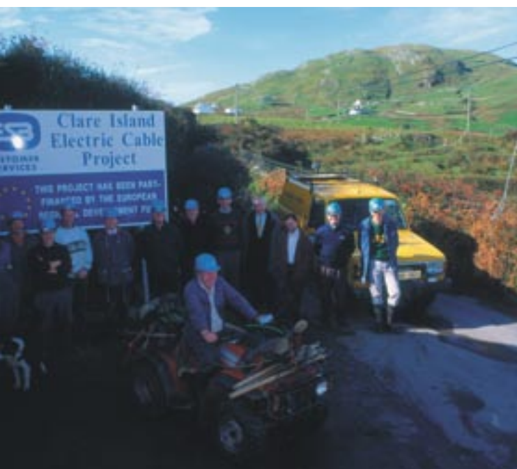
Elektrifiering av Clare Island, grevskapet Mayo, Irland.

Alla dessa åtgärder ingår i en långsiktig process som förutom att den bidrar till en effektivare användning av de europeiska fonderna även syftar till att åstadkomma bättre förbindelser mellan medborgarna och gemenskapens institutioner och till att konsolidera Europeiska unionens demokratiska grundvalar.