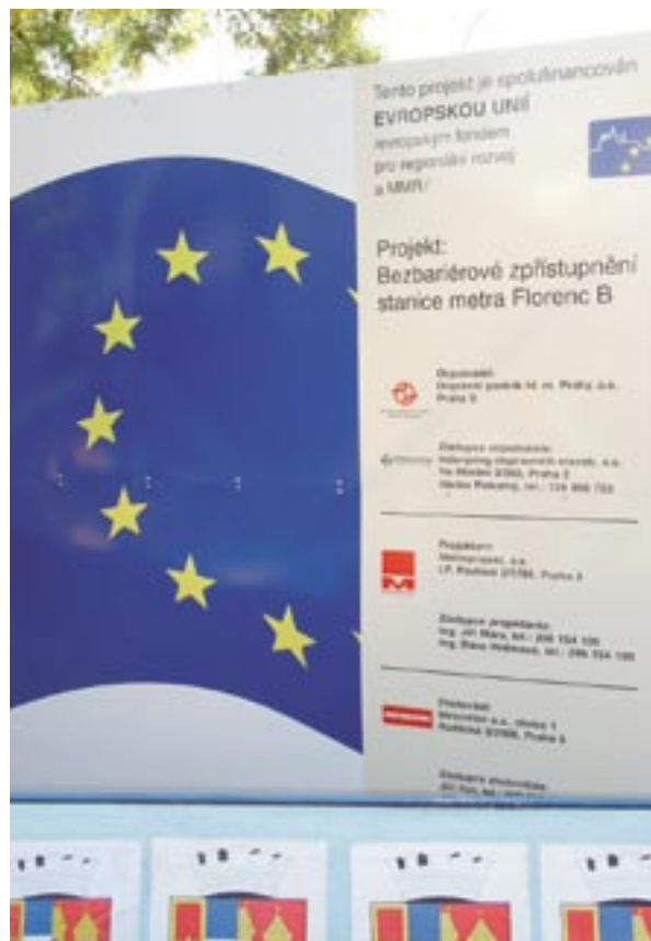
Skylt som tillkännager byggandet av en ny tunnelbanestation i Prag i Tjeckien.

Konferensen Telling the story – Cohesion policy for Growth and Jobs på temat information och PR om strukturfonderna kommer att äga rum 26–27 november 2007 i Bryssel. Dess mål kommer att vara att locka dit kommunikationstjänstemän från samtliga operativa program. Mellan 400 och 500 deltagare förväntas komma. Evenemanget kommer att fungera som en öppen marknad för presentation av olika kommunikationsmetoder, och där kommer att finnas många möjligheter att arbeta i nätverk.