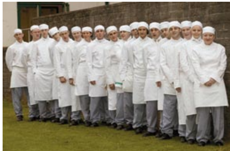
Unga kocklärlingar med en ljus framtid.