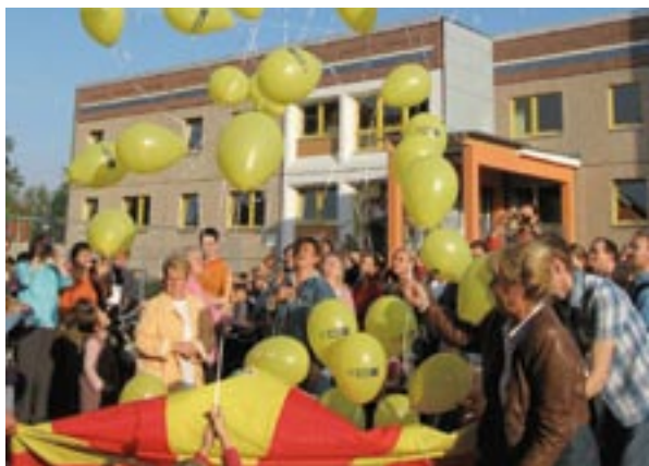
Invigning av ett daghem i Urban II-området i Leipzig i Tyskland.

med information och offentliggöranden om strukturfonderna, vilka betraktas som fundamentala element för en effektiv och öppen implementering av gemenskapens policy.