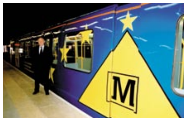
Flera av vagnarna i den nya tunnelbanan i Sunderland i England är målade i EU:s färger.